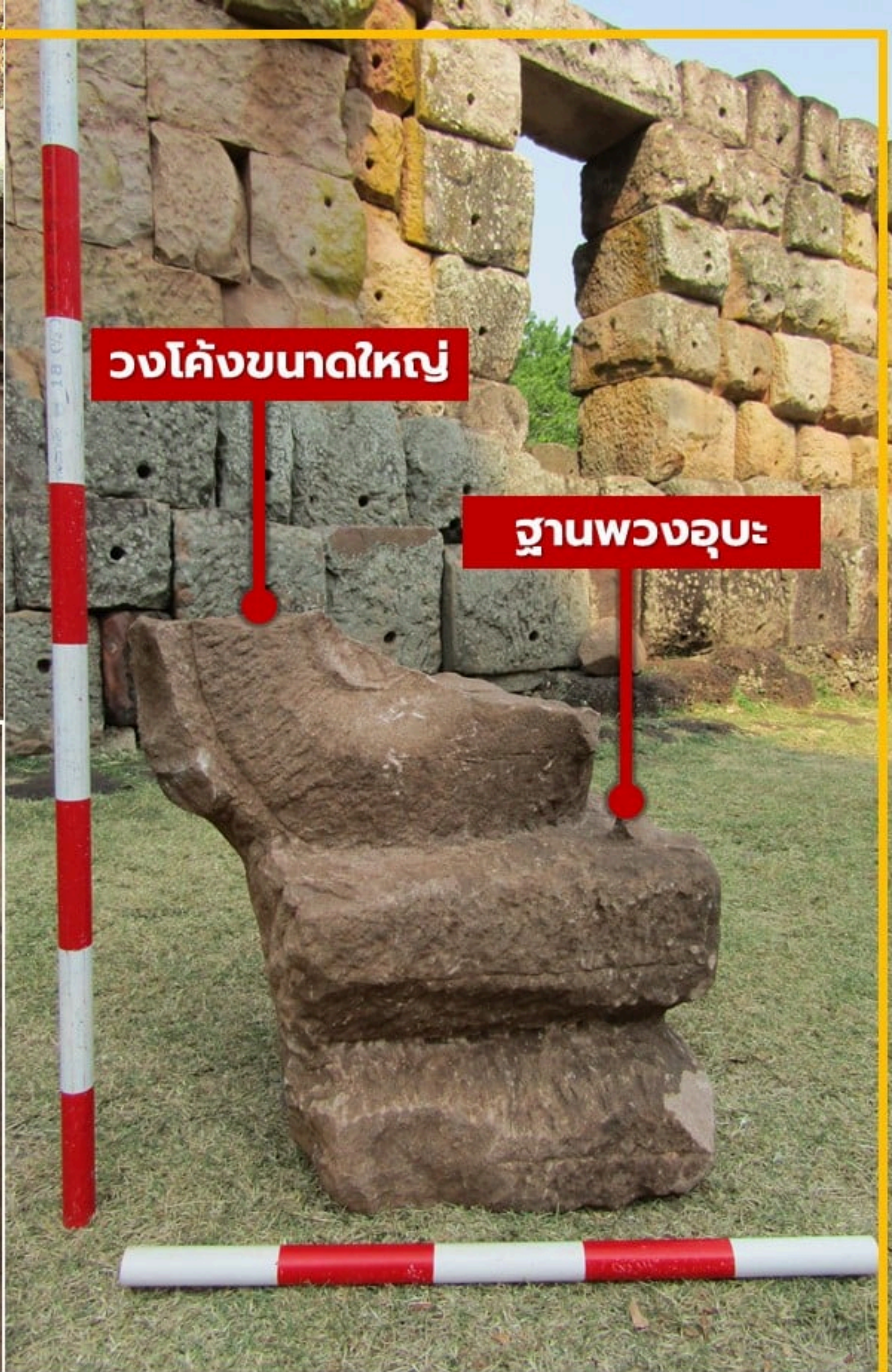
โกลนขนาดปึก พบในหลุมขุดค้นที่ ๔ (TP.4) มีลักษณะคล้ายกับขนาดปึกของปราสาทน้อย พุทธศตวรรษที่ ๑๖