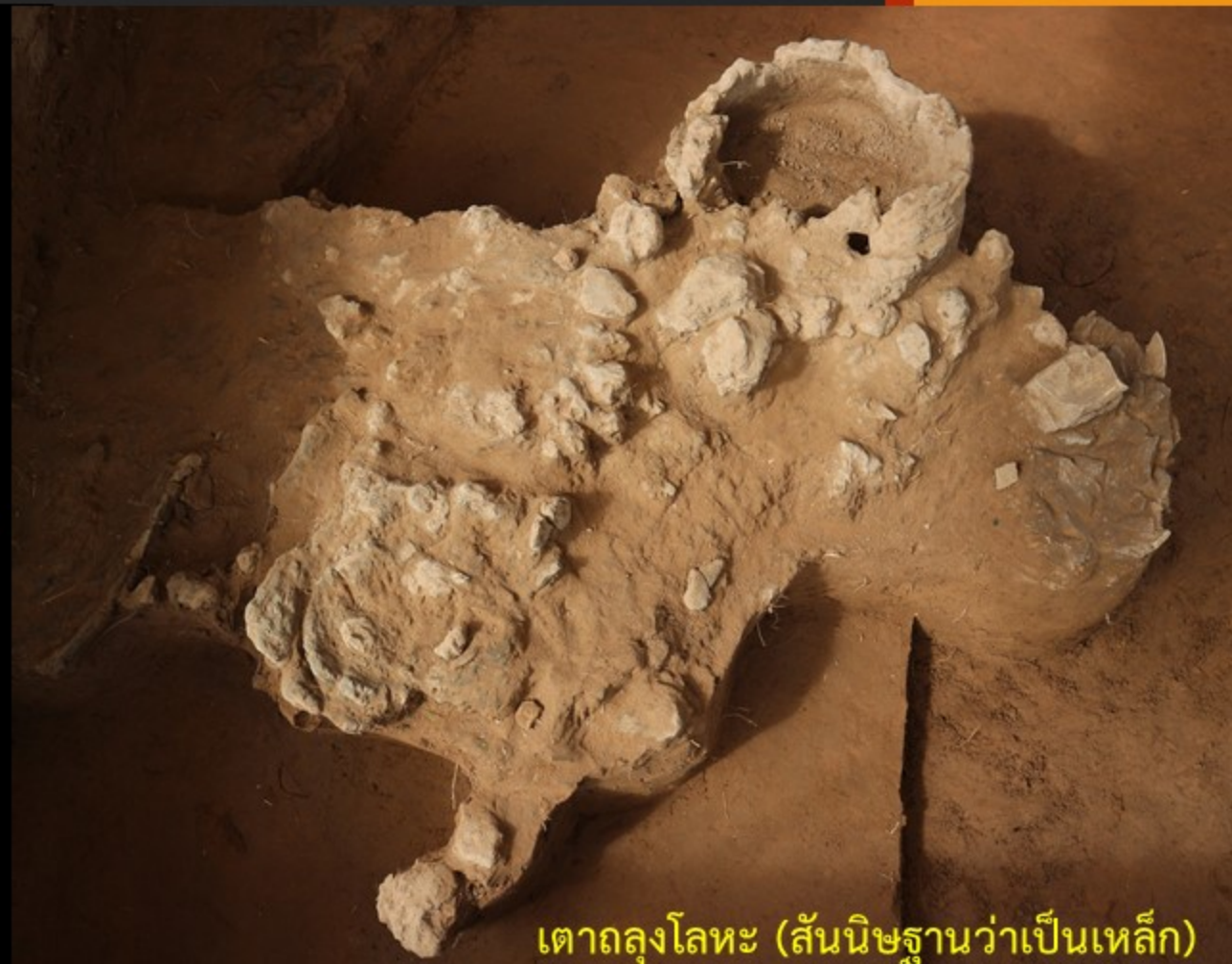
เตาถลุงโลหะ (สันนิษฐานว่าเป็นเหล็ก)