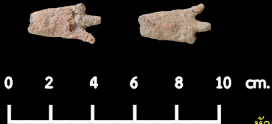
หัวลูกธนูเหล็ก