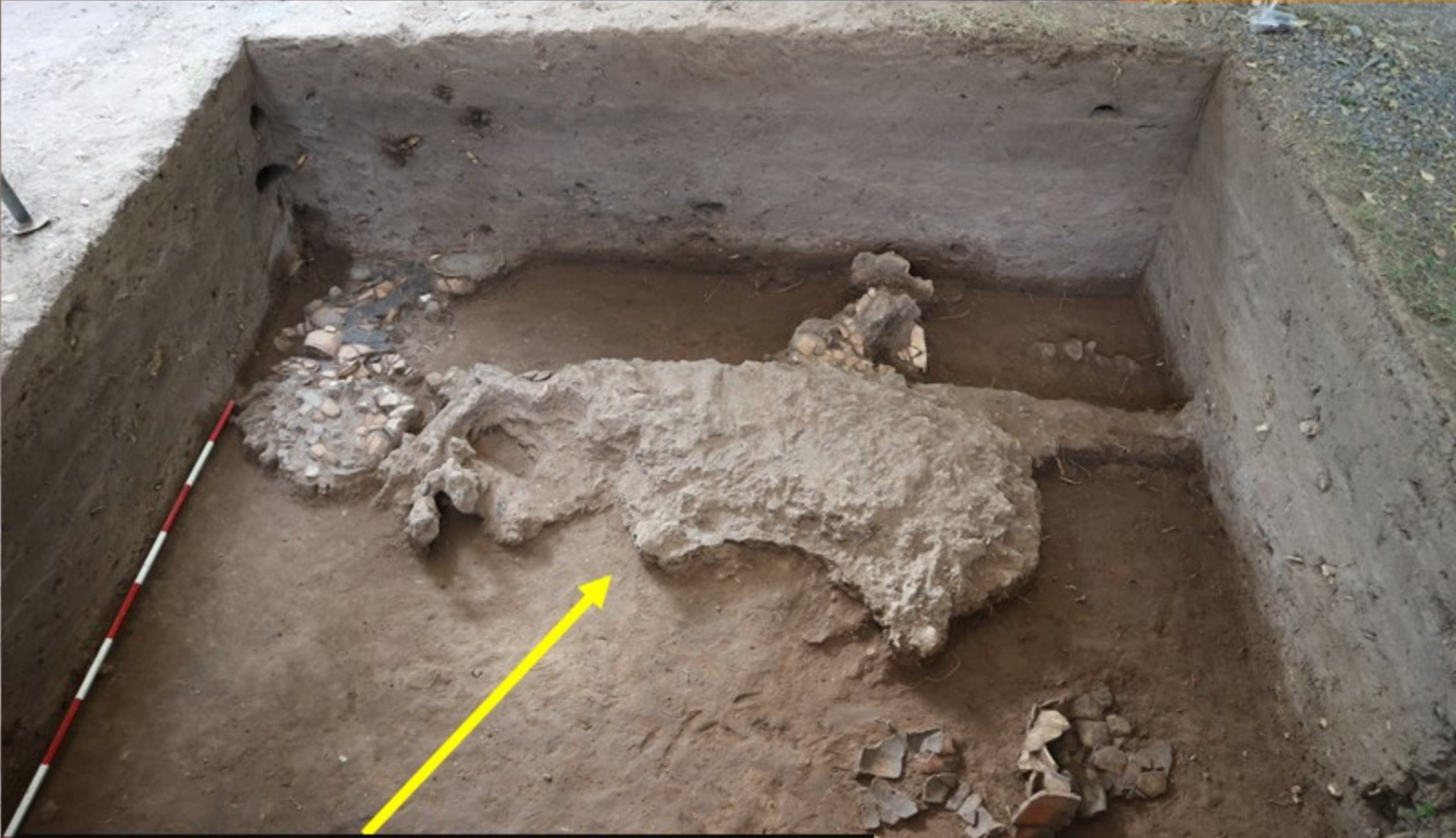
ร่องรอยพื้นดินที่ถูกความร้อนเผาไหม้เป็นเวลานาน