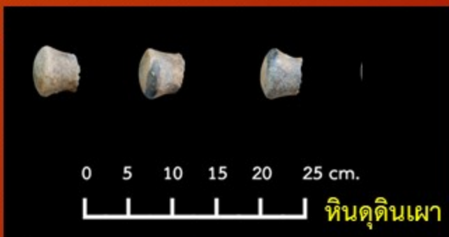
หินดุนดินเผา