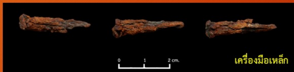
เครื่องมือเหล็ก