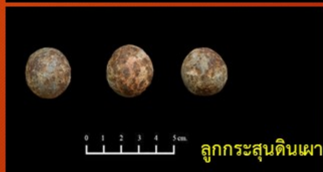
ลูกกระสุนดินเผา