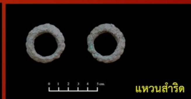
แหวนสำริด