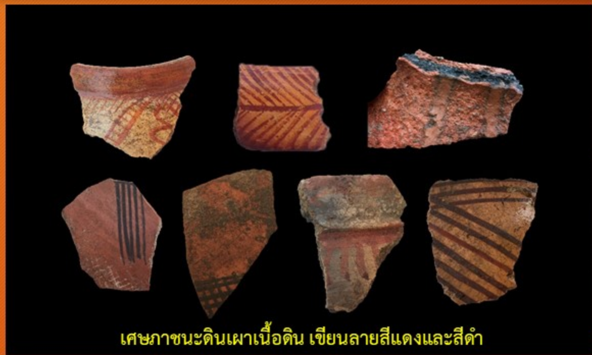
เศษภาชนะดินเผาเนื้อดิน เขียนลายสีแดงและสีดำ