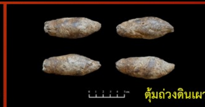
ตุ้มถ่วงดินเผา