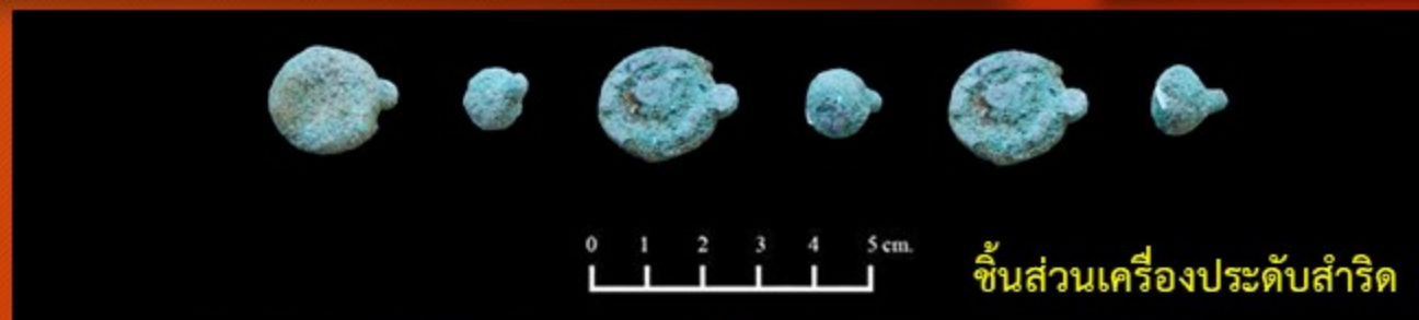
ชิ้นส่วนเครื่องประดับสำริด