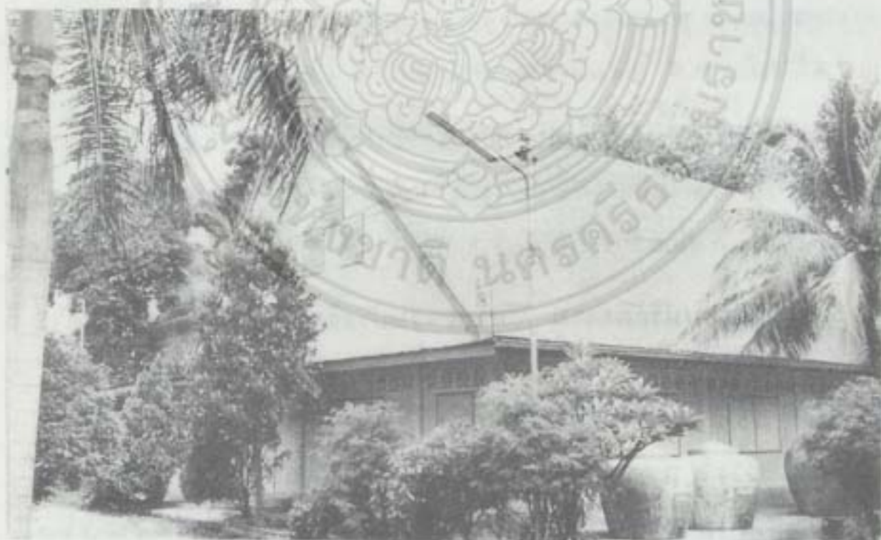
ศาลาการเปรียญ