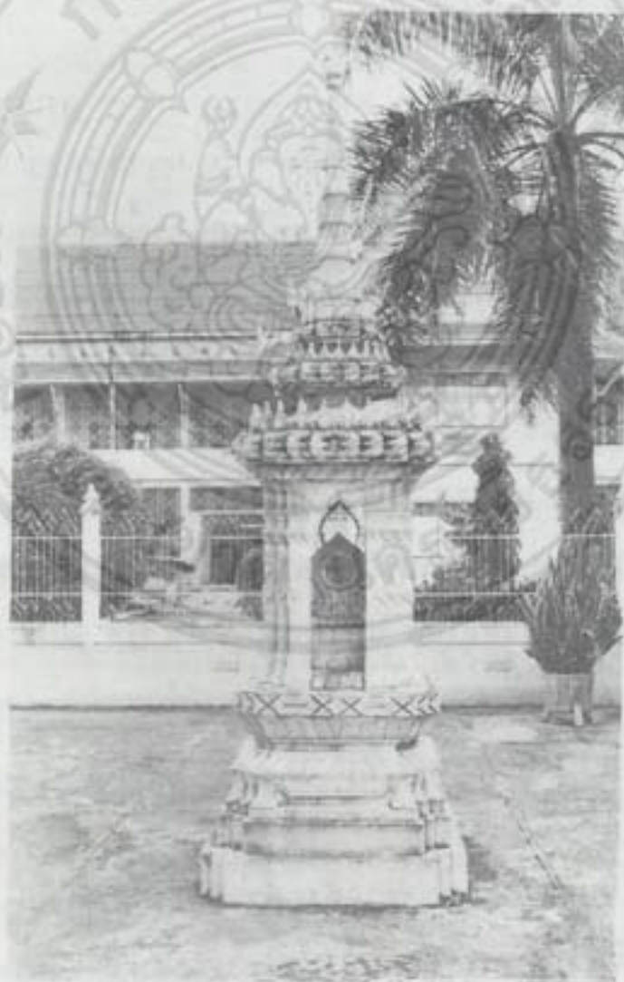
ชุ่มเสมา