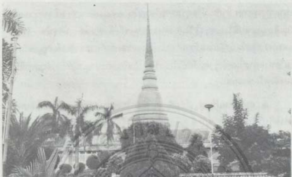
พระธาตุเจดีย์