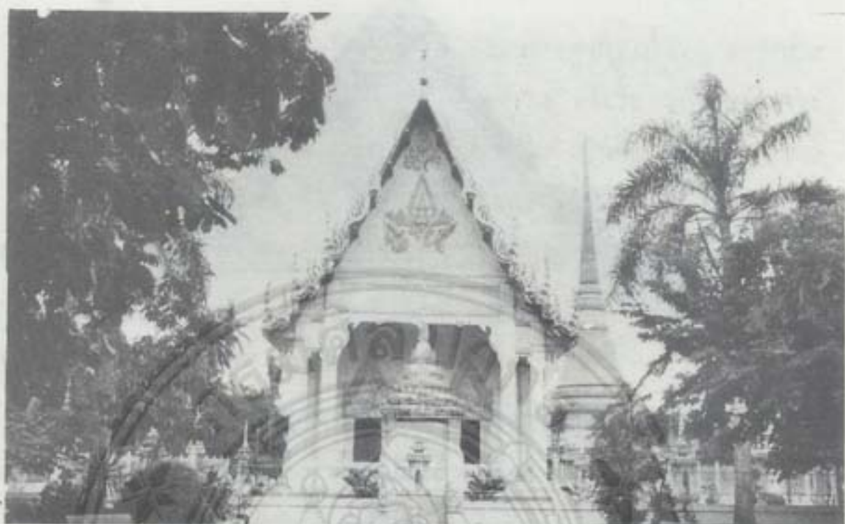
พระอุโบสถ (ด้านหน้า)