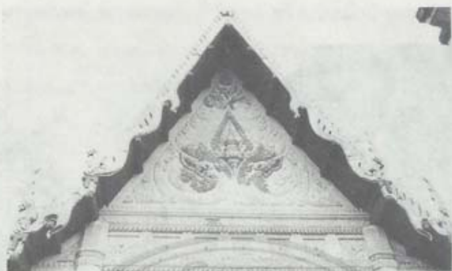
หน้าบันพระอุโบสถ