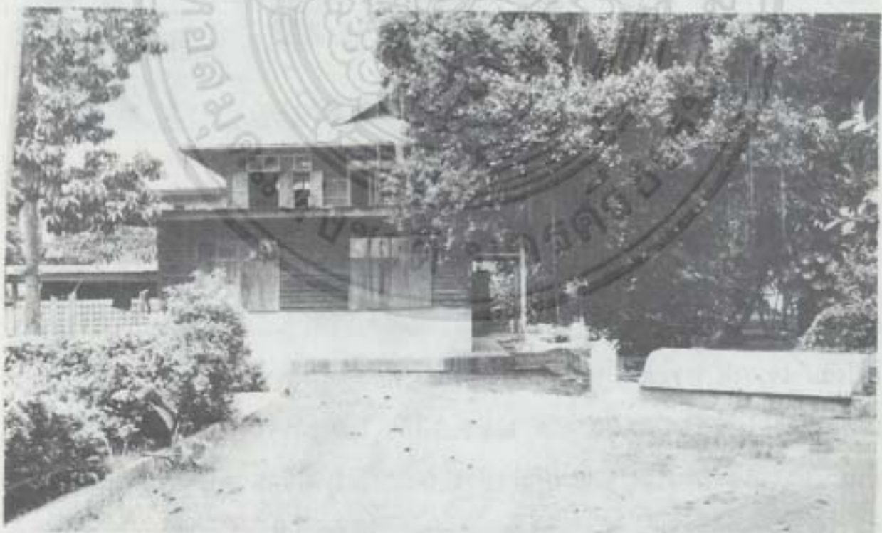
กุฎิพระสงฆ์