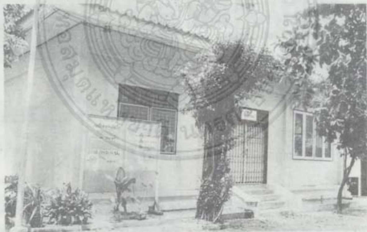
สถานที่ปฏิบัติธรรม