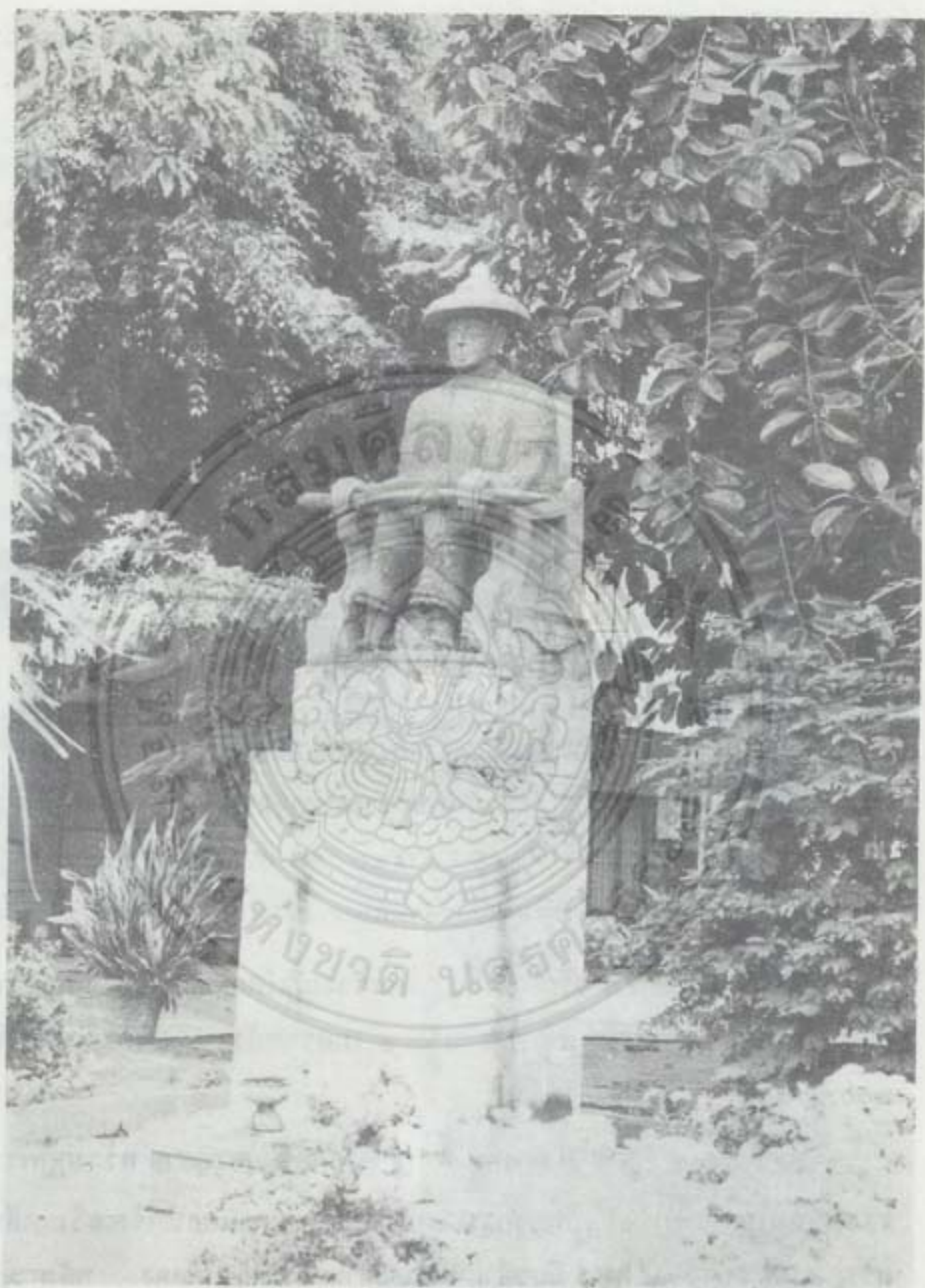
อนุสาวรีย์พระนครศรีบริรักษ์ (เพี้ยเมืองแพน) ผู้สร้างวัดธาตุ