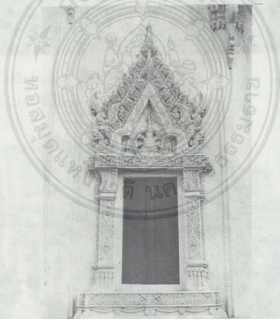
ซุ้มหน้าต่างพระอุโบสถ