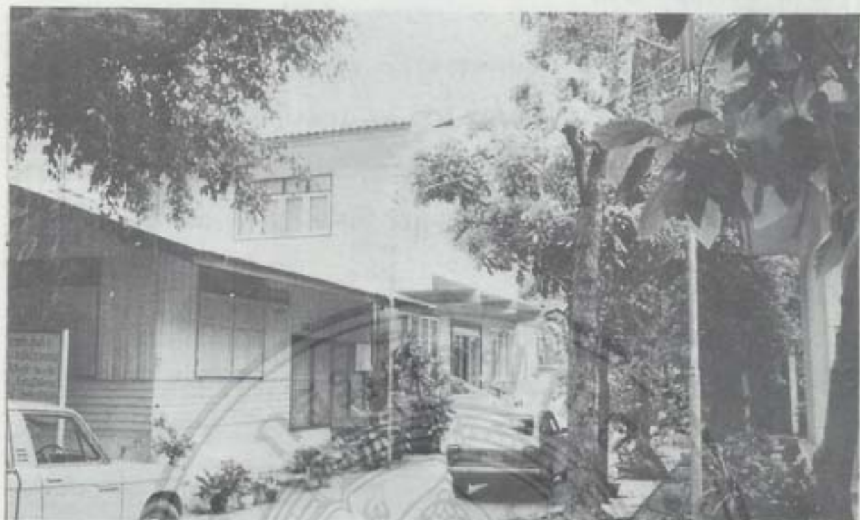
กุฎิเจ้าอาวาส