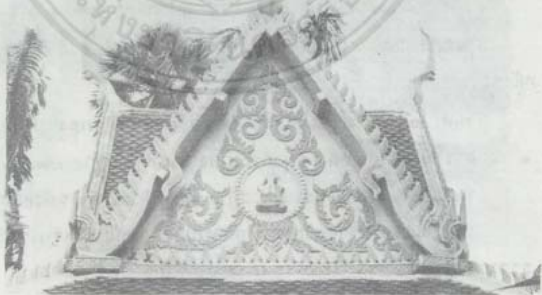
หน้าบัน ศาลาราย