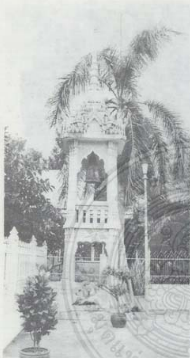
หอรระผึ้ง