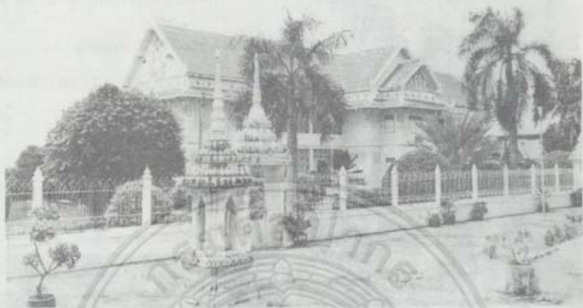
โรงเรียนปริยัติธรรม