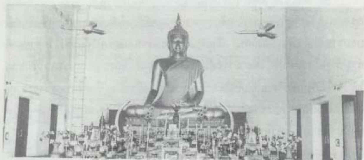
พระพุทธรูปธรรมขันธ์โสภิต มหามงคล พระประธานในพระอุโบสถ