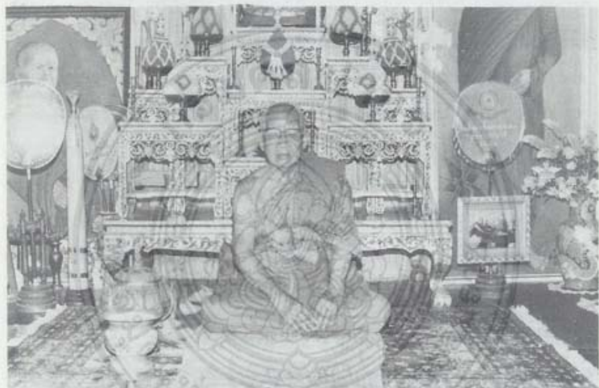
พระราชสารเวที (เหล่านุ สุมโน ป.ธ.๕) รองเจ้าคณะภาค ๙ เจ้าอาวาสวัดธาตุ