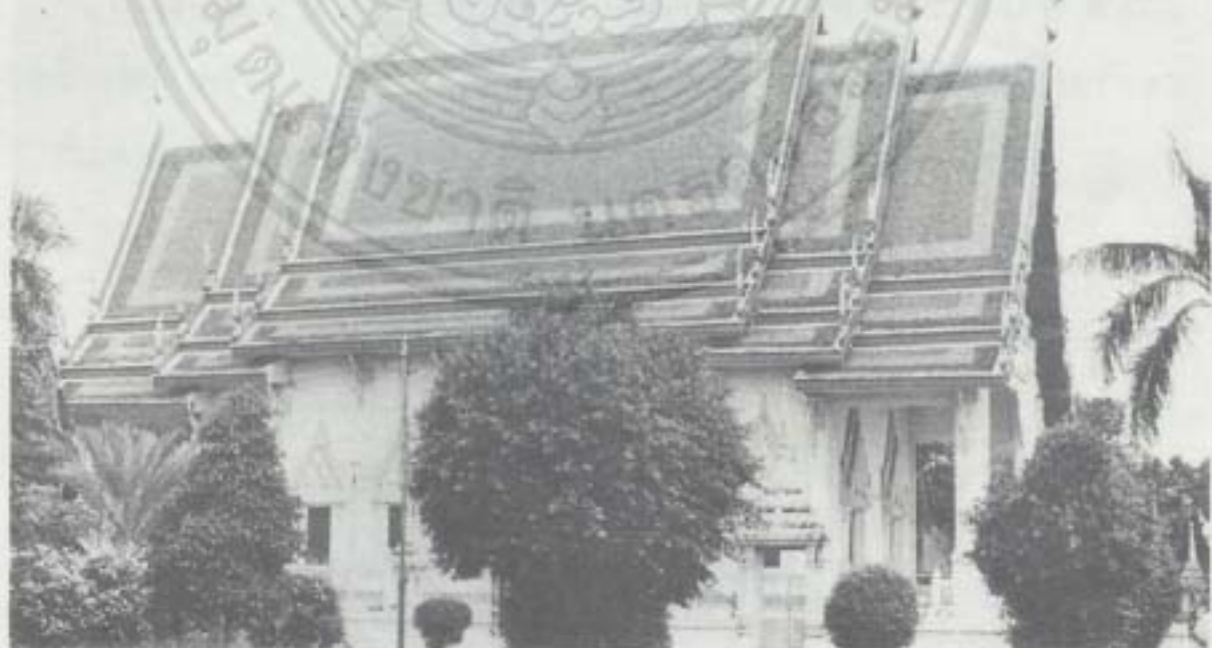
พระอุโบสถ (ด้านข้าง)