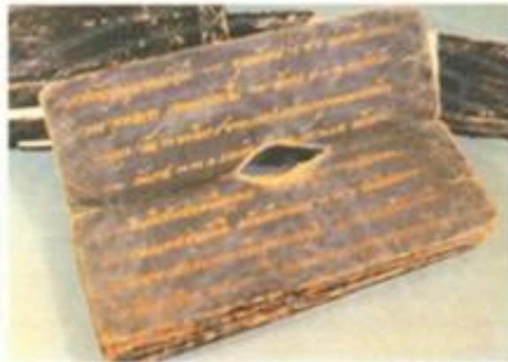
หนังสือพงศาวดารกรุงศรีอยุธยา ฉบับหลวงประเสริฐอักษรนิติ์

หนังสือสมุดไทยฉบับเก่าแก่ที่สุด ซึ่งเก็บรักษาไว้ที่กลุ่มหนังสือตัวเขียนและจารึก สำนักหอสมุดแห่งชาติ คือ หนังสือสมุดไทยคำ เรื่องพงศาวดารกรุงศรีอยุธยาฉบับหลวงประเสริฐอักษรนิติ์ สร้างขึ้นในปี พ.ศ.2223