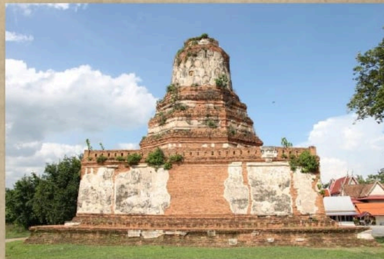
เจดีย์วัดอโยธยา จังหวัดอยุธยา

๑. เจดีย์ทรงปราสาทยอดที่มีเรือนธาตุสองชั้น (สี่เหลี่ยมและแปดเหลี่ยม) ปรากฏในเมืองสรรคบุรี จังหวัดชัยนาท และสุพรรณบุรี