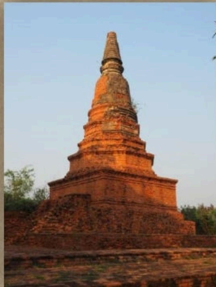
เจดีย์วัดแร้ง