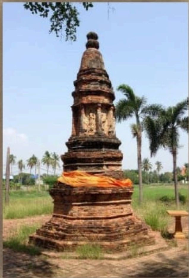
เจดีย์วัดไก่อเตี้ย