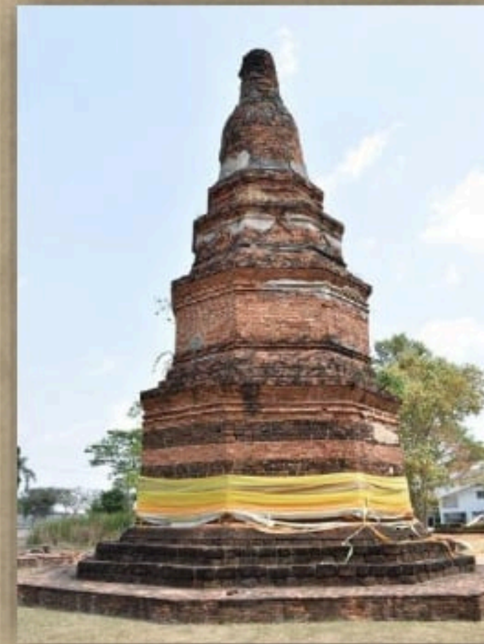
เจดีย์วัดมรกต