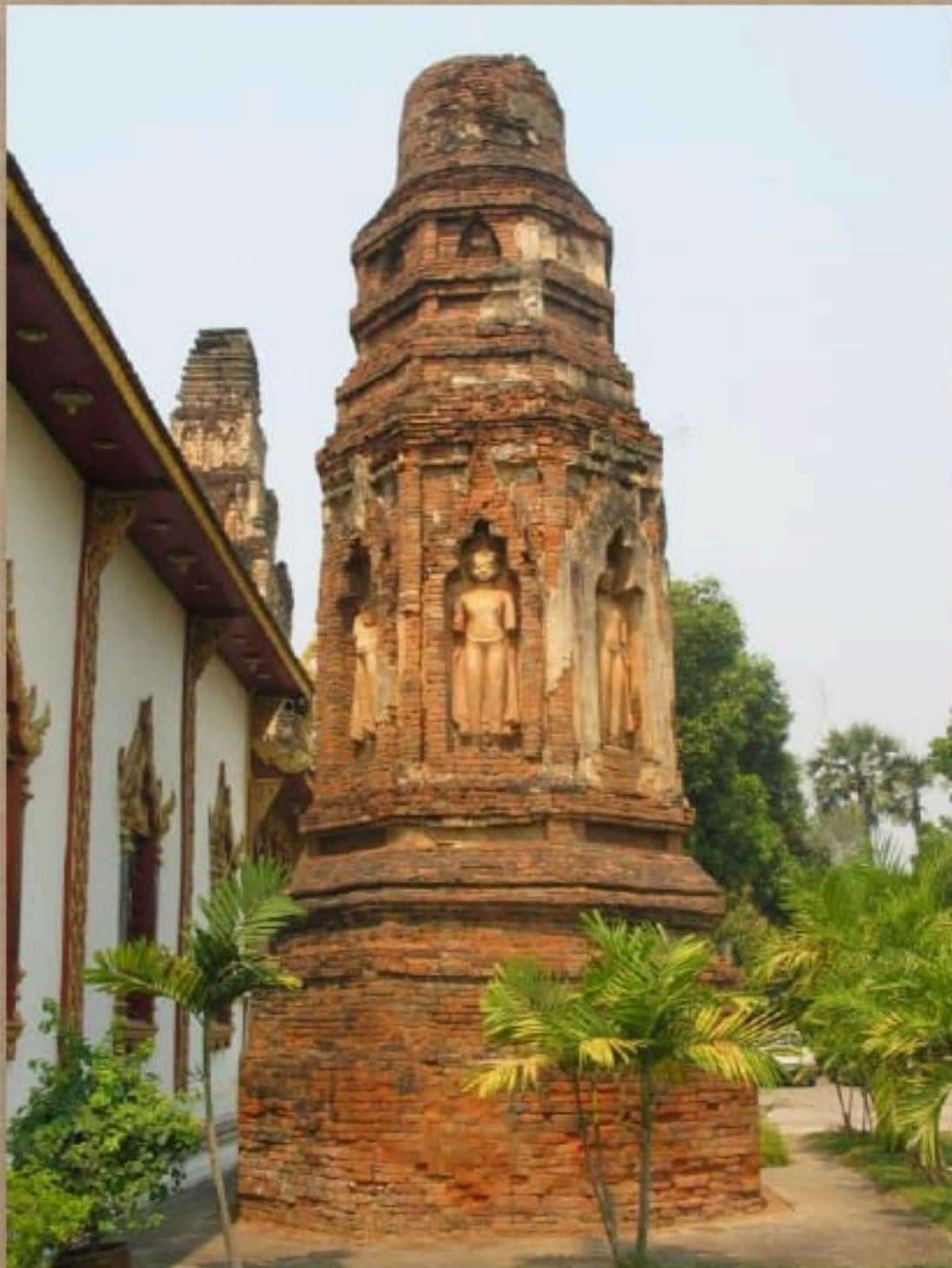
รัตนเจดีย์ วัดจามเทวี จังหวัดลำพูน ศิลปะหริภุญชัย พุทธศตวรรษที่ ๑๘