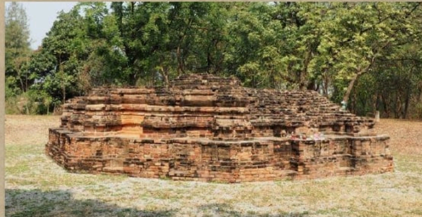
เจดีย์หมายเลข ๑๓ เมืองโบราณอู่ทอง ศิลปะทวารวดี พุทธศตวรรษที่ ๑๔ - ๑๖