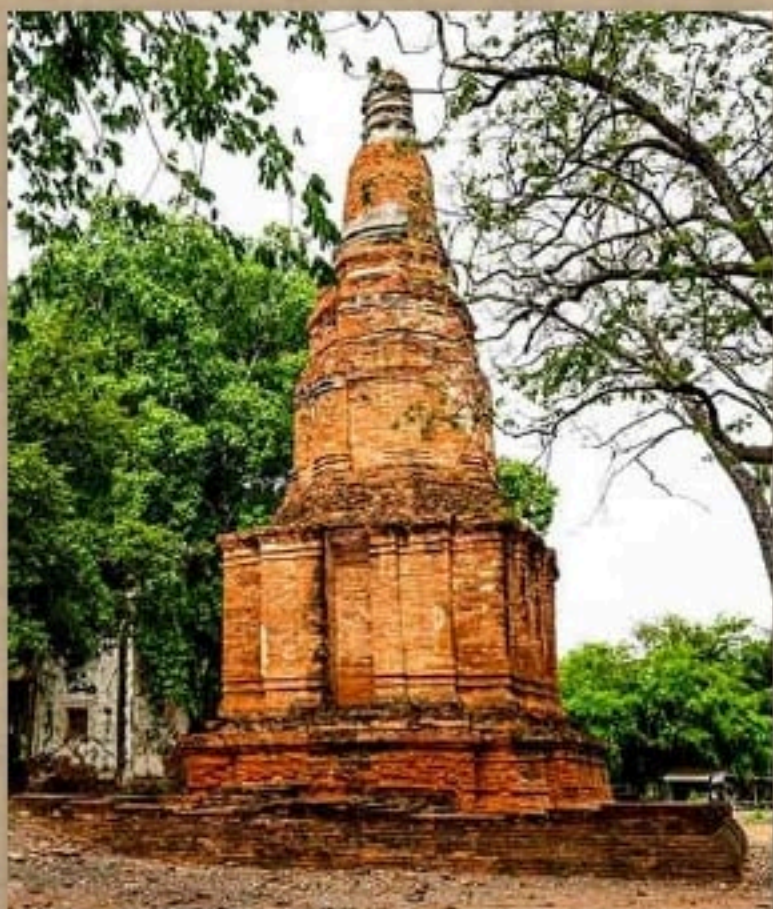
เจดีย์วัดพระรูป จังหวัดสุพรรณบุรี

การทำเจดีย์แปดเหลี่ยมเป็นที่นิยมในศิลปะก่อนอยุธยาหรืออุทอง และนิยมต่อมาถึงศิลปะอยุธยาตอนต้น แบ่งเป็น ๒ แบบ คือ