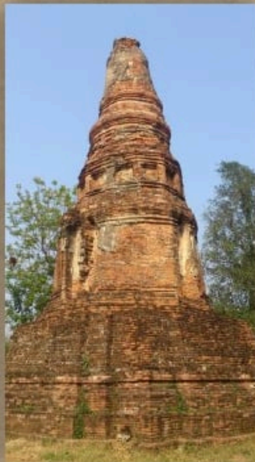
เจดีย์วัดพระอินทร์