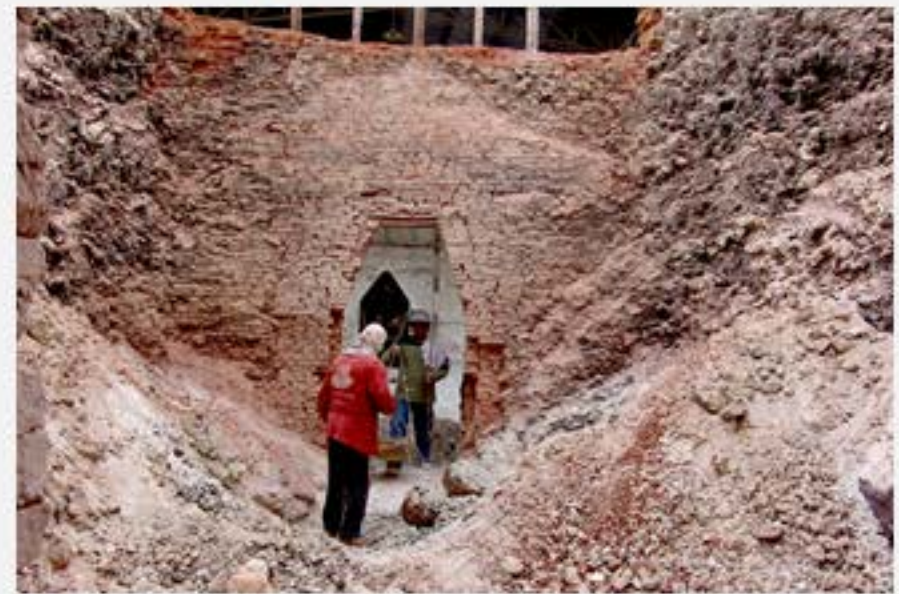
สภาพภายในเตาปูน อิฐที่ผนังเตาหลอมจับตัวกันเพราะถูกความร้อนต่อเนื่อง และกองปูนขาวที่แตกออกหลังจากเผา