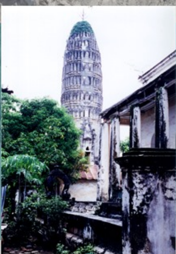
ปูนปั้นประดับพระปรางค์ วัดอรุณญิกาวาส ราชบุรี