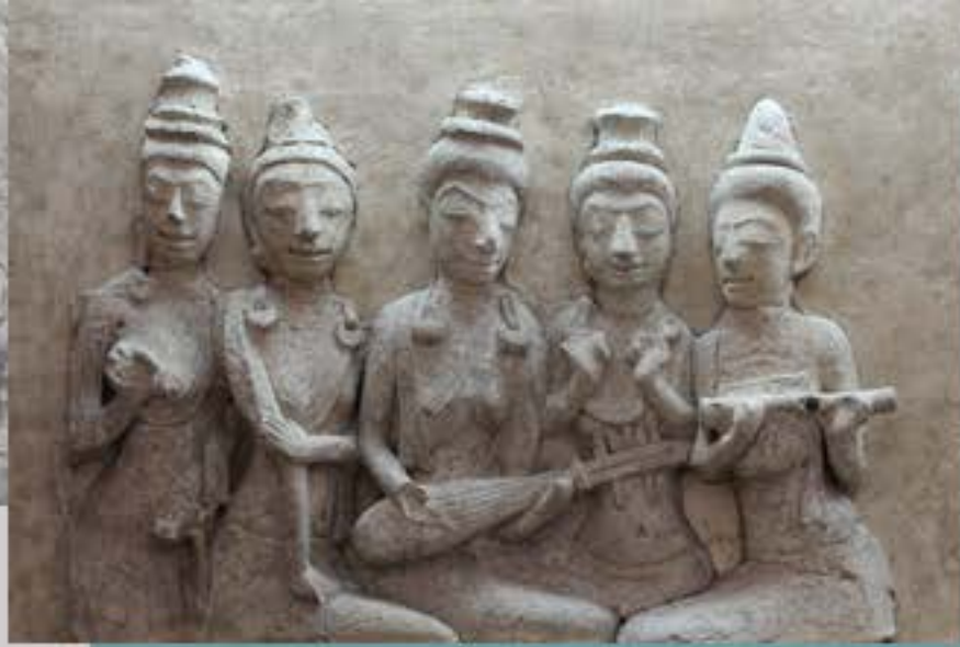
ภาพปูนปั้นสตรีทั้งห้า จาก โบราณสถานหมายเลข 10 เมืองคูบัว

ปูน ถือเป็นหลักฐานที่พบมาตั้งแต่ใน สมัยแรกเริ่มประวัติศาสตร์มาจนถึงสมัย ปัจจุบัน มักใช้เป็นวัสดุก่อสร้าง และใช้ใน การประดับตกแต่งเป็นลวดลายต่าง ๆ ใน งานศิลปกรรม