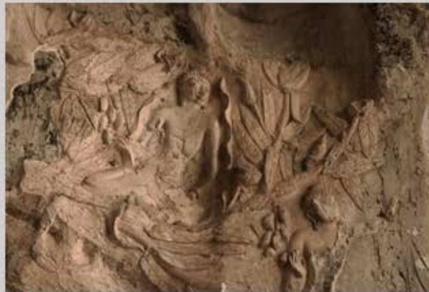
ภาพพุทธประวัติปูนปั้นตอนแสดงยมกปาฏิหาริย์ ใต้ต้นมะม่วง บริเวณถ้ำจาม อุทยานหินเขางู