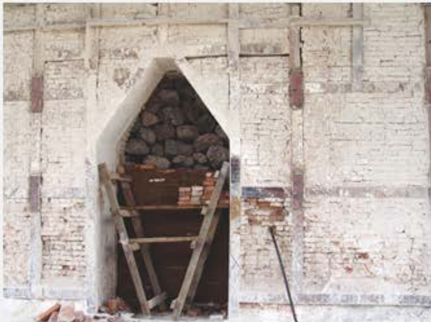
ก้อนหินปูนที่นำไปใส่ภายในเตาเตรียมเผา