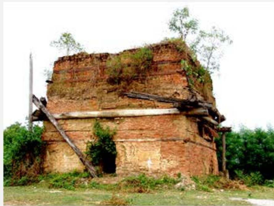
เตาเผาปูน ต.หลุมดิน อ.เมือง จ.ราชบุรี