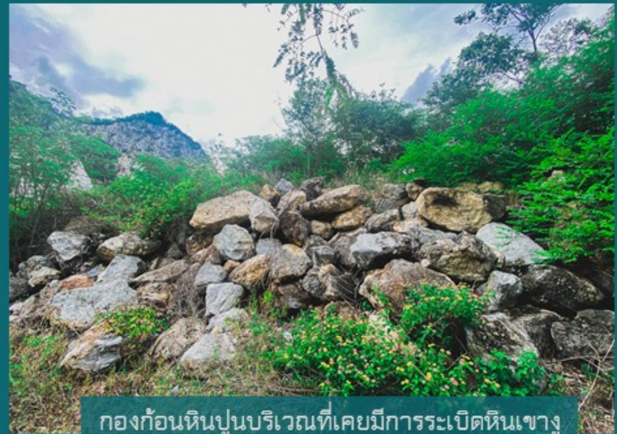
กองก้อนหินปูนบริเวณที่เคยมีการระเบิดหินเขาสูง

ท้ายที่สุดในปี พ.ศ. 2530 คณะรัฐมนตรีได้มีมติ ให้ระงับการระเบิดหินในบริเวณเขาสูง จึงถือว่าเป็น การปิดฉากเขาสูงในฐานะแหล่งอุตสาหกรรม ระเบิดหินปูนที่สำคัญลงไปเป็นที่สุด หลังจากนั้น มีการปรับเปลี่ยนแหล่งระเบิดหินปูนแห่งนี้เป็น สถานที่ท่องเที่ยวสำหรับพักผ่อน จึงกลายเป็น อุทยานหินเขาสูงดังปัจจุบัน