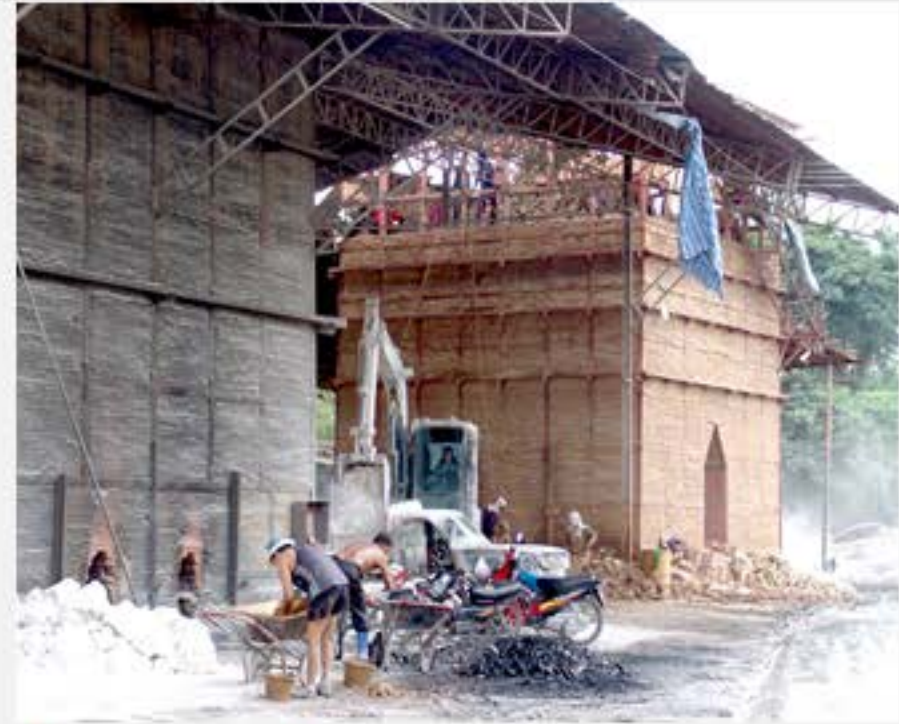
เตาเผาปูน อ.ปากท่อ จ.ราชบุรี