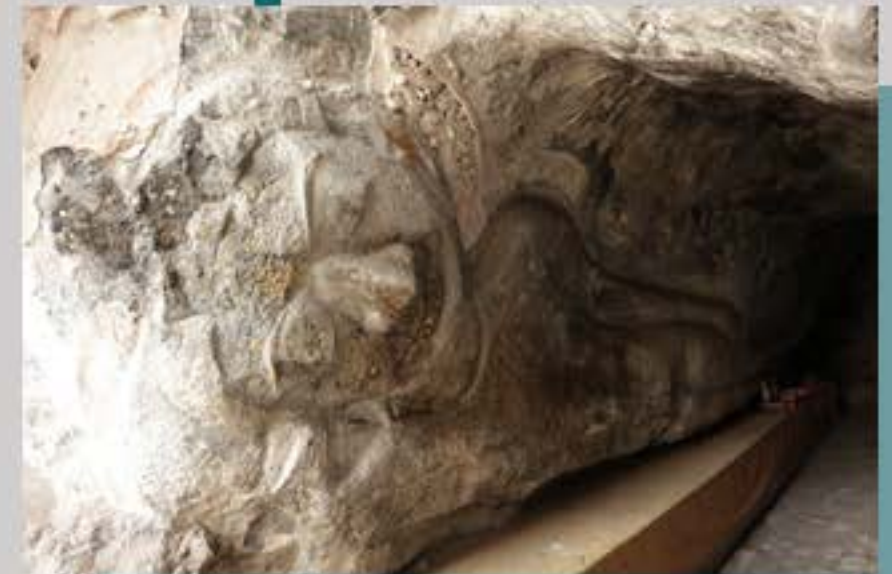
ภาพพระพุทธรูปสลักหินประดับปูนปั้น บริเวณถ้ำฝาโถ อุทยานหินเขางู