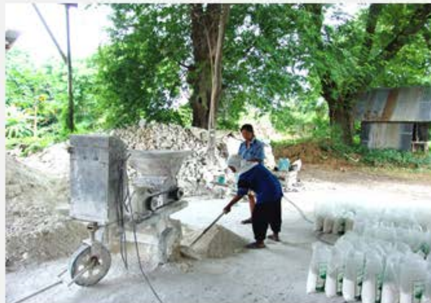
ระหว่างโกยปูนขาว และบรรจุลงถุง