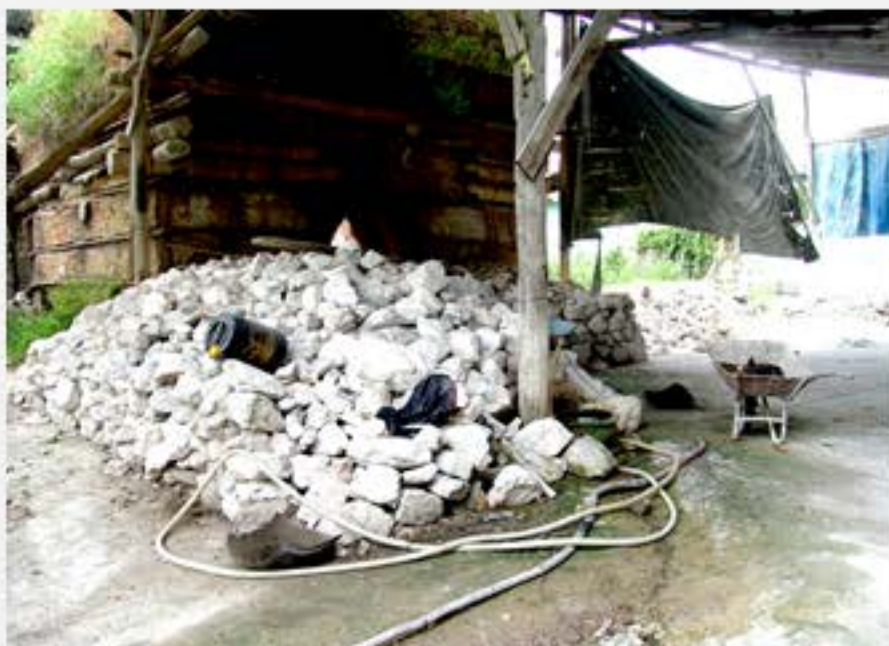
ก้อนหินปูนที่เตรียมจะนำไปใส่เผาในเตา