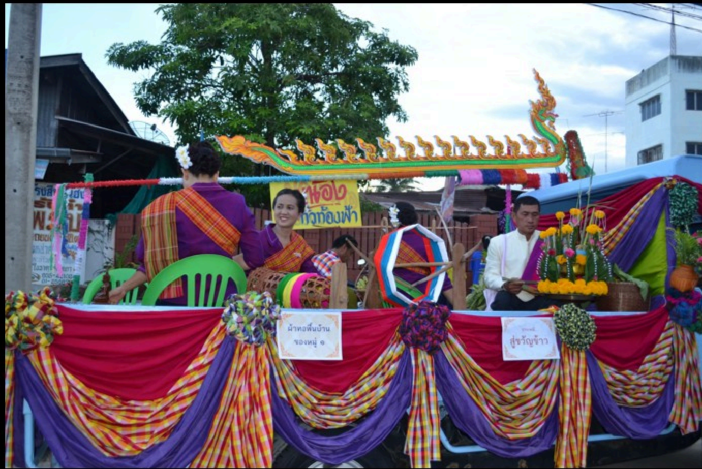
งานบุญบั้งไฟของชาวไทยเวียง อำเภออุ้มทอง จังหวัดสุพรรณบุรี

ไทยเวียง หรือ ลาวเวียง มีถิ่นฐานเดิมอยู่ในเขตเมืองเวียงจันทน์ สาธารณรัฐประชาธิปไตยประชาชนลาว อพยพเข้ามาในประเทศไทยครั้งแรกในสมัยธนบุรี และอพยพเข้ามาอีกครั้งเมื่อเกิดเหตุการณ์กบฏเจ้าอนุวงศ์ สมัยพระบาทสมเด็จพระนั่งเกล้าเจ้าอยู่หัว โดยเข้ามาตั้งถิ่นฐานอยู่ที่จังหวัดต่าง ๆ ในภาคตะวันออกเฉียงเหนือ ภาคตะวันออก และภาคกลาง