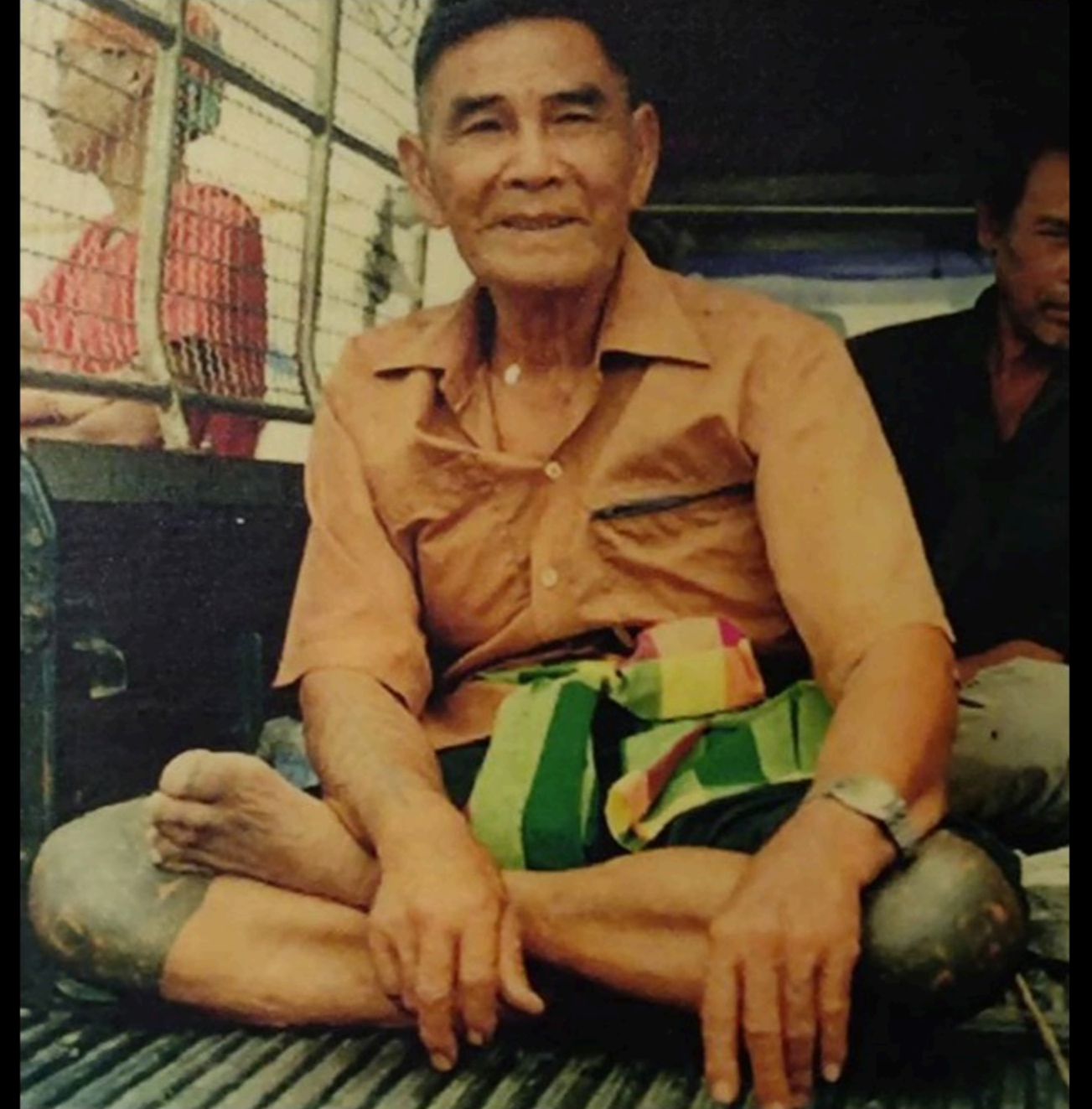
ชายชาวไทยเวียงที่มีรอยลักขา ห้างคนสุพรรณ พิพิธภัณฑ์สถานแห่งชาติ สุพรรณบุรี