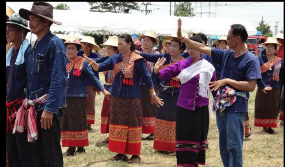
งานบุญบั้งไฟของชาวไทยเวียง อำเภออุ้มทอง จังหวัดสุพรรณบุรี

ในจังหวัดสุพรรณบุรี มีชาวไทยเวียงอาศัยอยู่ในเขตอำเภอเมืองสุพรรณบุรี และอำเภออุ้มทอง มีการแต่งกายด้วยผ้าทออันเป็นเอกลักษณ์ มีการเล่นเพลงแคนและประเพณีการแห่บั้งไฟที่ยังคงสืบทอดต่อกันมา แต่อัตลักษณ์หนึ่งที่กำลังหายไปคือ การสักขาลายของบุรุษชาวไทยเวียง