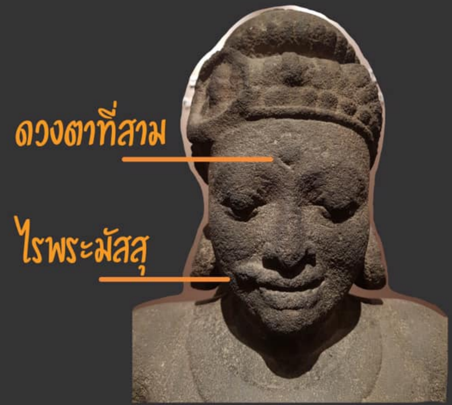
ด้านขวาแสดงลักษณะบุรุษ (พระศิวะ)