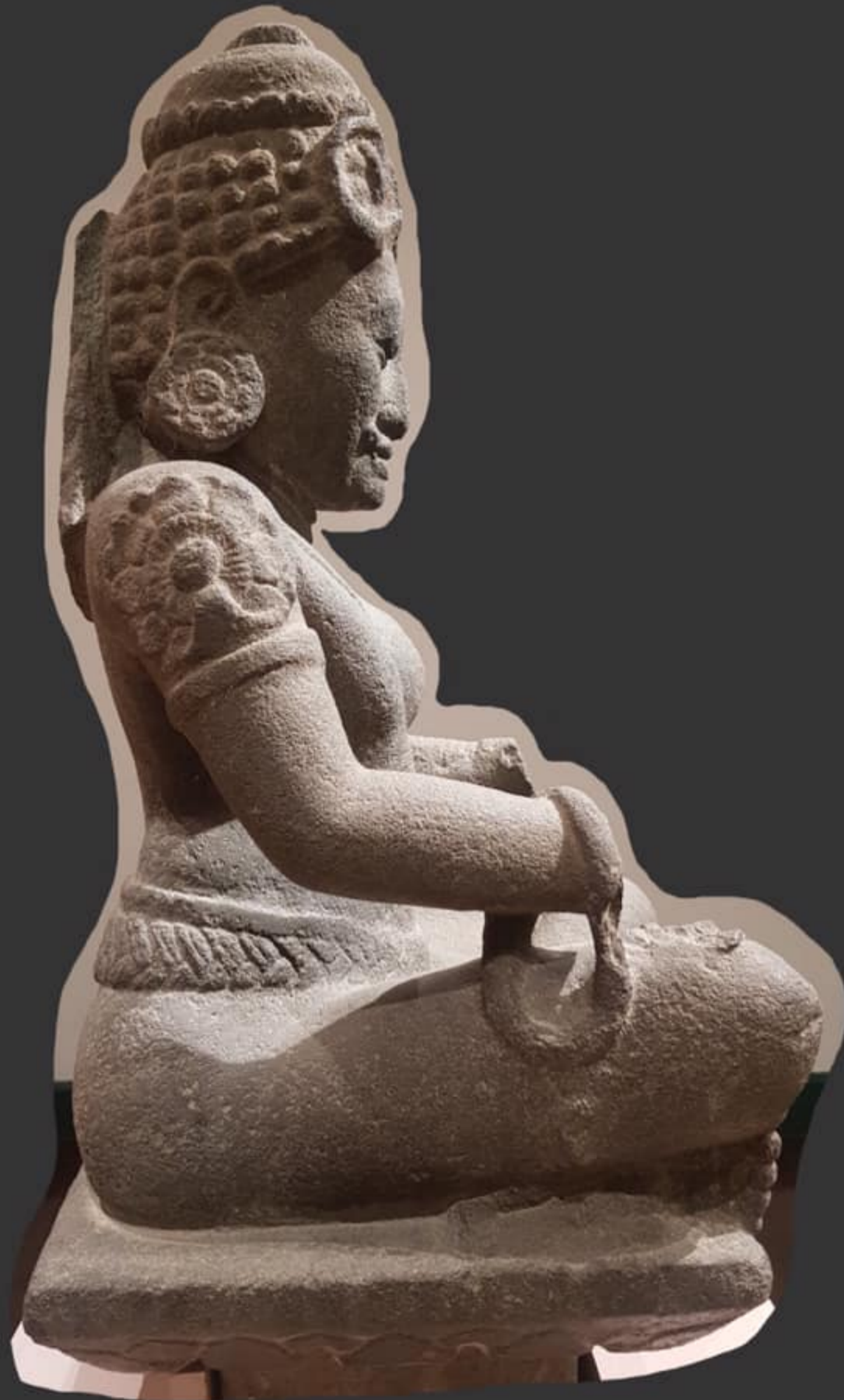
ด้านขวาแสดงลักษณะบุรุษ (พระศิวะ)