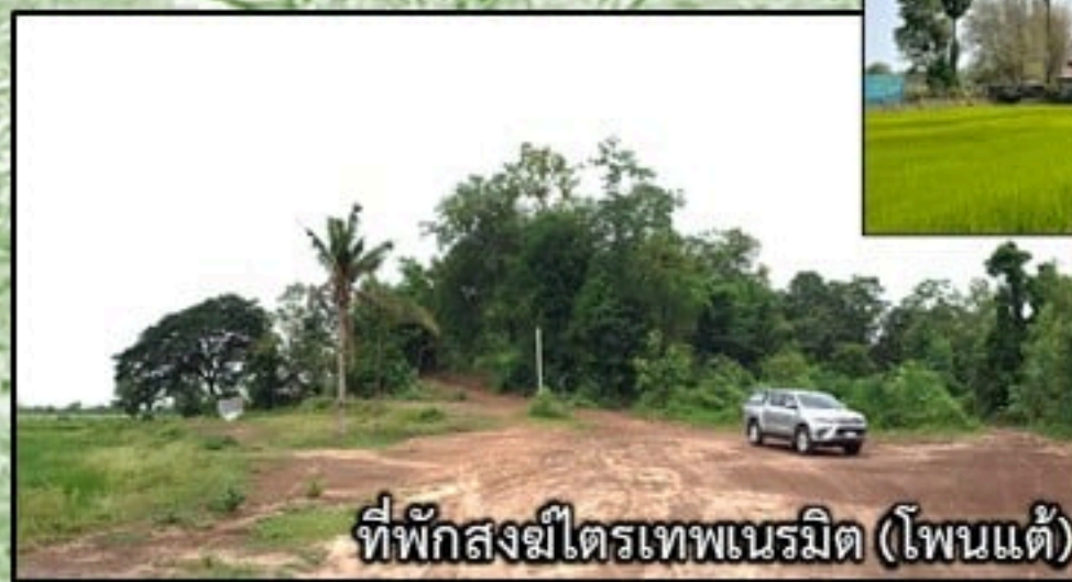
ที่พักสงฆ์ไตรเทพเนรมิต (โพนแต้)