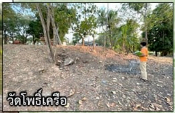
วัดโพธิ์เครือ