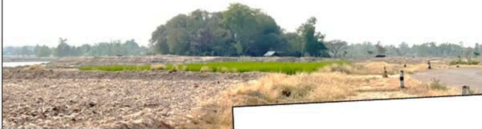
วัดโพนสวรรค์ (โพนสูง)