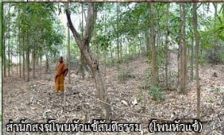
สำนักสงฆ์โพนหัวเข้สันติธรรม (โพนหัวเข้)