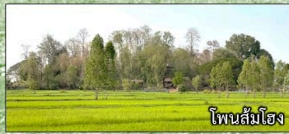
โพนส้มโฮง