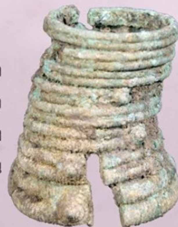
กำไลข้อมือสำริด

มีลักษณะเกือบเป็นทรงกระบอก ตัวกำไลผ่าเป็นแนวยาวโดยตลอด มีตะขอสำหรับเกี่ยวยึดวงกำไล ๒ แห่ง ที่ผิวด้านนอกตกแต่งด้วยลายเส้นเชือกพันโดยรอบบางแห่งทำเป็นลายก้นหอย