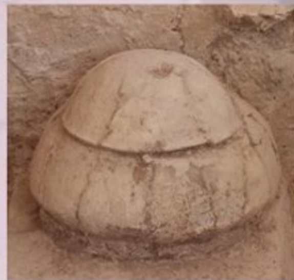
ภาชนะดินเผาบรรจุกระดูก (Burial Jar)

มีลักษณะเป็นภาชนะทรงรี หรือทรงรูปไข่ ก้นกลม และภาชนะทรงกลม ทรงกะลา หรือทรงกระทะ บางกลุ่มมีภาชนะดินเผาขนาดเล็กบรรจุอยู่ภายใน และบางใบมีกลีบข้าวหรือเมล็ดข้าวเปลือกบรรจุอยู่เต็ม