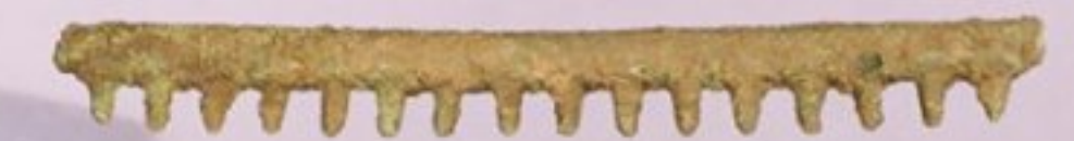
หวีสำริด (?)

เป็นแท่งกลมยาว มีซี่ยื่นออกมาคล้ายหวี ตกแต่งด้วยลายเส้นเชือกขดพันรอบและ ทำเป็นลายก้นหอยที่ฐานของซี่