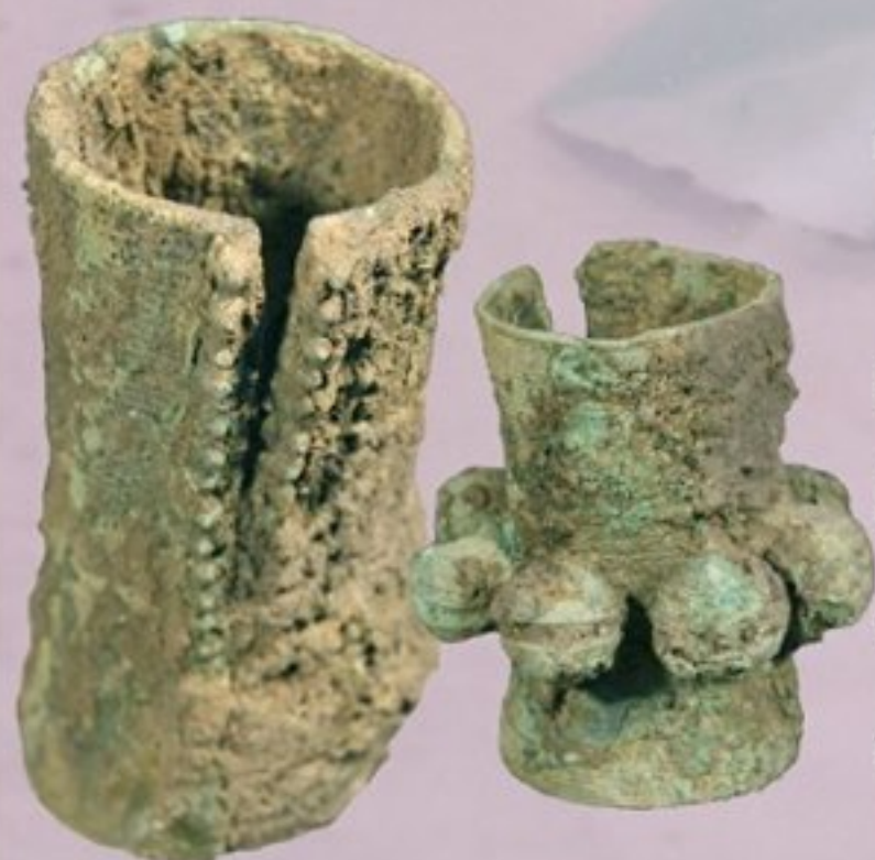
กำไลแขนสำริด

มีลักษณะเกือบเป็นทรงกระบอก ตัวกำไลผ่าเป็นแนวยาวโดยตลอด มีตะขอสำหรับเกี่ยวยึดวงกำไล ๒ แห่ง ที่ผิวด้านนอกตกแต่งด้วยลายเส้นเชือกพันโดยรอบบางแห่งทำเป็นลายก้นหอย