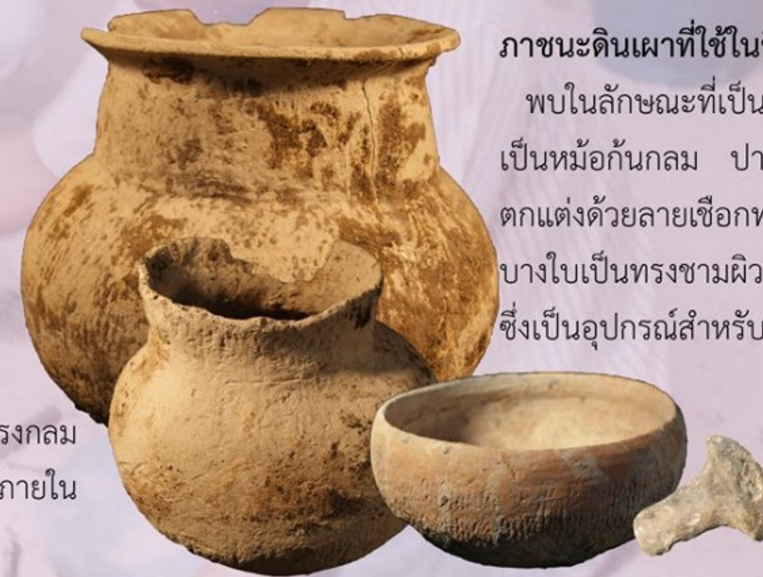
ภาชนะดินเผาที่ใช้ในชีวิตประจำวัน

มีลักษณะเป็นภาชนะทรงรี หรือทรงรูปไข่ ก้นกลม และภาชนะทรงกลม ทรงกะลา หรือทรงกระทะ บางกลุ่มมีภาชนะดินเผาขนาดเล็กบรรจุอยู่ภายใน และบางใบมีกลีบข้าวหรือเมล็ดข้าวเปลือกบรรจุอยู่เต็ม