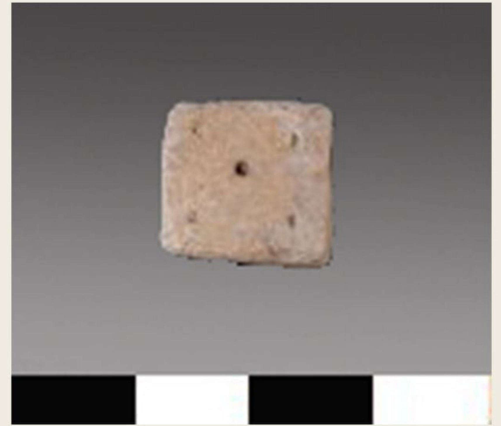
ลูกเต๋ารูปแท่งยาว ทำด้วยกระดุก พบในชั้นวัฒนธรรมสมัยที่ ๒ แหล่งโบราณคดีเนินมะกอก อำเภอโคกสำโรง จังหวัดลพบุรี พุทธศตวรรษที่ ๙ - ๑๐ (๑,๖๐๐ - ๑,๓๐๐ ปีมาแล้ว)