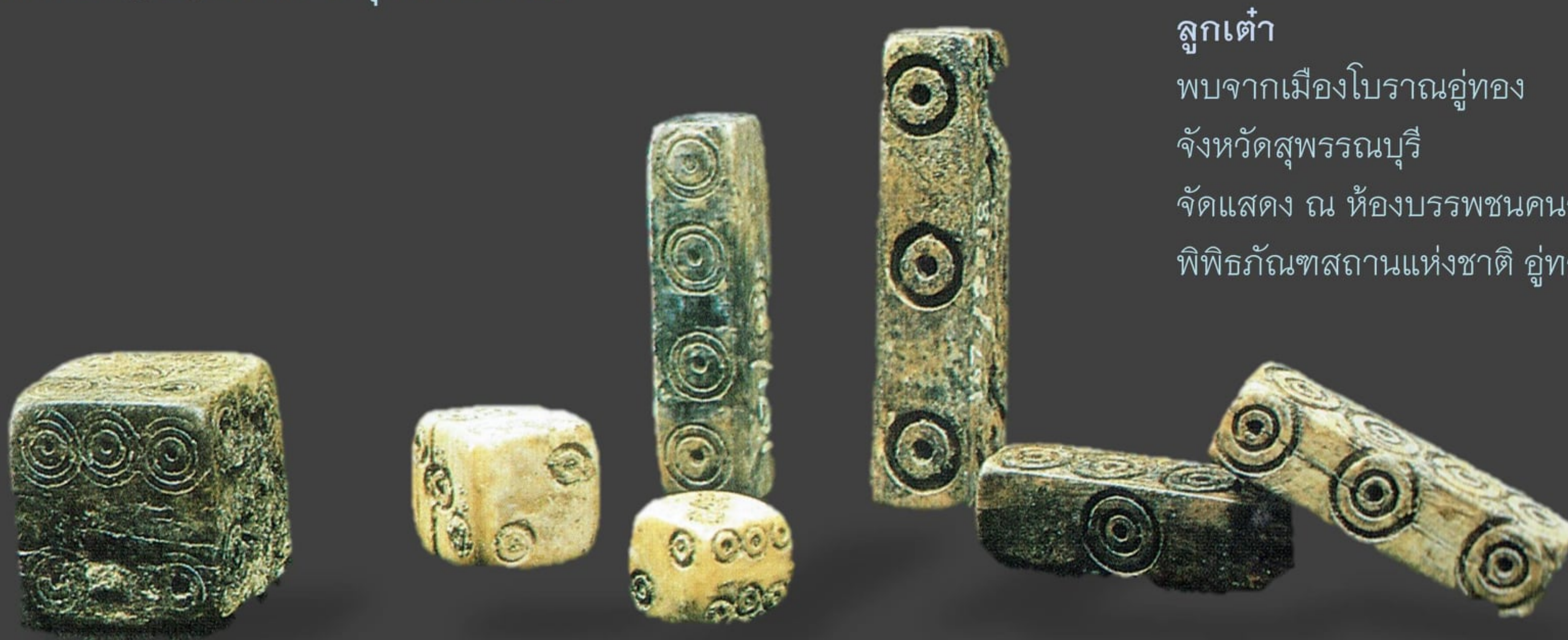
ลูกเต๋า พบจากเมืองโบราณอู่ทอง จังหวัดสุพรรณบุรี จัดแสดง ณ ห้องบรรพชนคนอู่ทอง พิพิธภัณฑสถานแห่งชาติ อู่ทอง

ลูกเต๋าดังกล่าวทั้งสองแบบ พบแพร่หลายในหลายพื้นที่ ทั้งในดินแดนตะวันออกกลาง (อาณาจักรเปอร์เซีย) ยุโรป รวมทั้งดินแดนชมพูทวีป (อินเดียตอนเหนือและพื้นที่ด้านตะวันตก)