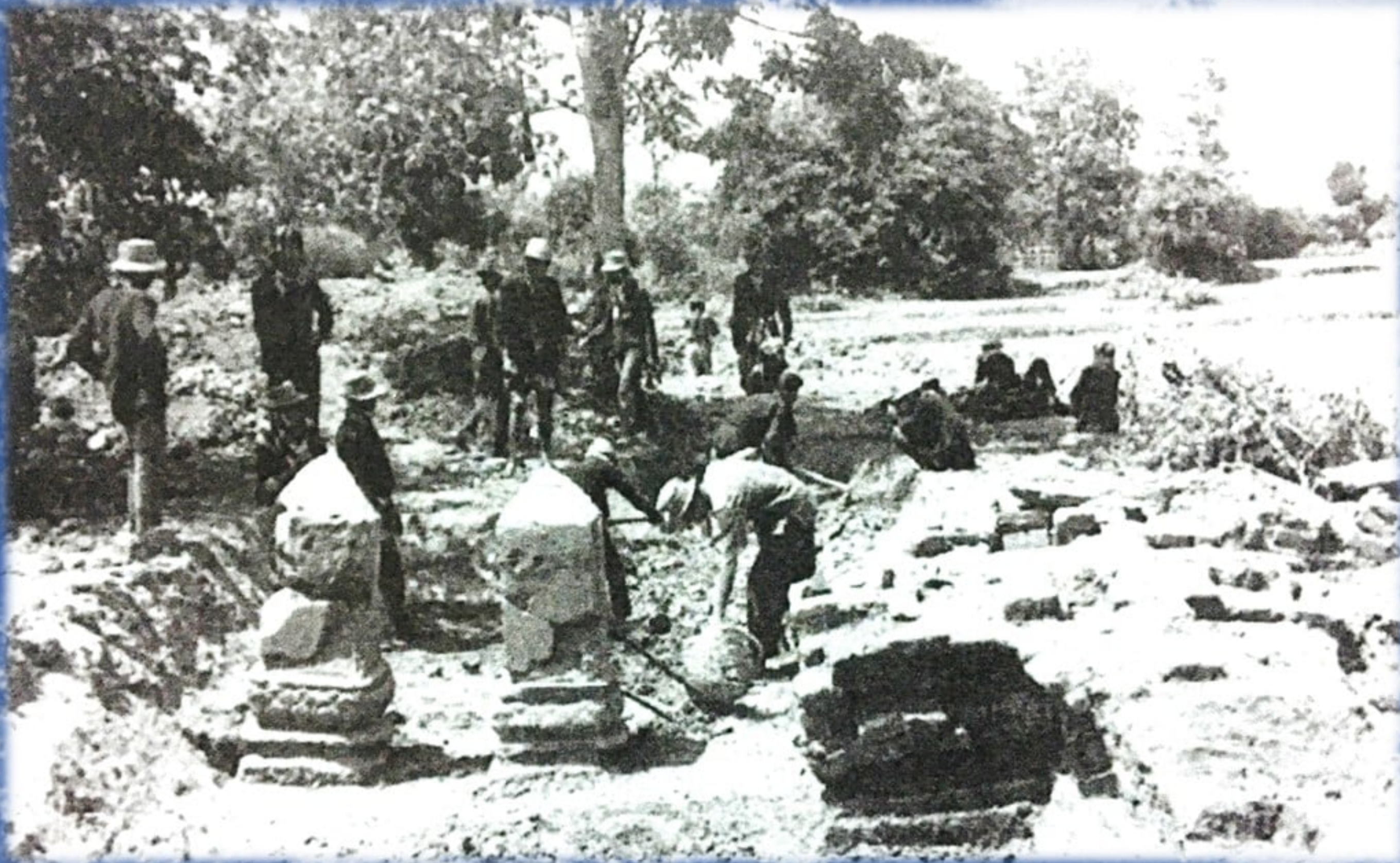
การขุดแต่งโบราณสถานหมายเลข ๓๐๒