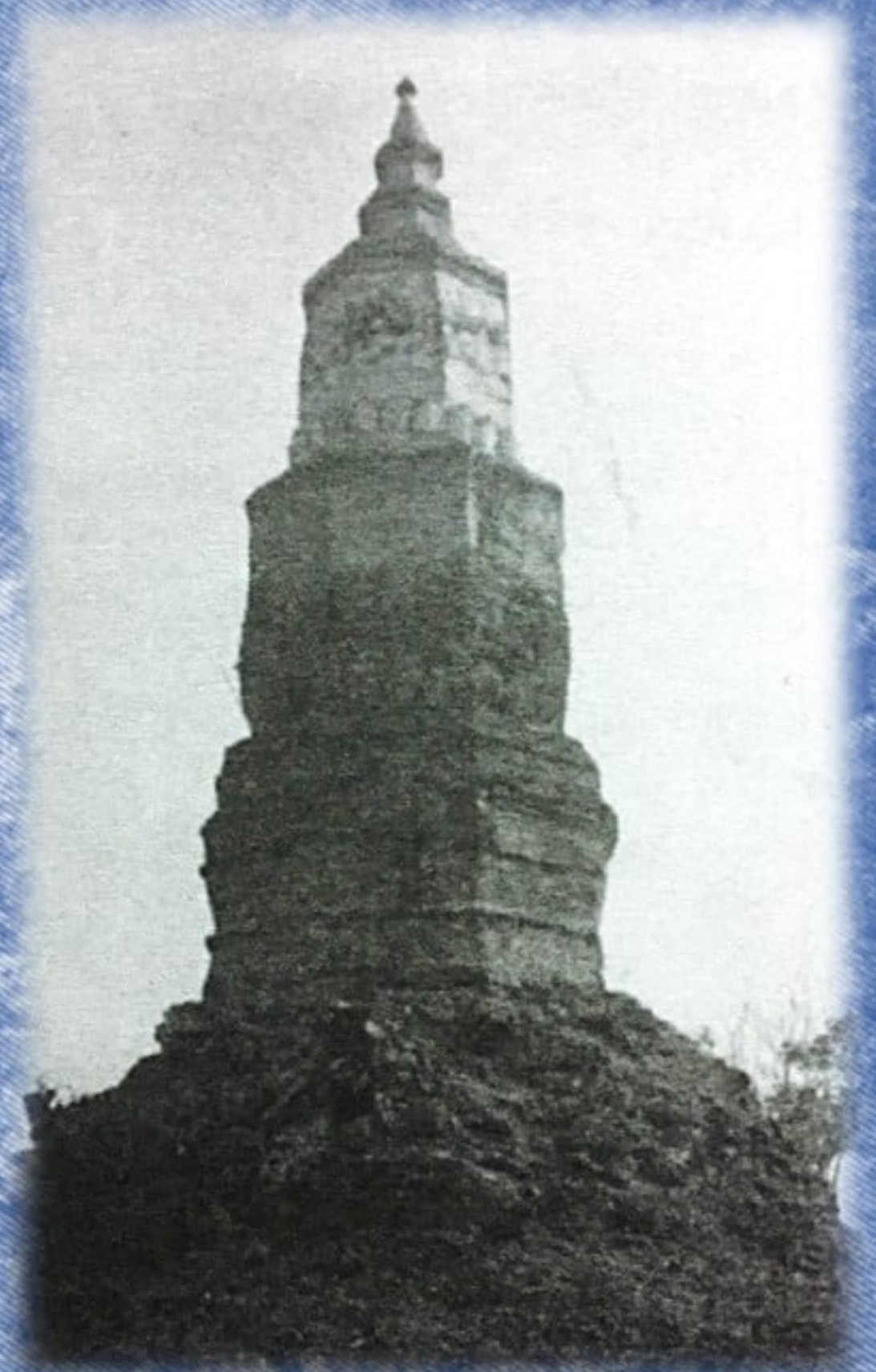
พระธาตุนาคูก่อนและหลังการขุดแต่ง พ.ศ. ๒๕๑๑