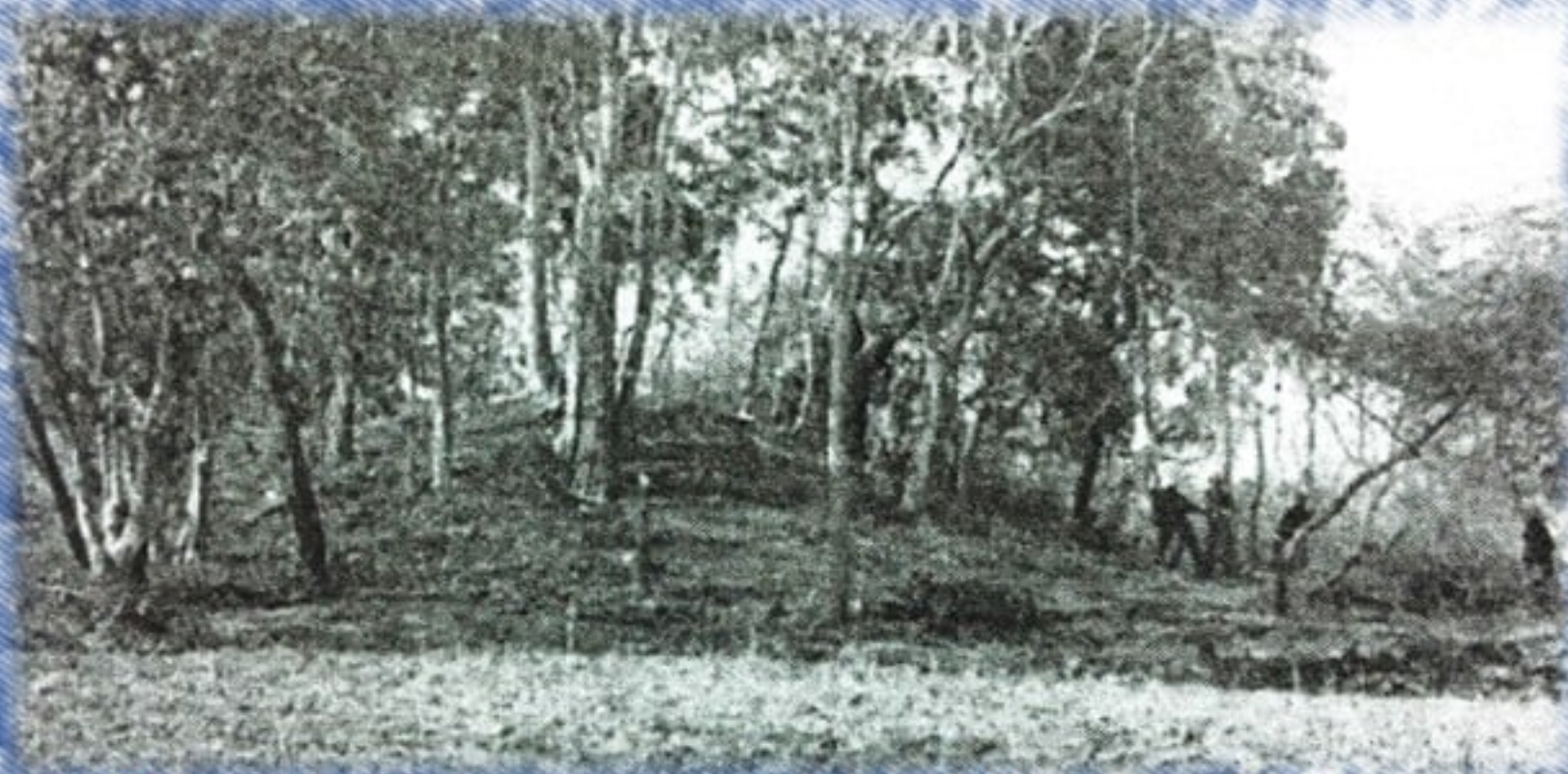
โบราณสถานหมายเลข ๙ ก่อนการขุดแต่ง