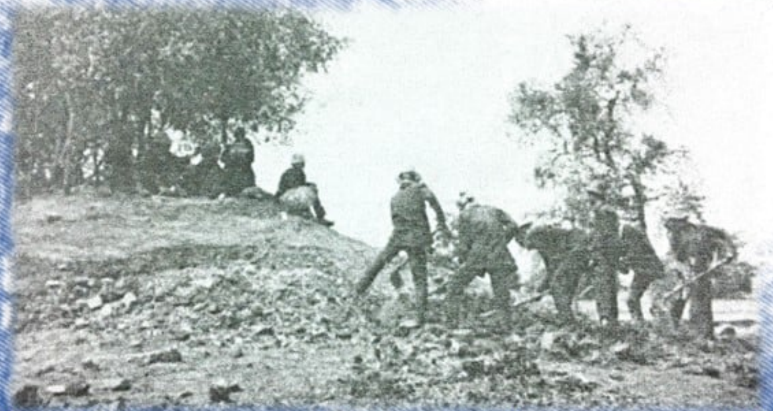
โบราณสถานหมายเลข ๘๐๑ ก่อนการขุดแต่ง