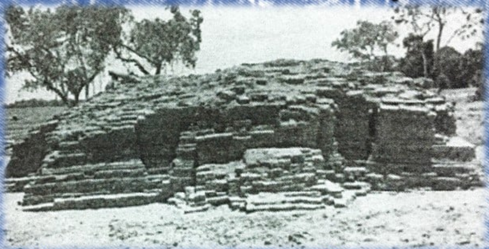
โบราณสถานหมายเลข ๙ หลังการขุดแต่ง