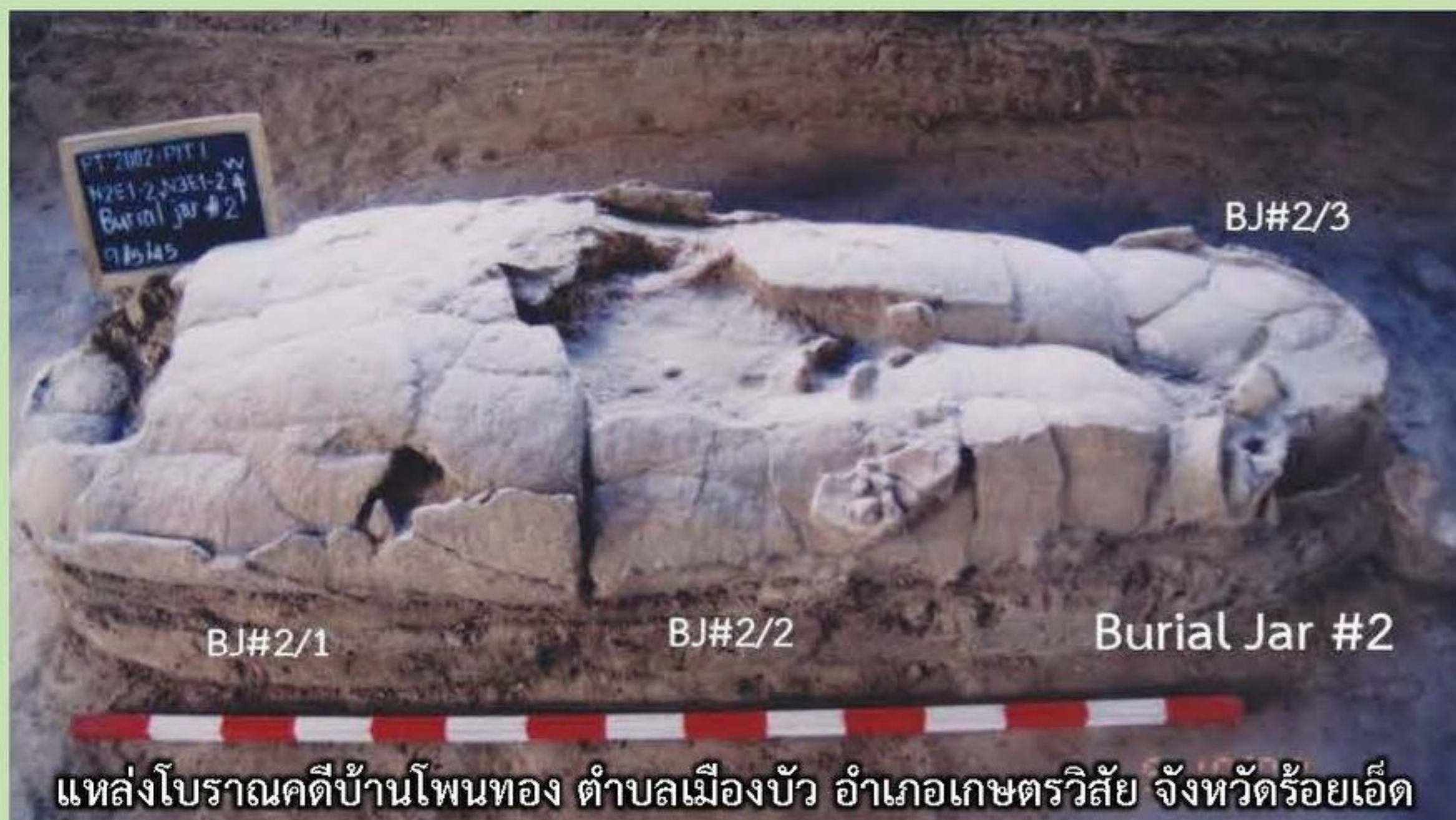
แหล่งโบราณคดีบ้านโพหนอง ตำบลเมืองบัว อำเภอเกษตรวิสัย จังหวัดร้อยเอ็ด