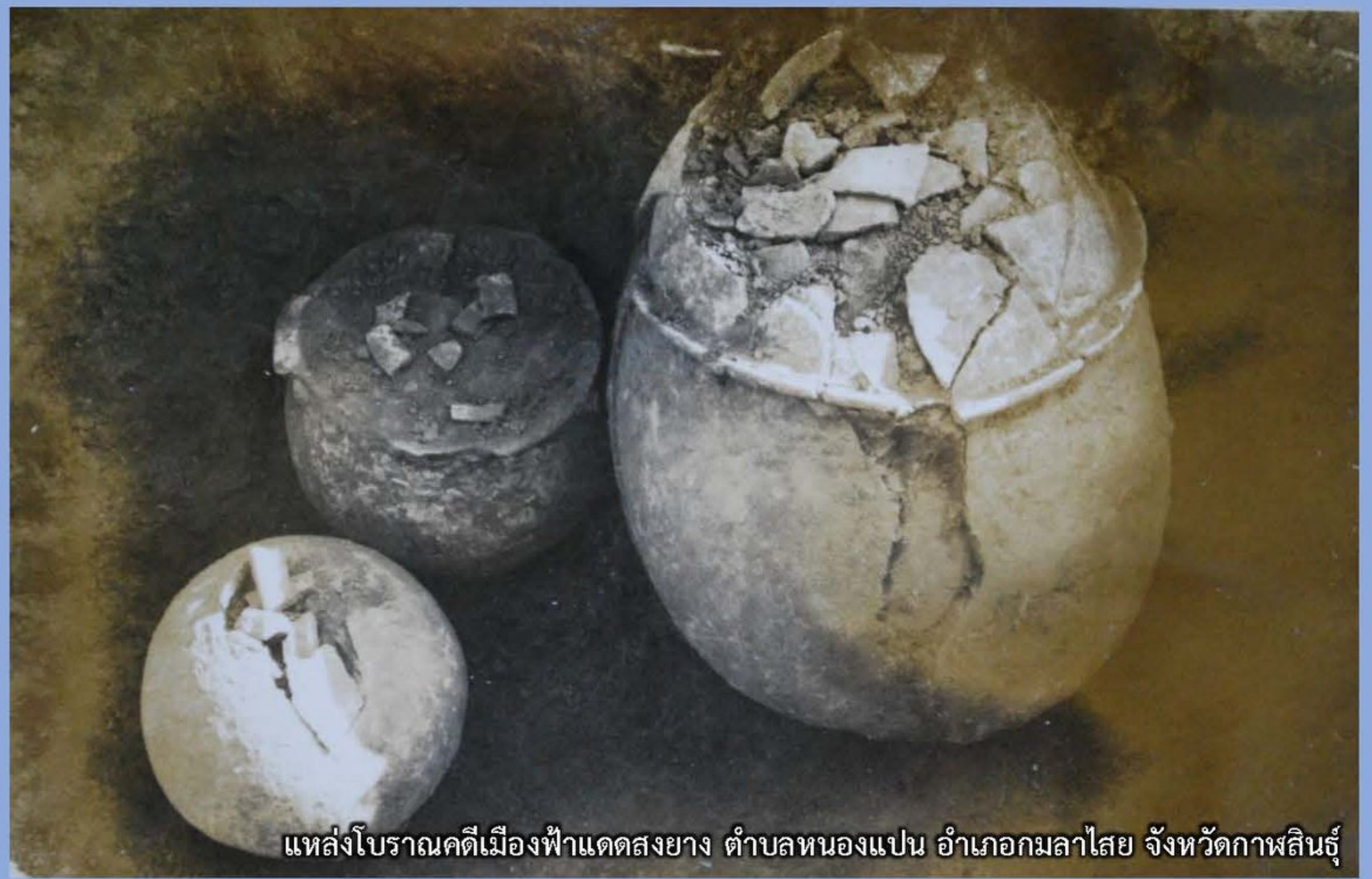
แหล่งโบราณคดีเมืองฟ้าแดดสงยาง ตำบลหนองแปน อำเภอกมลาไสย จังหวัดกาฬสินธุ์