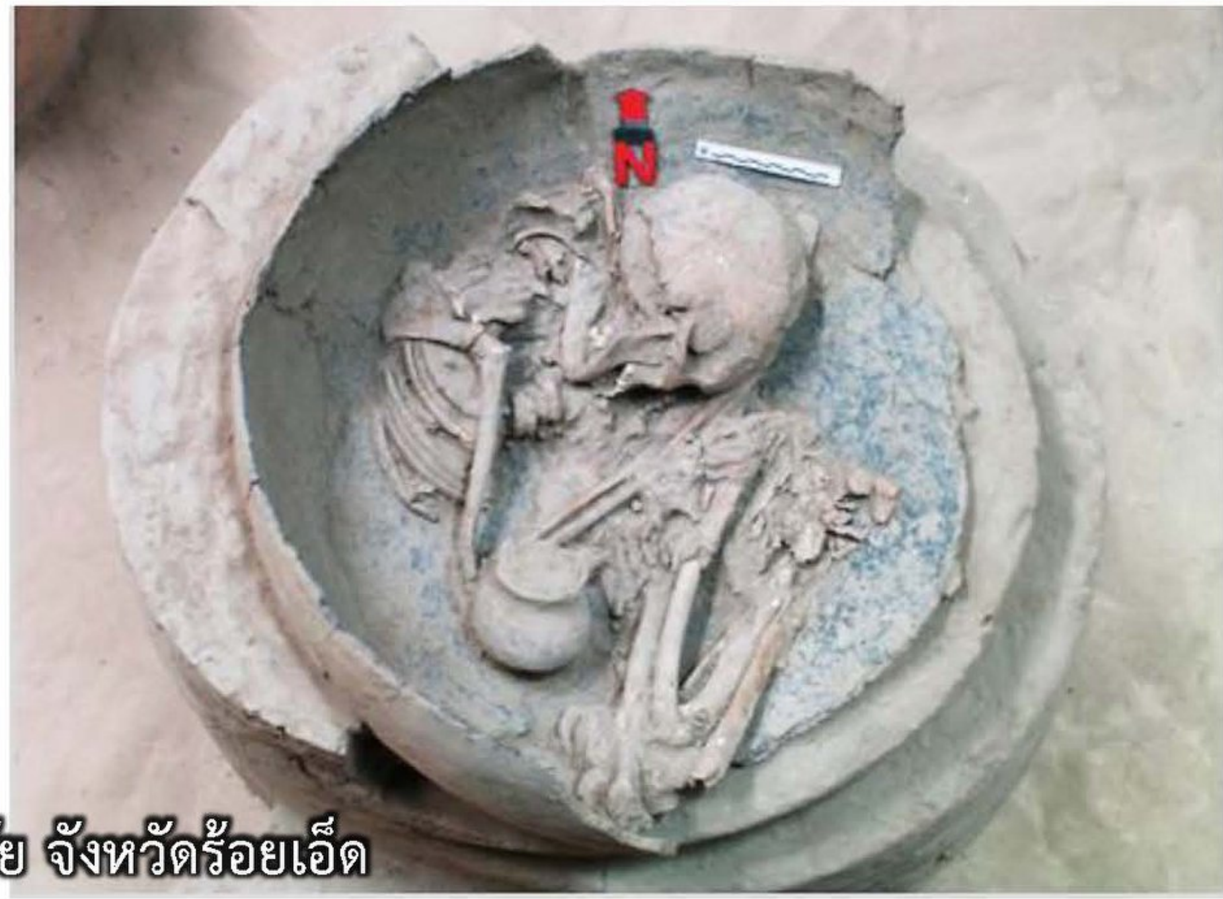
แหล่งโบราณคดีบ้านเมืองบัว ตำบลเมืองบัว อำเภอเกษตรวิสัย จังหวัดร้อยเอ็ด