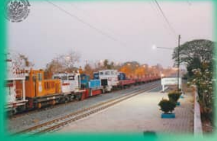
ที่มาภาพ : ภ.ศท.ท.๔/๒๒๑.๑ สถานีรถไฟสุพรรณบุรี ถ่ายเมื่อ ๒๐ เมษายน ๒๕๖๐

ปัจจุบันสถานีรถไฟสุพรรณบุรีเปิดให้บริการเดินรถ วันละ ๒ ขบวน คือ ขบวน ๓๕๖ สุพรรณบุรี - กรุงเทพฯ (หัวลำโพง) ออกจากสถานีสุพรรณบุรี เวลา ๐๕.๓๐ น. ถึงสถานีหัวลำโพง เวลา ๐๘.๐๕ น. และขบวน ๓๕๕ กรุงเทพฯ - สุพรรณบุรี รถไฟออกจากหัวลำโพงเวลา ๑๖.๕๐ น. ถึงสถานีสุพรรณบุรี เวลา ๒๐.๑๕ น.