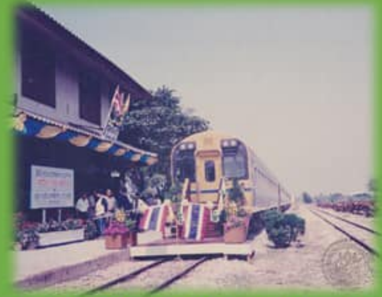
ที่มาภาพ : ๓(๒) สท.สบ.๒.๓๘ พิธีเปิดเดินรถราง ต่ำยเมื่อ ๕ มกราคม ๒๕๓๙

เมื่อวันที่ ๕ มกราคม พ.ศ. ๒๕๓๙ สถานีสุพรรณบุรีมีพิธีเปิดเดินขบวนรถดีเซลรางปรับอากาศ ให้บริการตลอดเส้นทาง สุพรรณบุรี - กรุงเทพ - สุพรรณบุรี โดย ฯพณฯ บุญเอื้อ ประเสริฐสุวรรณ ประธานรัฐสภา เป็นประธานในพิธีเปิด