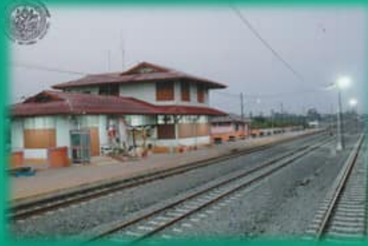
ที่มาภาพ : ภ.ศท.ท.๔/๒๒๑.๑ สถานีรถไฟสุพรรณบุรี ถ่ายเมื่อ ๒๐ เมษายน ๒๕๖๐