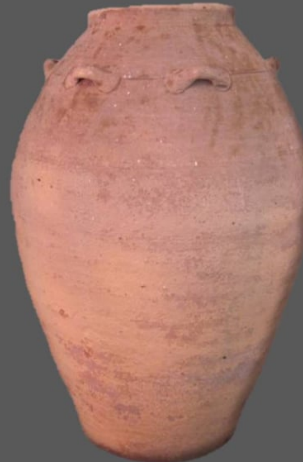
ไหทรงสูง ๖ หู สูง ๕๖ ซม. พบที่จังหวัดสงขลา จัดแสดง ในพิพิธภัณฑสถานแห่งชาติ สงขลา