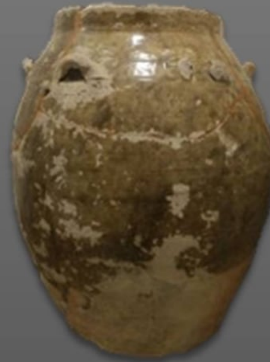
ไหเคลือบสีเขียว ๖ หู พบที่แหลมโพธิ์ อำเภอยะโฮง จังหวัดสุราษฎร์ธานี พิพิธภัณฑสถานแห่งชาติ ไซยา