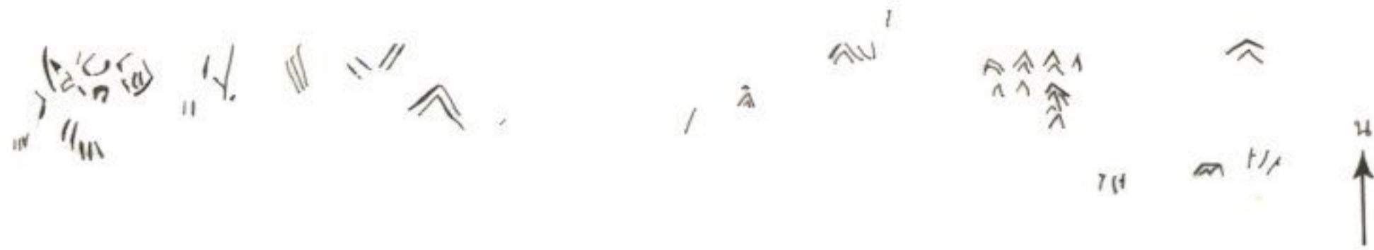
ภาพลายเส้นของภาพบนผนังหินที่เกิดจากเทคนิคการเซาะร่องที่หินช้างสี

รูปรอยบนผนังที่หินช้างสี น่าจะใช้วิธีการฝนเซาะร่องมากกว่าการจารหรือการสลัก เนื่องจากลายที่ปรากฏจะมองเห็นเส้นเป็นร่องลึกป่องกลางแต่ปลายเส้นแคบและต้นคล้ายเม็ดข้าวสาร ก่อนการสร้างพบว่าการเตรียมผิวหน้าผนังหินที่จะทำให้ลวดลายให้เรียบ ซึ่งอาจจะใช้เครื่องมือหินหรือโลหะฝนขัดผิวให้เสมอกันก่อน จากนั้นจึงใช้เทคนิคการเซาะผิวหินให้เป็นร่องลึกโดยใช้เครื่องมือปลายแหลมที่มีความแข็งมากกว่าหิน ซึ่งน่าจะเป็นเครื่องมือโลหะ ทำรูปรอยให้เป็นเส้นขีดเกิดขึ้น