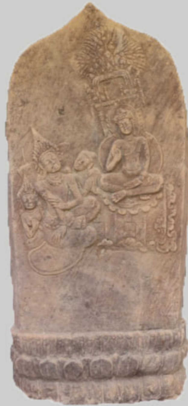
ใบเสมาสลักภาพ ตอนโปรดพระเจ้าพิมพิสาร

จัดแสดงที่ระเบียงด้านหลังของอาคารจัดแสดง พิพิธภัณฑสถานแห่งชาติ ขอนแก่น