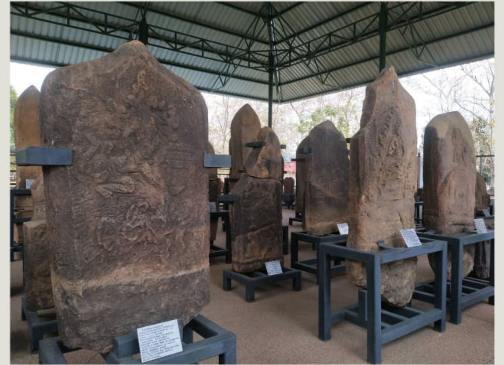
ใบเสมาภายในอาคารเก็บใบเสมา พิพิธภัณฑสถานแห่งชาติ ขอนแก่น

ใบเสมาพบอย่างแพร่หลายในภาคตะวันออกเฉียงเหนือของประเทศไทย ซึ่งส่วนใหญ่จะอยู่ในสมัยทวารวดี โดยได้จากการขุดค้นและสำรวจทางโบราณคดี และพบโดยประชาชน แบ่งเป็นกลุ่มใบเสมาที่พบในบริเวณลุ่มน้ำชี กลุ่มใบเสมาที่พบในบริเวณลุ่มน้ำมูล และกลุ่มใบเสมาที่พบในบริเวณลุ่มน้ำโขง ใบเสมาที่พบจะมีลักษณะรูปทรงแบบแท่งหินธรรมชาติ แบบแผ่นหินแบน และแบบแท่งหิน ใบเสมาเหล่านี้ได้เก็บรักษาและจัดแสดงในพิพิธภัณฑสถานแห่งชาติ เช่น พิพิธภัณฑสถานแห่งชาติ ร้อยเอ็ด พิพิธภัณฑสถานแห่งชาติ อุบลราชธานี และพิพิธภัณฑสถานแห่งชาติ ขอนแก่น เป็นต้น