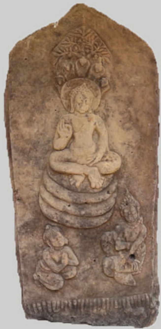
ใบเสมาสลักภาพ ตอนพบพญานาคมุจลินทร์

๑. รูปเคารพประธาน จากการขุดค้นทางโบราณคดีพบว่า บริเวณที่ขุดไม่มีการก่อสร้างอาคาร มีเพียงการผูกพัทธสีมา โดยการปักใบเสมา เพื่อแสดงให้เห็นว่าเป็นขอบเขตของพื้นที่ ศักดิ์สิทธิ์และทำพิธีกรรมทางศาสนา ใบเสมามีจำนวน ๒๒ หลักร แบ่งเป็นใบเสมา ๑๙ หลักร ที่ปักตามแนวทิศ และล้อมรอบพื้นที่ ขนาด ๖.๗๐ x ๘ เมตร แต่ละทิศปักเรียงแถวกัน ๓ หลักร ๒ หลักร และ ๑ หลักร