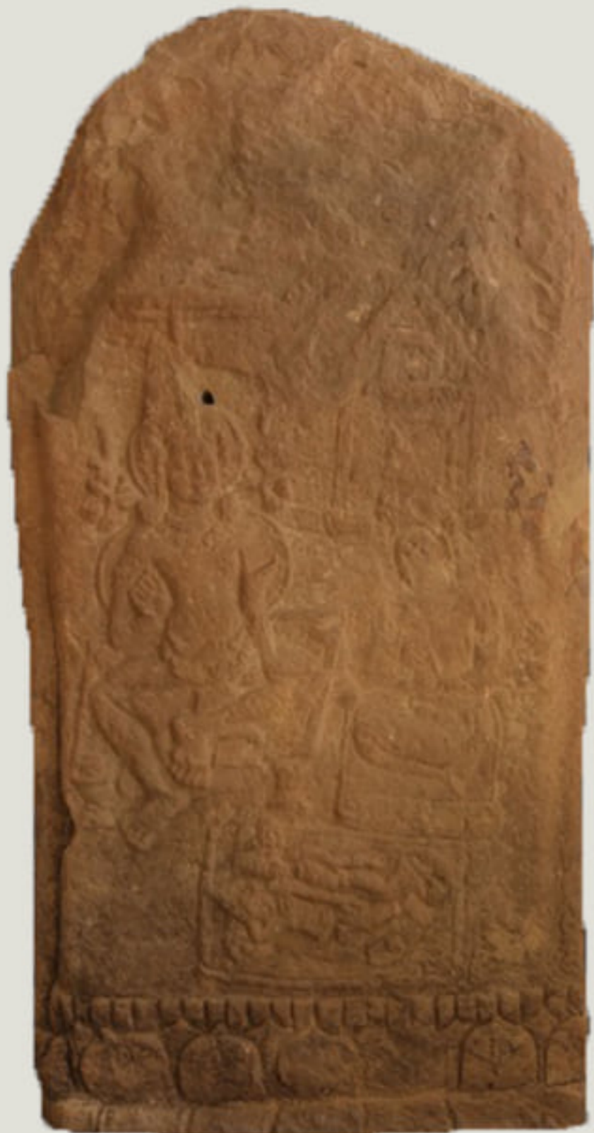
ใบเสมาสลักภาพเวสสันดรชาดก จัดแสดงในห้องทวารวดี พิพิธภัณฑสถานแห่งชาติ ขอนแก่น

สำหรับใบเสมาในพิพิธภัณฑสถานแห่งชาติ ขอนแก่น มีแหล่งที่มาจากจังหวัดต่าง ๆ เช่น จังหวัดเลย จังหวัดอุดรธานี จังหวัดสกลนคร จังหวัดกาฬสินธุ์ เป็นต้น ทั้งนี้ ส่วนใหญ่จะได้จากเมืองฟ้าแดดสูงยาง อำเภอกมลาไสย จังหวัดกาฬสินธุ์ มีทั้งใบเสมาที่ไม่สลักภาพ และสลักภาพเล่าเรื่อง ซึ่งมักจะเป็นภาพเล่าเรื่องเกี่ยวกับพุทธประวัติและชาดกของพระพุทธศาสนา เช่น พุทธประวัติตอนพิมพาพิลาป ตอนพระอินทร์ถวายผลสมอ ตอนโสตถียพราหมณ์ถวายหญ้าคา เวสสันดรชาดก กุลวกชาดก จันทกุมารชาดก เป็นต้น โดยมีภาพบุคคล สัตว์ อาคาร ต้นไม้ และสิ่งของเป็นองค์ประกอบเพื่อแสดงเหตุการณ์ตอนสำคัญของเรื่อง