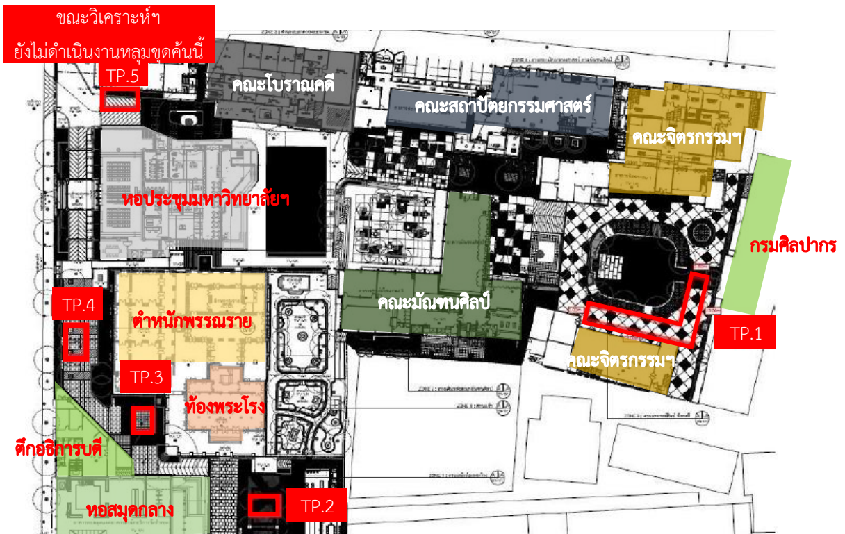
แผนผังที่ ๑ ตำแหน่งหลุมขุดค้นทางโบราณคดี หลุมขุดค้นที่ ๑-๕ (TP.1-5) ภายในมหาวิทยาลัยศิลปากร วังท่าพระ

จากการวิเคราะห์เครื่องถ้วยจีนที่พบจากการขุดค้นทางโบราณคดีบริเวณมหาวิทยาลัยศิลปากร วังท่าพระนี้ สรุปได้ว่า เครื่องถ้วยจีนมีอายุร่วมสมัยกับรัชกาลที่ ๑-๖ มีความเกี่ยวข้องกับการใช้งานสำหรับชนชั้นสูงภายในวังท่าพระ แต่ยังไม่พบเครื่องถ้วยจีนที่มีอายุในช่วงสมัยอยุธยาและสมัยธนบุรี อาจเพราะพื้นที่นี้ถูกใช้ในกิจกรรมการทำไร่สวนในสมัยอยุธยาที่ถูกกล่าวถึงในบันทึกชาวต่างชาติ พื้นที่นี้ไม่ได้มีความสำคัญมากเท่ากับบริเวณมิวเซียมสยามและรถไฟฟ้าใต้ดินสถานีสนามไชย ซึ่งเป็นที่ตั้งของป้อมบางกอกหรือป้อมมิไชยเอนทร์ และในสมัยธนบุรีมีระยะเวลาความเป็นราชธานีอันสั้น จึงยังไม่พบหลักฐานที่เกี่ยวข้อง อย่างไรก็ตามจากการขุดค้นยังพบภาชนะดินเผาเนื้อดินแกร่ง หากมีการศึกษาหลักฐานประเภทนี้หรือขุดค้นในพื้นที่อื่นเพิ่มเติม อาจพบหลักฐานที่มีอายุร่วมสมัยอยุธยาและสมัยธนบุรีและได้ข้อมูลมากขึ้น เพราะการขุดค้นทางโบราณคดี การ “ไม่พบ” ใช่ว่าจะ “ไม่มี”