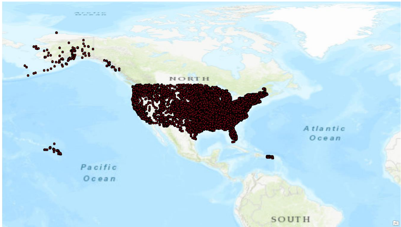
แผนที่แสดงตำแหน่งสถานที่ทางประวัติศาสตร์ของชาติ หรือ National Register of Historic Places

จำนวนทั้งหมดเกือบ 2,600 แห่ง ซึ่งจะเป็นแหล่งที่มีความสำคัญระดับชาติ ไม่ใช่แค่ระดับรัฐ หรือระดับท้องถิ่น และมีความครบถ้วนสมบูรณ์ในระดับสูง 4