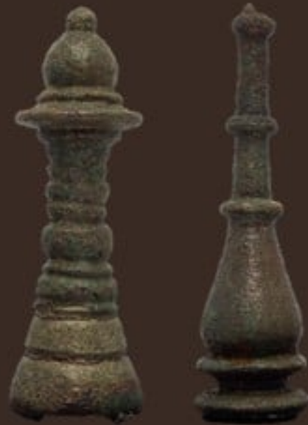
ยอดเจดีย์จำลองสำริด จัดแสดง ณ ห้องอุทองศรีทวารวดี