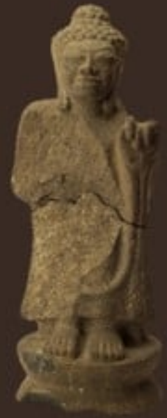
พระพุทธรูปศิลาปางแสดงธรรม จัดแสดง ณ ห้องบรรพชนคนอุทอง