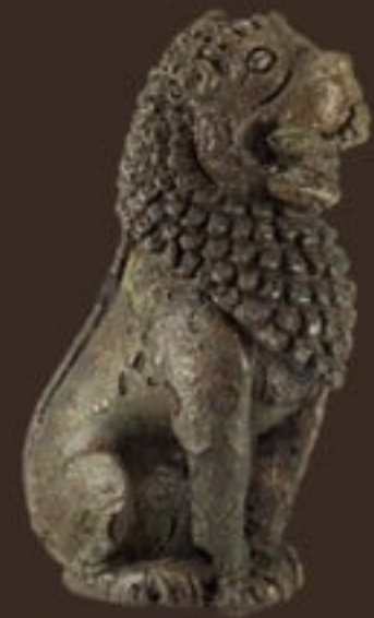
ประติมากรรมสำริดรูปสิงห์ จัดแสดง ณ ห้องบรรพชนคนอุทอง