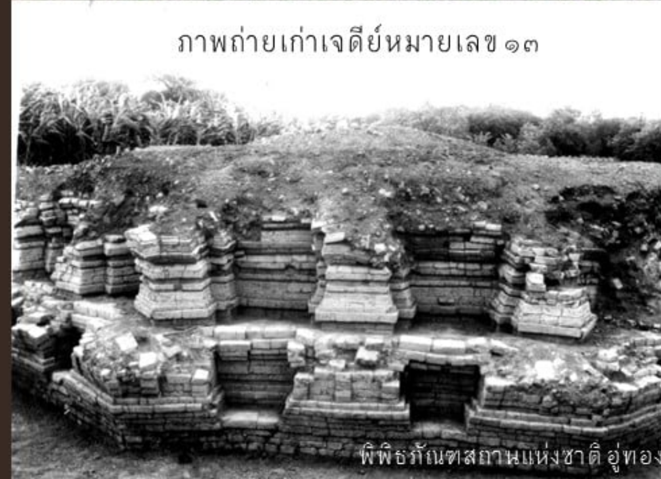
ภาพถ่ายเก่าเจดีย์หมายเลข ๑๓