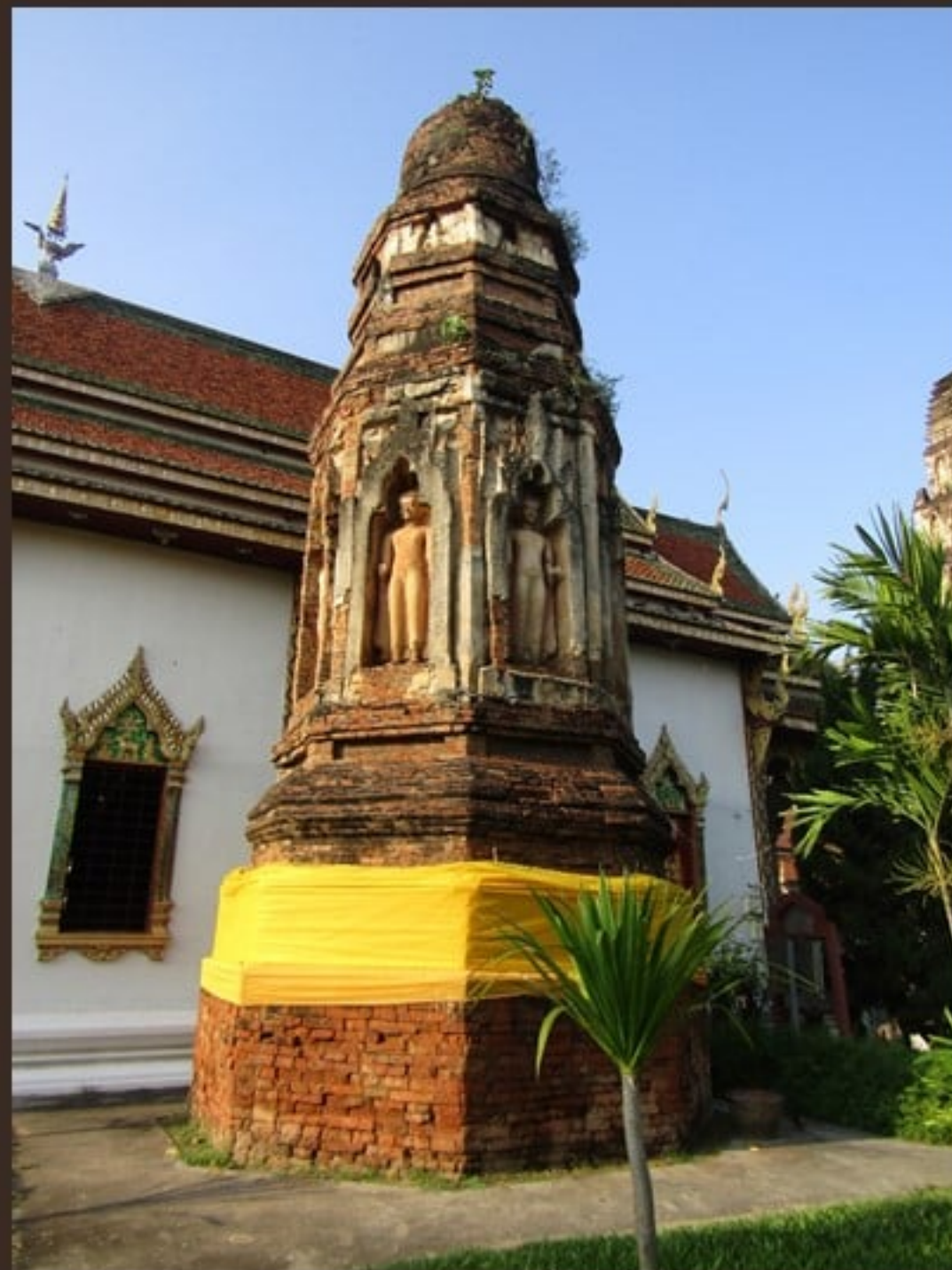
รัตนเจดีย์ วัดจามเทวี จังหวัดลำพูน