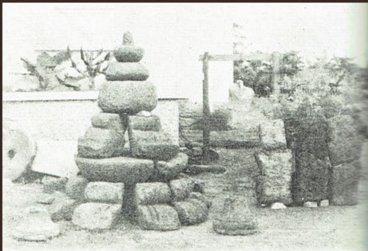
ส่วนยอดเจดีย์และสิ่งศิลาแลงพบจากการขุดแต่ง