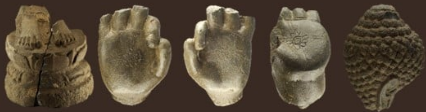
ชิ้นส่วนพระพุทธรูปศิลาพบจากการขุดแต่ง