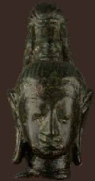
เศียรพระโพธิสัตว์อวโลกิเตศวร จัดแสดง ณ ห้องบรรพชนคนอุทอง