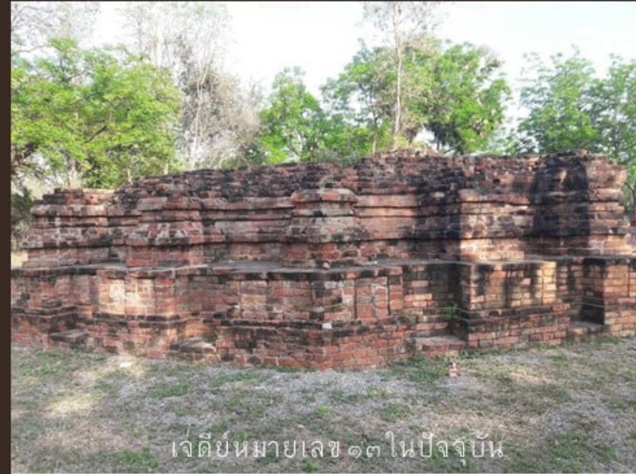
เจดีย์หมายเลข ๑๓ ในปัจจุบัน

เจดีย์หมายเลข ๑๓ ตั้งอยู่ห่างจากเมืองโบราณอุทองไปทางทิศตะวันตกประมาณ ๖๐๐ เมตร ขุดแต่งในปี พ.ศ. ๒๕๐๖ ก่อนขุดแต่งมีสภาพเป็นเนินดิน ในปัจจุบันเหลือเพียงส่วนฐานในผังแปดเหลี่ยมสูงประมาณ ๓.๕ เมตร ฐานชั้นล่างเป็นฐานแปดเหลี่ยม กว้างด้านละ ๕ เมตร สูงประมาณ ๑ เมตร ยกเก็จที่มุมและด้าน แต่ละเก็จมีช่องสี่เหลี่ยมเล็กด้านละ ๒ ช่อง ชั้นบนถัดขึ้นมาอยู่ในผังแปดเหลี่ยม ยกเก็จที่มุมและด้านลือกับฐานชั้นล่าง