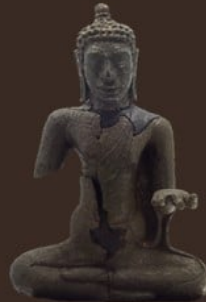
พระพุทธรูปสำริดปางแสดงธรรม จัดแสดง ณ ห้องอุทองศรีทวารวดี