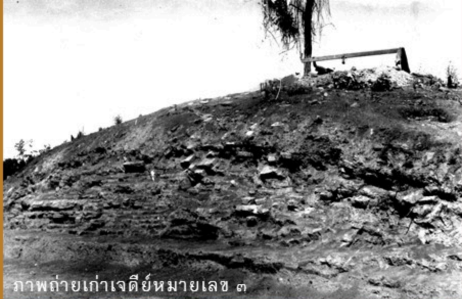
ภาพถ่ายเก่าเจดีย์หมายเลข ๓