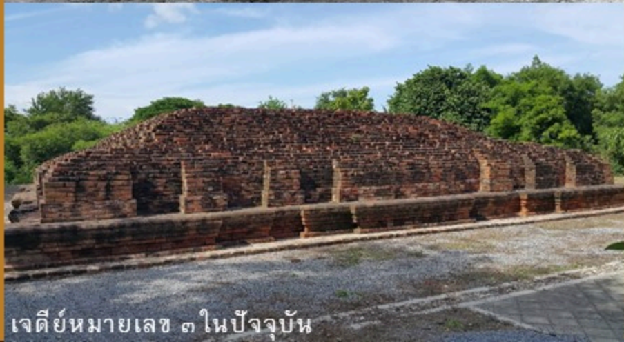
เจดีย์หมายเลข ๓ ในปัจจุบัน