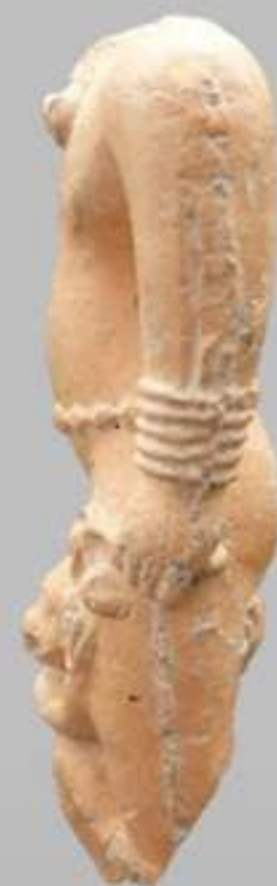
ด้านข้าง

ตุ๊กตาลักษณะนี้ทำขึ้นโดยใช้แม่พิมพ์ประกบสองชิ้น สืบเกตุจากรอยตะเข็บทางด้านข้างของลำตัว จัดเป็นลักษณะเฉพาะของวัฒนธรรมทวารวดีในภาคกลางของประเทศไทย อายุประมาณพุทธศตวรรษที่ ๑๓ - ๑๕ หรือประมาณ ๑,๑๐๐ - ๑,๓๐๐ ปีมาแล้ว โดยพบทั้งที่เมืองโบราณอู่ทอง จังหวัดสุพรรณบุรี เมืองโบราณจันเสน อำเภอดาคลี จังหวัดนครสวรรค์ และเมืองโบราณบ้านคูเมือง อำเภออินทร์บุรี จังหวัดสิงห์บุรี