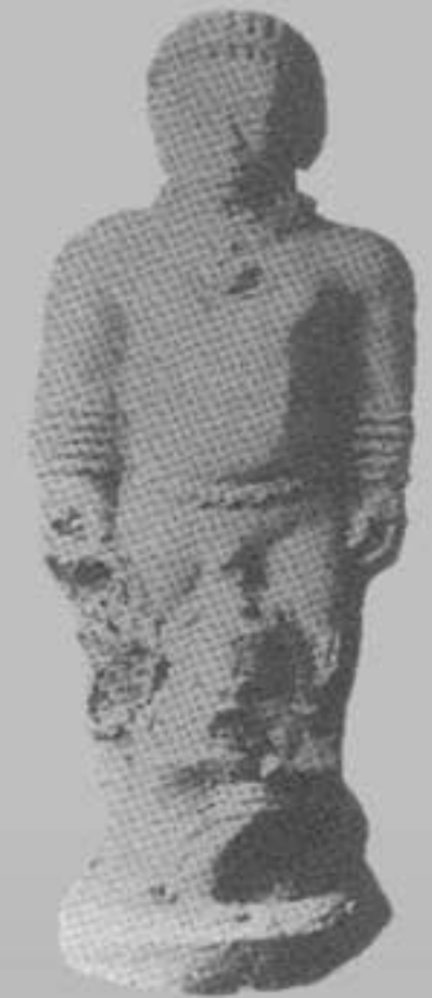
ตุ๊กตาดินเผา รูปคนจูงลิง ได้จากเมืองโบราณจันเสน อำเภอตากลี จังหวัดนครสวรรค์