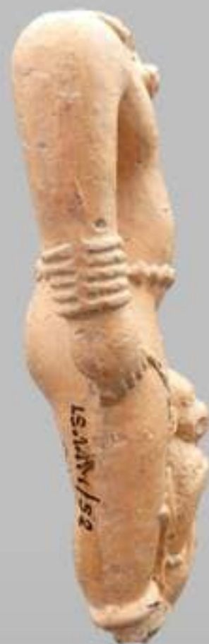
ด้านข้าง