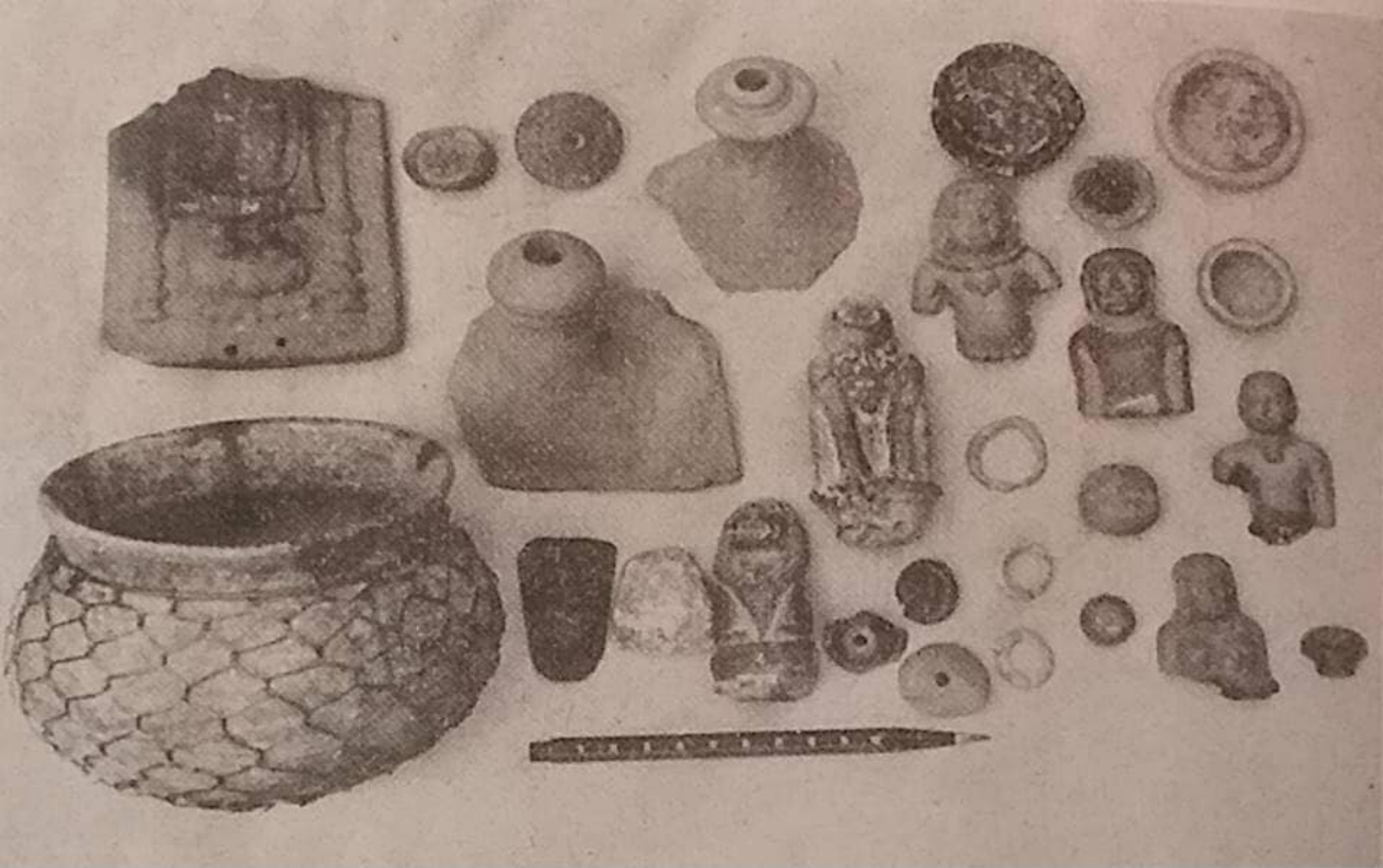
โบราณวัตถุที่ได้จากการสำรวจภายในเมืองโบราณจันเสน จังหวัดนครสวรรค์ เมื่อ พ.ศ. ๒๕๑๐ ได้แก่ ภาชนะดินเผา พระพิมพ์ เครื่องมือเครื่องใช้ เครื่องประดับ รวมทั้งประติมากรรมดินเผาขนาดเล็ก มีรูปแบบคล้ายกับที่พบจากเมืองโบราณอุ้มทอง จังหวัดสุพรรณบุรี สะท้อนการเป็นชุมชนที่มีอายุร่วมสมัยกันและเจริญขึ้นภายใต้วัฒนธรรมเดียวกัน