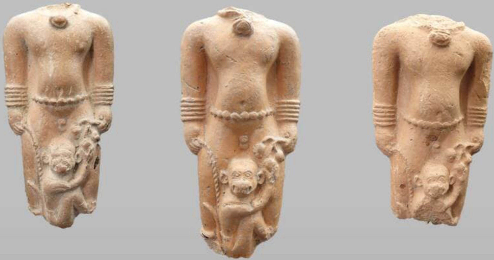
ประติมากรรมดินเผารูปคนจูงลิง พบที่เมืองโบราณอู่ทอง จังหวัดสุพรรณบุรี ศิลปะทวารวดี อายุราวพุทธศตวรรษที่ ๑๒ - ๑๔ (ประมาณ ๑,๒๐๐ - ๑,๔๐๐ ปีมาแล้ว) จัดแสดง ณ ห้องอู่ทองศรีทวารวดี พิพิธภัณฑสถานแห่งชาติ อู่ทอง

ประติมากรรมขนาดเล็กทำจากดินเผา แสดงรูปเด็กผู้ชายยืนเปลือย สวมเครื่องประดับเป็นสายสร้อย ที่อาจหมายถึงเครื่องราง และกำไลข้อมือ ที่สะโพกคาดด้วยเชือกหรือแถบผ้า มือขวาถือเชือกกำลังล่ามหรือ จูงลิงที่นั่งยอง เกาะขาอยู่ด้านหน้า มือซ้ายถือกิ่งผลไม้