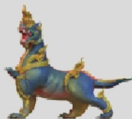
ไกรสรนาคา