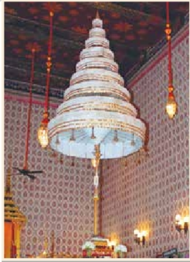
นพปฎลมหาเศวตฉัตร ภายในพระที่นั่งดุสิตมหาปราสาท

ฉัตรสำหรับตั้งในพิธี หรืออัญเชิญเข้ากระบวนแห่เป็นเกียรติยศ แบ่งเป็น ๖ ชนิด คือ พระมหาศวตฉัตรกรรณิรมย์ (พระเสนธิปัตย์ พระฉัตรชัย พระเกาวพ่าห์) พระอภิรมชুমสาย (พระอภิรมชুমสายปักหักทองขวาง พระอภิรมชুমสายทองแผ่ลาด) ฉัตรเครื่องสูงวงหน้า ฉัตรเครื่องสูง ฉัตรเบญจา ฉัตรราชวัติ