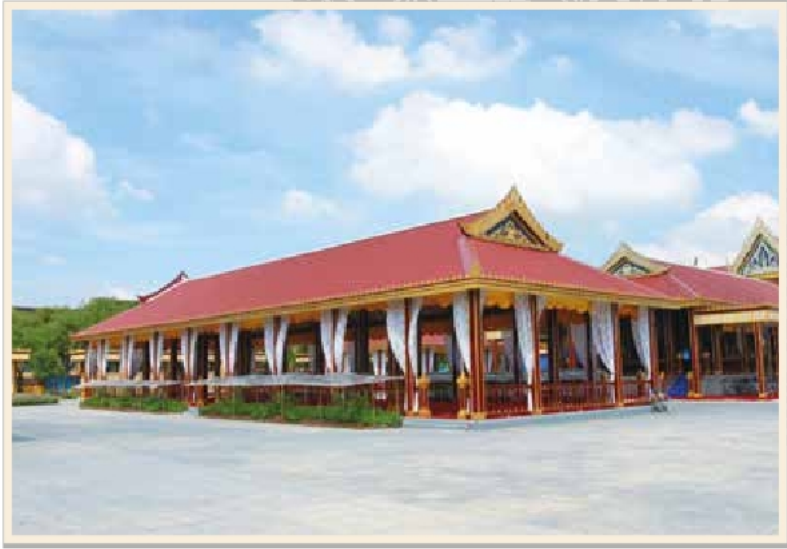
ศาลาลูกขุนในงานพระเมรุ สมเด็จพระเจ้าภคินีเธอ เจ้าฟ้าเพชรรัตนราชสุดา สิริโสภาพัณณวดี