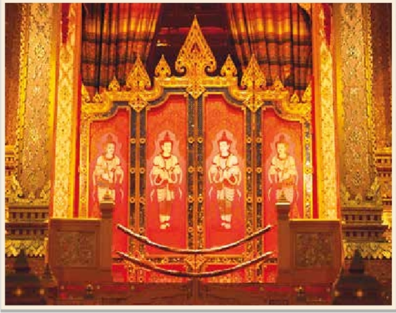
ฉากบังเพลิงในงานพระเมรุ สมเด็จพระเจ้าภคินีเธอ เจ้าฟ้าเพชรรัตนราชสุดา สิริโสภาพัณณวดี