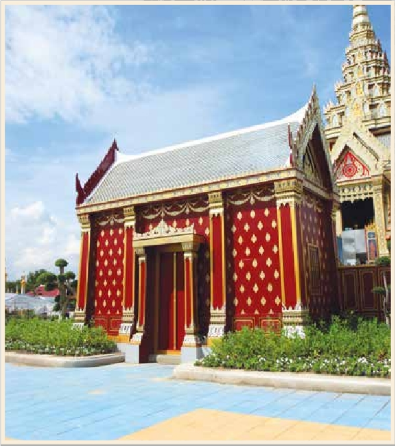
หอเปลื้องในงานพระเมรุ สมเด็จพระเจ้าพี่นางเธอ เจ้าฟ้ากัลยาณิวัฒนา กรมหลวงนราธิวาสราชนครินทร์