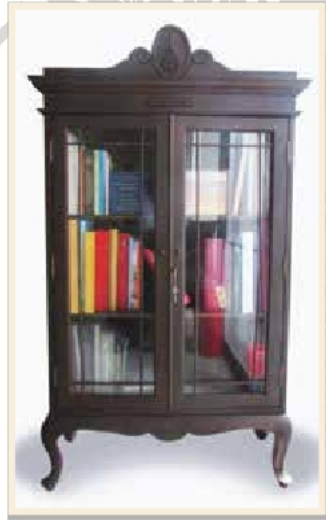
ตู้สังเค็ดในงานพระเมรุสมเด็จพระเจ้าภคินีเธอ เจ้าฟ้าเพชรรัตนราชสุดา สิริโสภาพัณณวดี

สังเค็ด มาจากคำว่า สังคีต แปลว่า การสวด ดังนั้นที่ซึ่งพระสงฆ์ขึ้นไปนั่งสวดได้ ๔ รูป จึงเรียกว่า เตียงสังคีตอันเดียวกับเตียงสวด หรือร้านสวดในการศพ เว้นแต่ทำให้ประณีตขึ้น มียอดดุงปราสาทก็มี ไม่มียอดก็มี ทั้งนี้เครื่องสังเค็ดอันหมายถึงสิ่งของที่ใช้ในการทำบุญศพที่มีมาจากแต่เดิมนิยมนำสังเค็ดอันเป็นเตียงสวดของพระสงฆ์นั้นมาใส่ของหามเข้ากระบวนแห่ศพ ต่อมาภายหลังของเหล่านี้ไม่ได้จัดใส่ในสังเค็ดแล้วแต่ผู้คนยังเรียกของทำบุญในการศพว่า เครื่องสังเค็ดอยู่