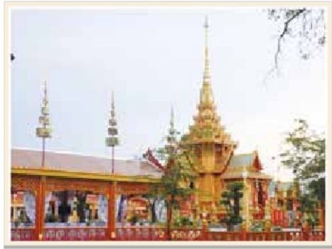
ราชวัติในงานพระเมรุสมเด็จพระเจ้าภคินีเธอเจ้าฟ้าเพชรรัตนราชสุดา สิริโสภาพัณณวดี

เป็นแนวรั้วกำหนดขอบเขตปริมณฑลของพระเมรุมาศและพระเมรุทั้ง ๔ ด้าน สร้างต่อเนื่องไปกับทิมและทับเกษตร ตกแต่งด้วยฉัตรและธง บางที่เรียกรวมกันว่า ราชวัติฉัตรธง