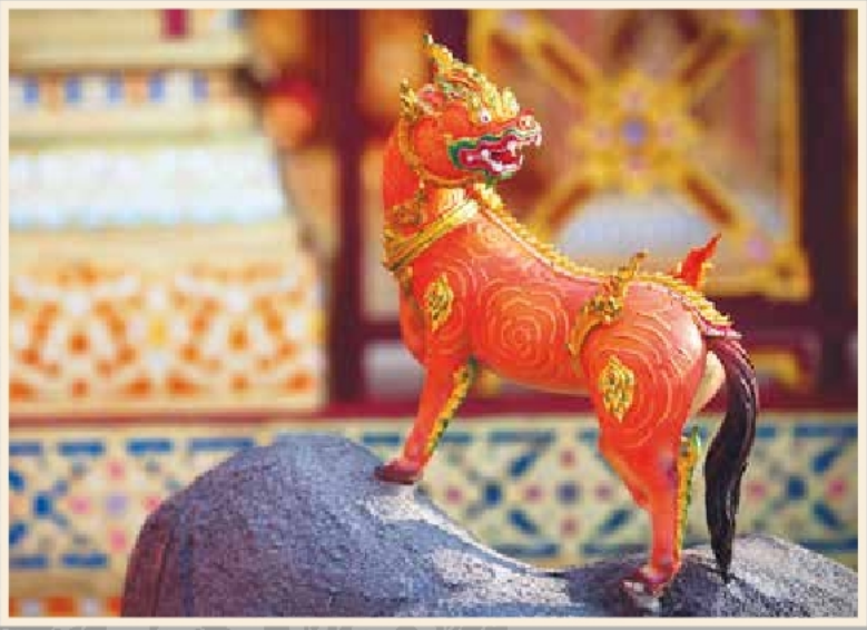
ดุรงคไกรสร เป็นหนึ่งในสัตว์หิมพานต์ประดับพระเมรุ สมเด็จพระเจ้าภคินีเธอ เจ้าฟ้าเพชรรัตนราชสุดา สิริโสภาพัณณวดี

เป็นรูปสัตว์ที่ประดับตกแต่งรายรอบพระเมรุมาศ ตามคติเรื่องโลกและจักรวาล ซึ่งมีเขาพระสุเมรุเป็นศูนย์กลาง ล้อมรอบด้วยเขาสัตตบริภัณฑ์ และดาชด้นด้วยสิงสาราสัตว์นานาพันธุ์ สมัยก่อนจึงจัดทำรูปสัตว์รายรอบพระเมรุมาศและพระเมรุ รวมทั้งมีการผูกหุ่นรูปสัตว์เข้าขบวนแห่พระบรมศพหรือพระศพไปสู่พระเมรุมาศหรือพระเมรุด้วย