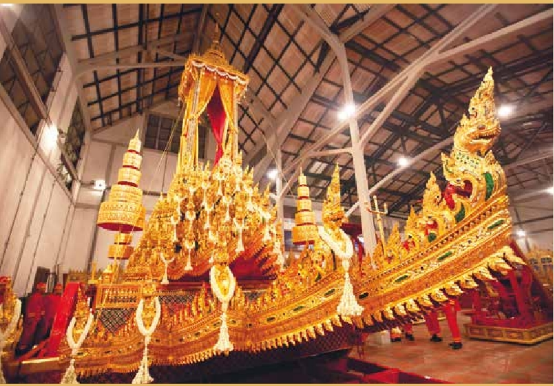
พระมหาพิชัยราชรถ เก็บรักษาอยู่ในโรงราชรถ พิพิธภัณฑสถานแห่งชาติ พระนคร