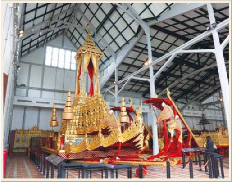
พระมหาพิชัยราชรถ เก็บรักษาอยู่ในโรงราชรถ พิพิธภัณฑสถานแห่งชาติ พระนคร