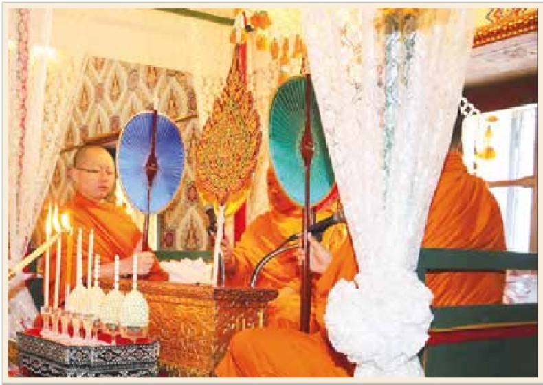
พระพิธีธรรมสวดพระอภิธรรมในการพระราชพิธีบำเพ็ญพระราชกุศล พระบรมศพ พระบาทสมเด็จพระปรมินทรมหาภูมิพลอดุลยเดช

ทำนองสรภัญญะ เน้นคำสวดชัดเจนและเอื้อนทำนองเสียงสูงต่ำ