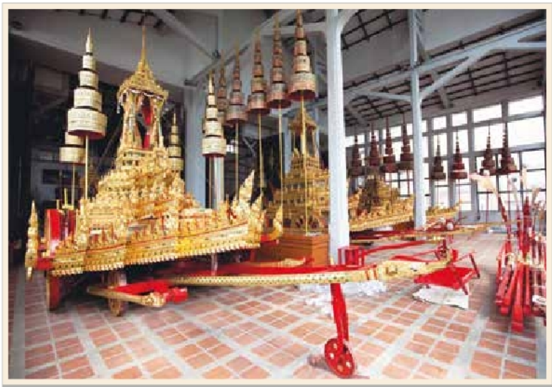
ราชรถน้อย เก็บรักษาอยู่ในโรงราชรถ พิพิธภัณฑสถานแห่งชาติ พระนคร

เป็นราชรถไม้ มีลักษณะคล้ายพระมหาพิชัยราชรถ และเวชยันตราซรถ คือมีส่วนตัวรถที่แกะสลักลงรักปิดทองประดับกระจก คานที่ยื่นออกมาเป็นรูปนาคราช บนราชรถมีบุษบกตั้งอยู่เช่นเดียวกัน เพียงแต่มีขนาดเล็กกว่า ราชรถน้อยองค์หนึ่งใช้เป็นราชรถที่สมเด็จพระสังฆราชประทับ ทรงสวดนำกระบวนพระมหาพิชัยราชรถ ราชรถองค์ที่สอง เป็นราชรถโยงพระภุชจาจากพระบรมโกศ จากนั้นเป็นราชรถน้อยองค์ที่สาม ใช้เป็นราชรถสำหรับพระบรมวงศานุวงศ์ผู้ใหญ่ประทับ เพื่อทรงโปรยทานพระราชทานแก่ประชาชนที่มาเฝ้ากราบพระบรมศพตามทางสู่พระเมรุมาศ