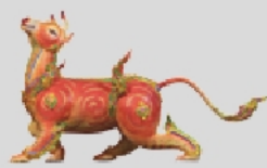
ไกรสรคาวี