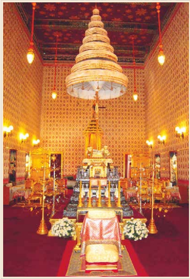
นพปฎลมหาเศวตฉัตร ประดิษฐานเหนือพระแท่นราชบัลลังก์ประดับมุก ภายในพระที่นั่งดุสิตมหาปราสาท