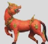
ตุรงค์ไกรสร