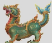
ไกรสรวาริน