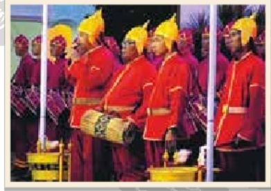
การประโคมย่ำยามในการพระราชพิธีบำเพ็ญพระราชกุศล พระบาทสมเด็จพระปรมินทรมหาภูมิพลอดุลยเดช