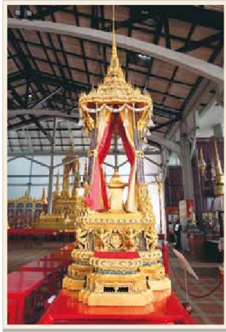
พระที่นั่งราชนทรยาน เก็บรักษาอยู่ในโรงราชรถ พิพิธภัณฑสถานแห่งชาติ พระนคร