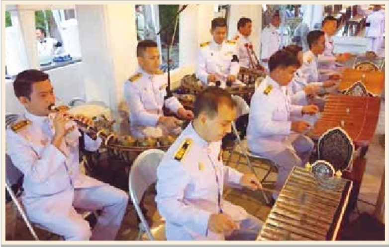
การบรรเลงของวงปี่พาทย์นางหงส์ในการพระราชพิธีบำเพ็ญพระราชกุศล พระบรมศพ พระบาทสมเด็จพระปรมินทรมหาภูมิพลอดุลยเดช