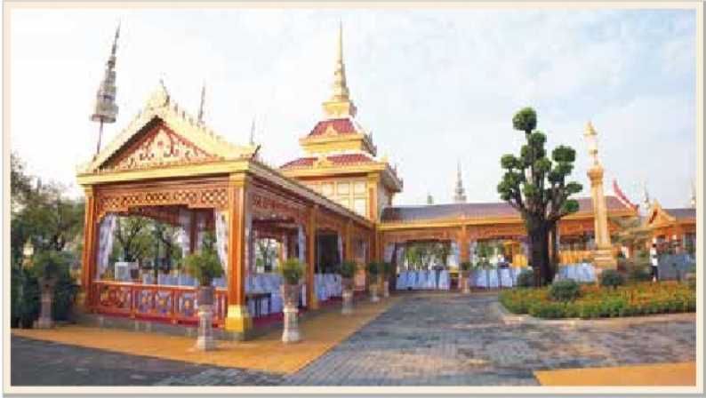
ทับเกษตรในงานพระเมรุ สมเด็จพระเจ้าภคินีเธอ เจ้าฟ้าเพชรรัตนราชสุดา สิริโสภาพัณณวดี