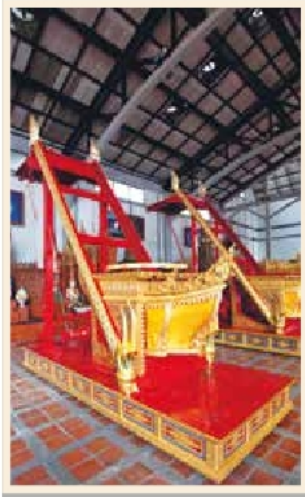
เกรินบันไดนาค เก็บรักษายู่ในโรงราชรถ พิพิธภัณฑสถานแห่งชาติ พระนคร