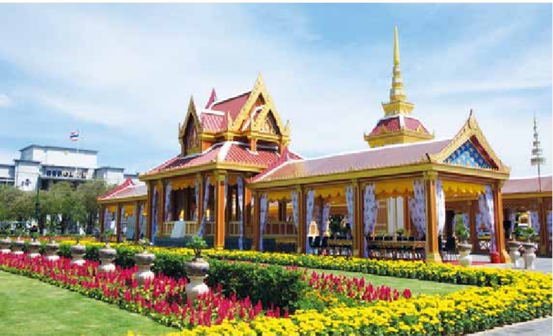
ปลับพลายกห้องสนามหลวงในงานพระเมรุ สมเด็จพระเจ้าภคินีเธอ เจ้าฟ้าเพชรรัตนราชสุดา สิริโสภาพัณณวดี

เป็นโถงใช้สำหรับพระมหากษัตริย์ และพระบรมวงศานุวงศ์ ทรงรอ รับส่งพระบรมศพ พระศพ ขึ้นราชรถ ในอดีตมีการสร้างปลับพลายก หน้าวัด พระเชตุพนวิมลมังคลาราม ตั้งอยู่มุมกำแพงวัด เยื้องกรมการรักษาดินแดน ปลับพลายกหน้าพระที่นั่งสุทไธสวรรยปราสาท และปลับพลายกห้องสนามหลวง ด้านหน้าทางเข้าปริมณฑลห้องสนามหลวง