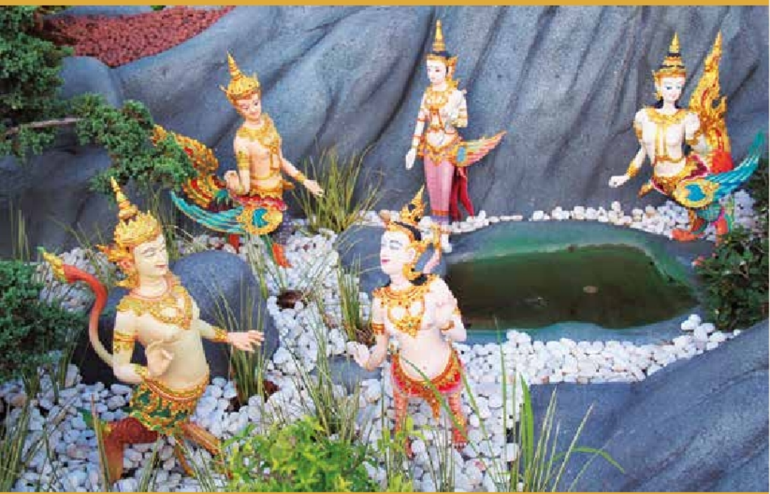
กัณนร กัณรี ประดับพระเมรุ สมเด็จพระเจ้าภคินีเธอ เจ้าฟ้าเพชรรัตนราชสุดา สิริโสภาพัณณวดี