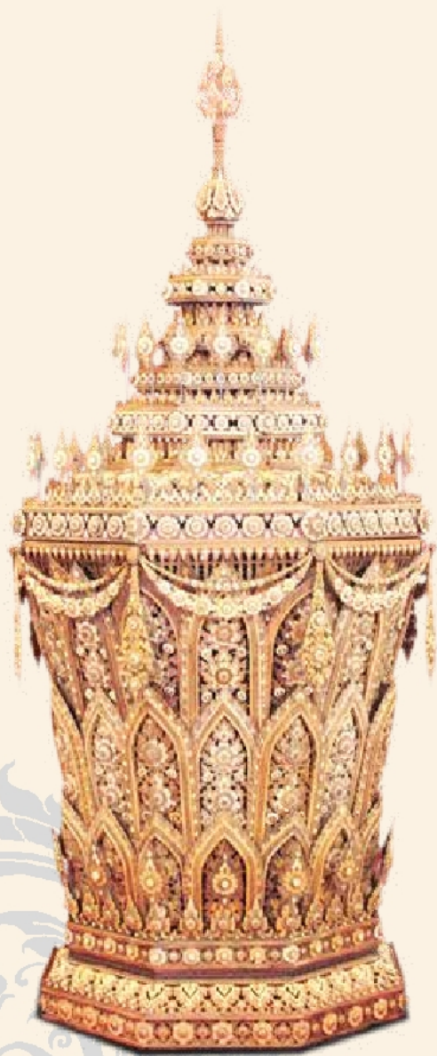
พระโกศจันทน์ในงานพระเมรุ สมเด็จพระเจ้าภคินีเธอ เจ้าฟ้าเพชรรัตนราชสุดา สิริโสภาพัณณวดี