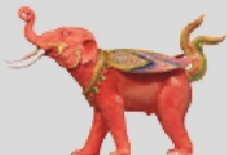
กรินทร์ปักษา