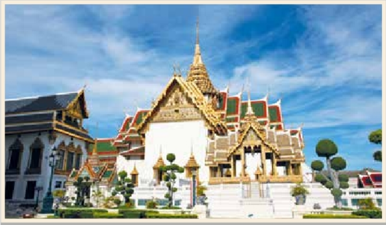
พระที่นั่งดุสิตมหาปราสาท แลเห็นพระที่นั่งอาภรณ์ภิโมกษ์ปราสาทอยู่ทางด้านขวา

มุขด้านใต้ของพระที่นั่งดุสิตมหาปราสาทเชื่อมต่อกับพระที่นั่งพิมานรัตยา ด้วยมุขกระสัน ส่วนมุขด้านตะวันออกมีทางเดินเชื่อมกับพระที่นั่งอาภรณ์ภิโมกษ์ปราสาท และมุขด้านทิศตะวันตกมีทางเดินเชื่อมกับศาลาเปลื้องเครื่อง มีอัฒจันทร์ทางขึ้นพระที่นั่งสองข้างมุขเด็จ และทางขึ้นด้านทิศตะวันออกและทิศตะวันตกอย่างละ ๑ แห่ง ซึ่งสร้างเพิ่มเติมในรัชสมัยพระบาทสมเด็จพระจุลจอมเกล้าเจ้าอยู่หัว