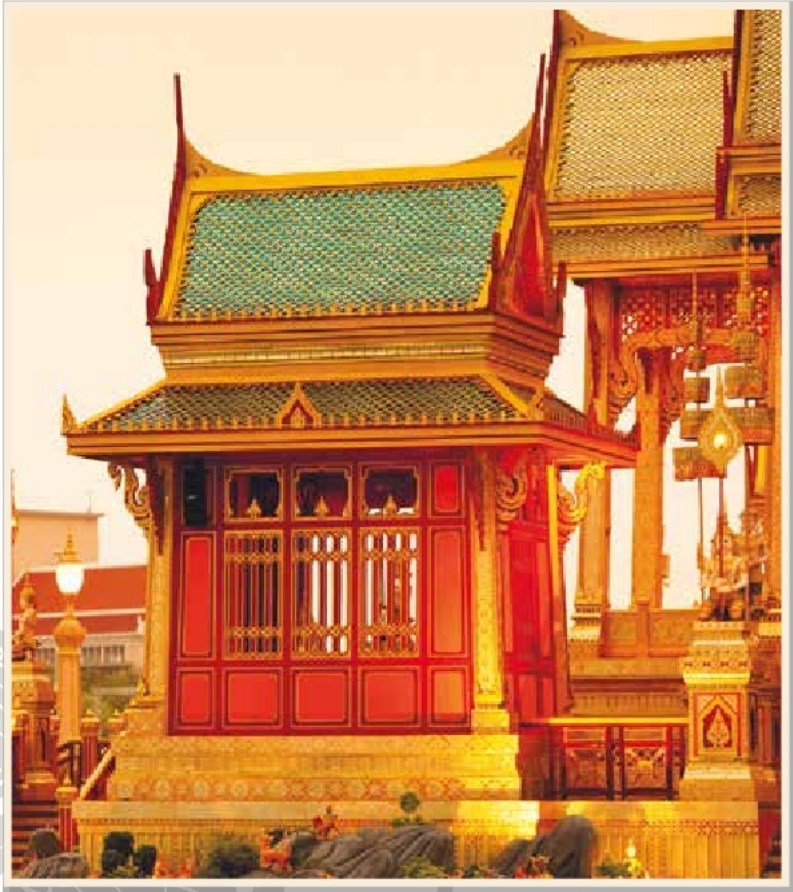
ช่างในงานพระเมรุ สมเด็จพระเจ้าภคินีเธอ เจ้าฟ้าเพชรรัตนราชสุดา สิริโสภาพัณณวดี