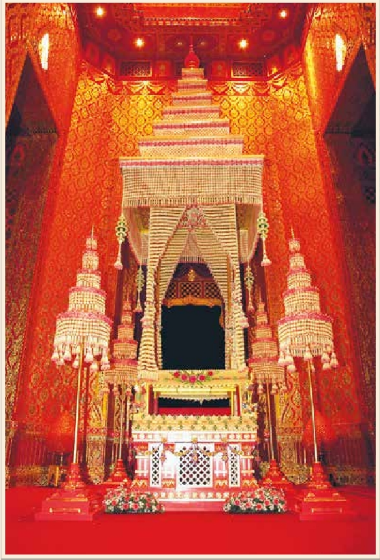
พระจิตกาธานที่ประดับเครื่องสดเรียบร้อยแล้วในงานพระเมรุ สมเด็จพระเจ้าภคินีเธอ เจ้าฟ้าเพชรรัตนราชสุดา สิริโสภาพัณณวดี