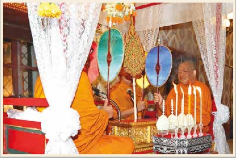
พระพิธีธรรมสวดพระอภิธรรมในการพระราชพิธีบำเพ็ญพระราชกุศล พระบรมศพ พระบาทสมเด็จพระปรมินทรมหาภูมิพลอดุลยเดช