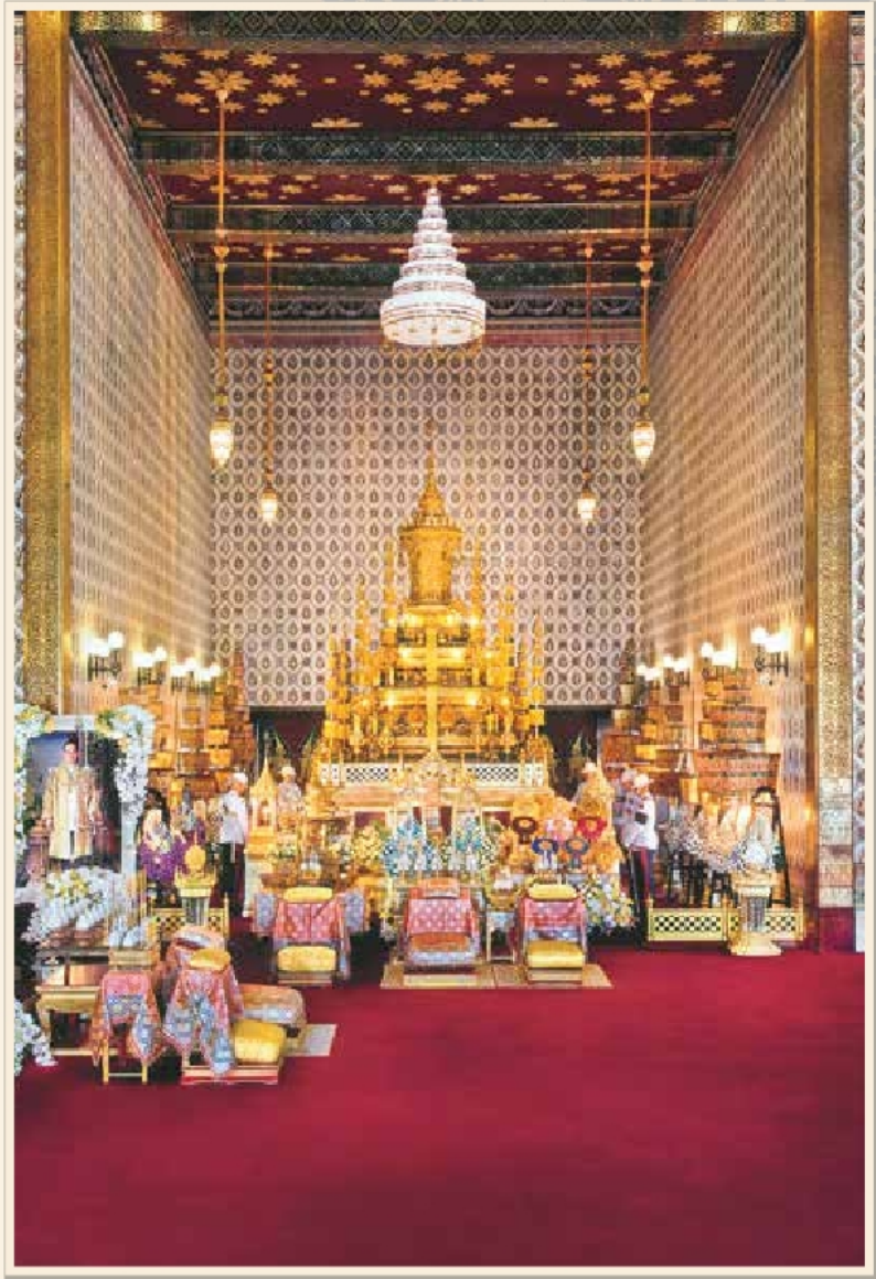
พระโกศทองใหญ่ทรงพระบรมศพ พระบาทสมเด็จพระปรมินทรมหาภูมิพลอดุลยเดช ประดิษฐานบนพระเบญจจา ภายในพระที่นั่งดุสิตมหาปราสาท