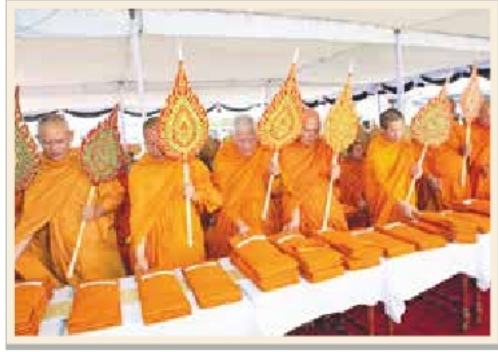
พระสงฆ์สดับปกรณ์ที่ประำ ณ พระลานพระที่นั่งดุสิตมหาปราสาท ในงานพระเมรุ สมเด็จพระเจ้าภคินีเธอ เจ้าฟ้าเพชรรัตนราชสุดา สิริโสภาพัณณวดี