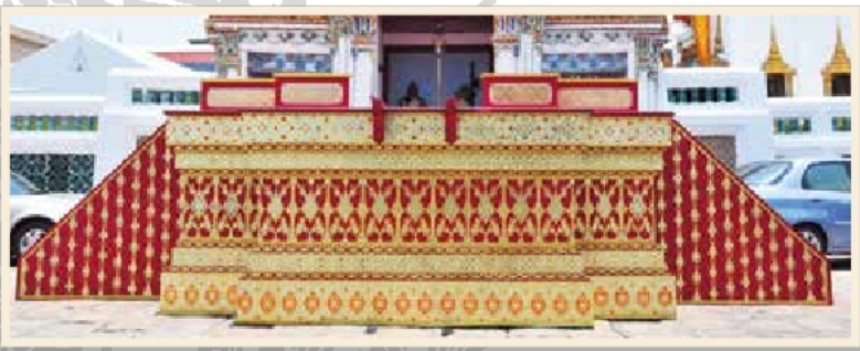
เกยลาในงานพระศพ สมเด็จพระเจ้าภคินีเธอเจ้าฟ้าเพชรรัตนราชสุดา สิริโสภาพัณณวดี

เป็นแท่นฐานยกพื้นสี่เหลี่ยมย่อมุม มีรางเลื่อนสำหรับเชิญพระบรมโกศ หรือพระโกศชั้นประดิษฐานบนพระยานมาศ ตั้งอยู่ด้านหน้าประตูกำแพงแก้ว ด้านทิศตะวันตกของพระที่นั่งดุสิตมหาปราสาท ในพระบรมมหาราชวัง มีบันไดขึ้นลง ๓ ด้าน คือ ด้านตะวันออกเป็นที่อัญเชิญพระบรมโกศ หรือพระโกศจากพระที่นั่งดุสิตมหาปราสาทขึ้นเกย ด้านเหนือและด้านใต้สำหรับเจ้าพนักงานส่วนด้านตะวันตกเป็นที่เทียบพระยานมาศสามลำคาน เพื่ออัญเชิญพระบรมโกศ หรือพระโกศชั้นประดิษฐาน