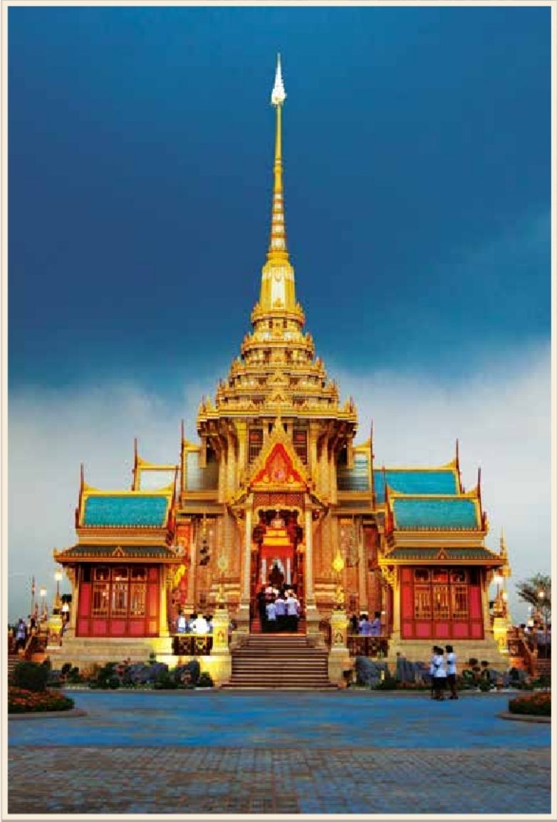
พระเมรุในการพระราชพิธีพระราชทานเพลิงพระศพ สมเด็จพระเจ้าภคินีเธอ เจ้าฟ้าเพชรรัตนราชสุดา สิริโสภาพัณณวดี