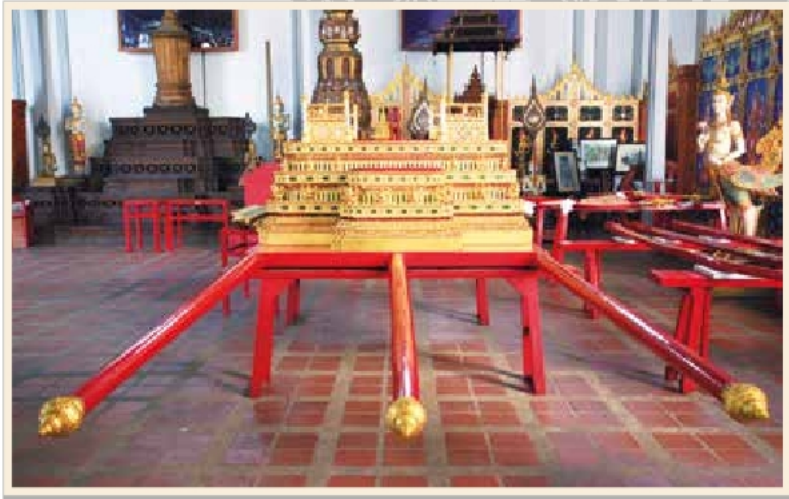
พระยานมาศสามลำคาน เก็บรักษาอยู่ในโรงราชรถ พิพิธภัณฑสถานแห่งชาติ พระนคร