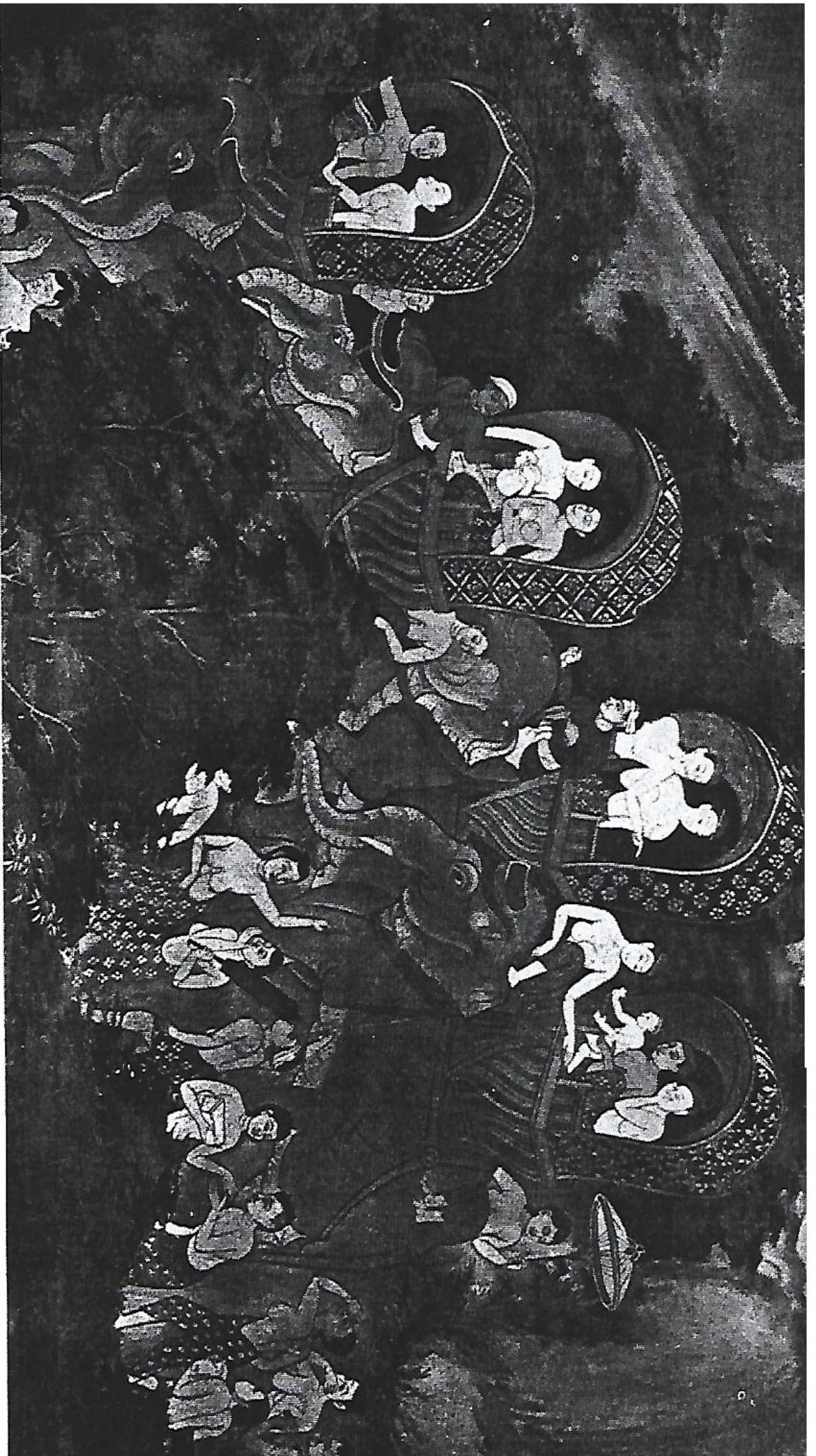
ภาพที่ ๒ (คู่มือโบราณคดีหน้า ๓๑) FIG. 2. " THE CORTEGE OF QUEEN MAHAMAYA RIDING TO LUMBINI PARK" Detail of a mural painting at Wat Suwandaram , Dhonburi