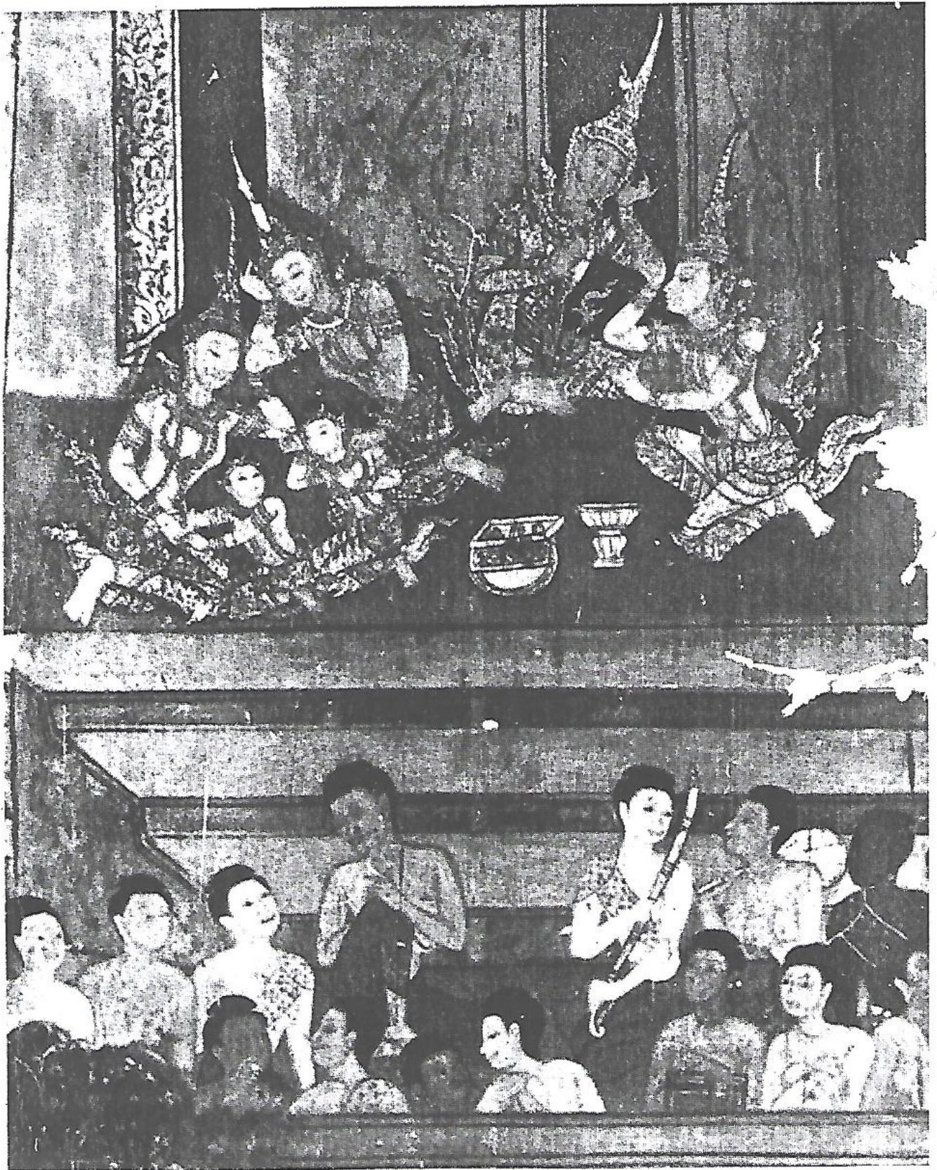
ภาพที่ ๑ (ต่อธิบายภาพในหน้า ๒๕)