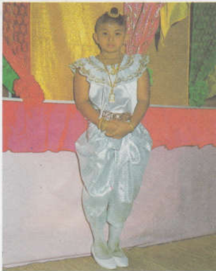
การแต่งกายของเด็กในเย็นวันแรกในพิธีทำขวัญโกนจุก