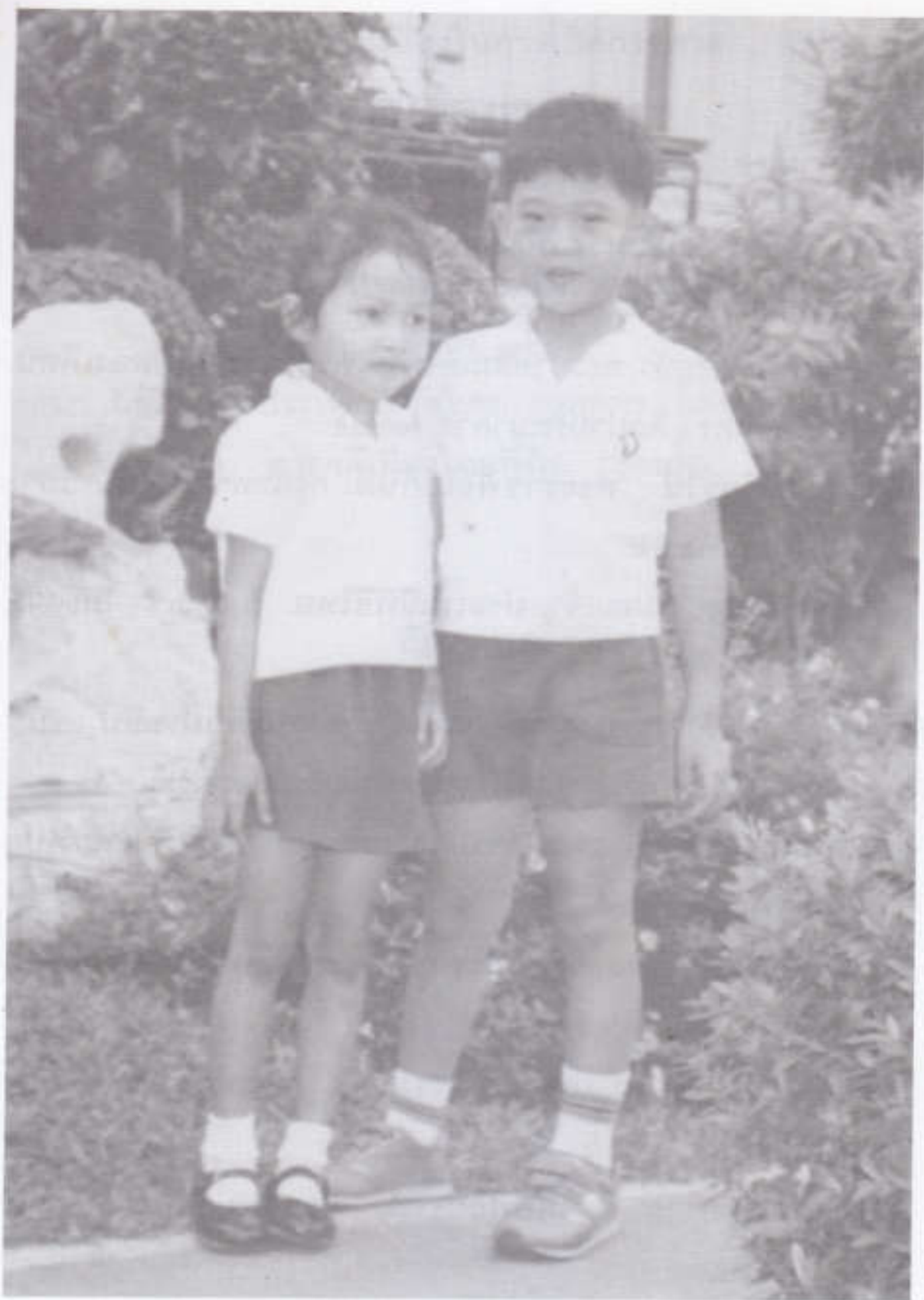
เด็กผู้ชายไว้ผมรองทรงหรือผมเกรียน