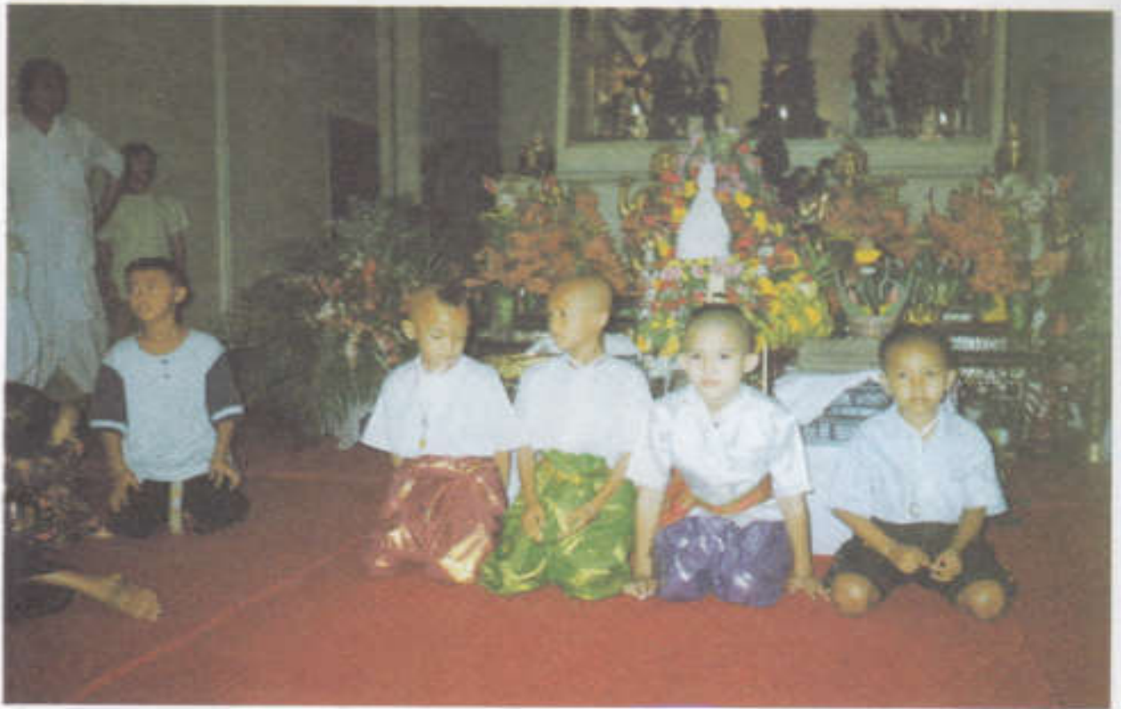
เด็กไว้ผมจุก แกละ โกะะ เปีย