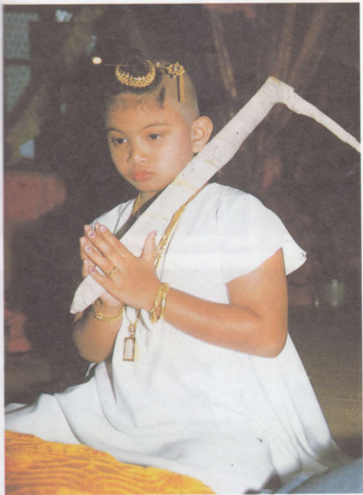
พิธีพระสงฆ์เจริญพระพุทธมนต์เช้าวันที่สองของการโกนจุก