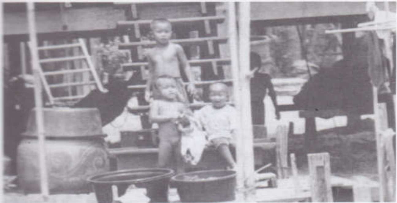
การไว้ผมจุก ตามวิถีชีวิตของเด็กไทยในชนบท คลองเจ้าเจ็ด อำเภอสเตนา จังหวัดพระนครศรีอยุธยา

การวิจัยเกี่ยวกับวัฒนธรรมการเลี้ยงดูเด็กไทย กุศลใจของบุคคลที่ประสงค์จะช่วยเหลือ วัฒนธรรมไทย