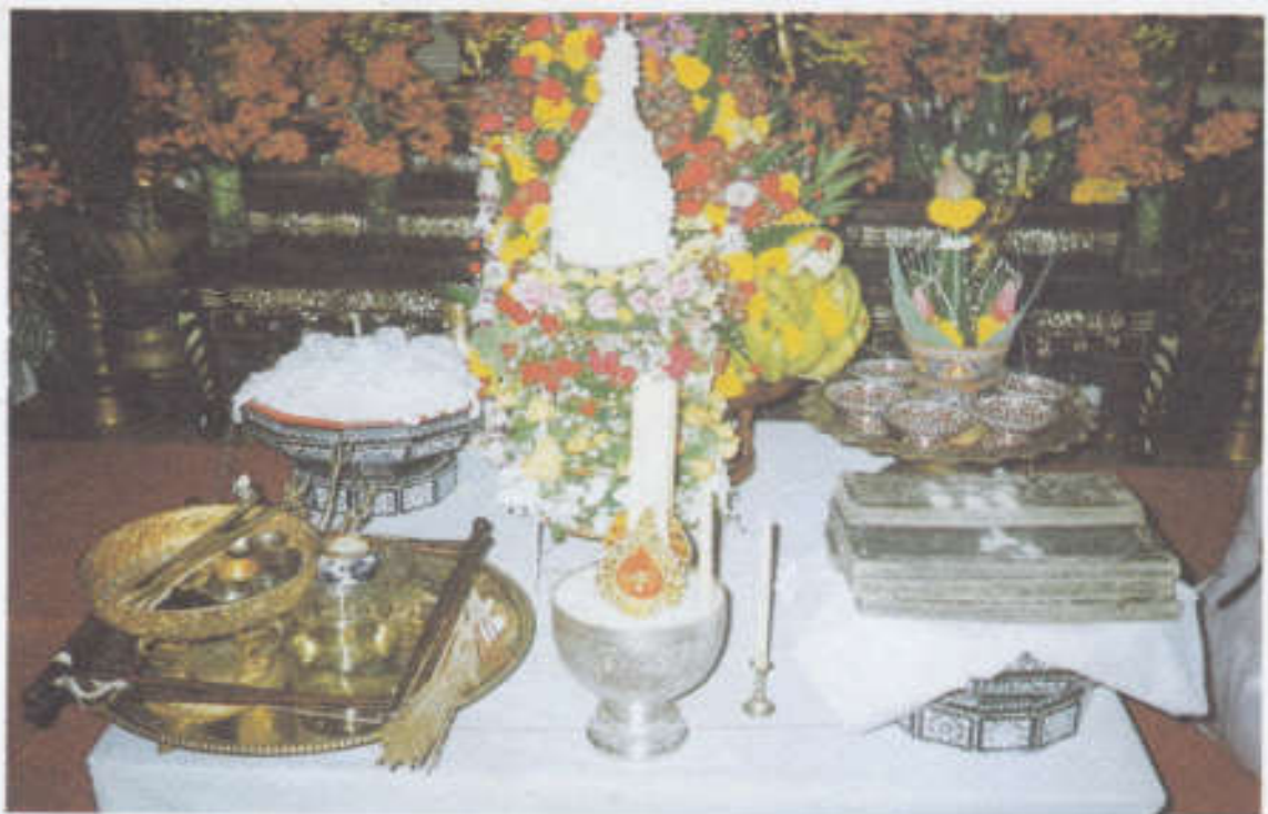
เครื่องใช้ในการโกนจุก ที่ใส่พานในภาคทองและสายสิญจน์ ในพิธีตรียัมปวายที่โบสถ์พราหมณ์