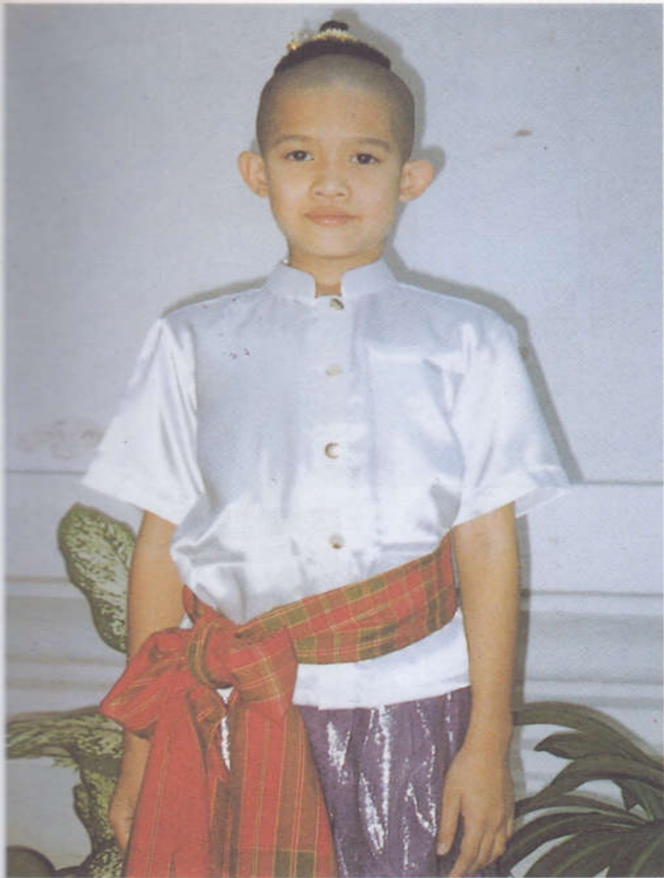
ผมจุกควั่นเรียบร้อย