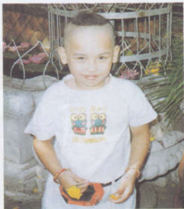
ผมจุกที่ตัดเปียให้เรียบร้อย