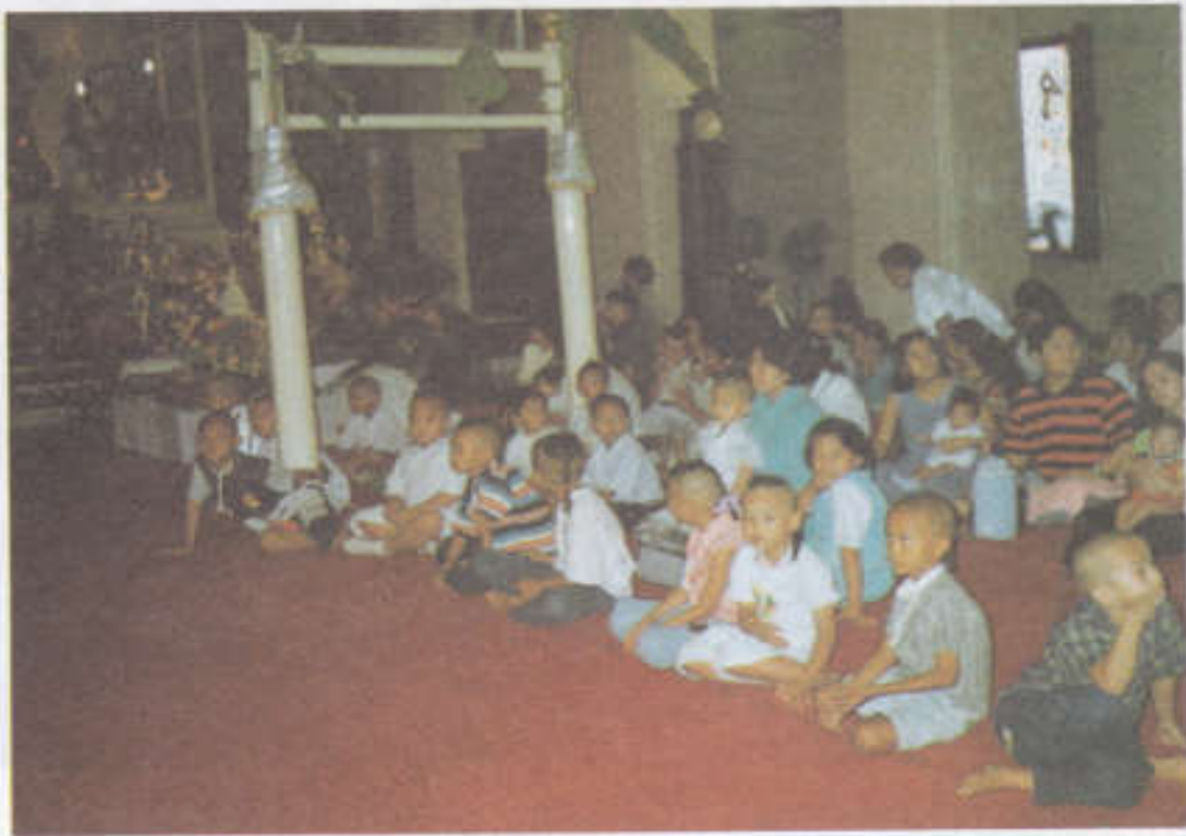
เด็กที่เข้าพิธีโกนจุกที่โบสถ์พราหมณ์ ในเย็นวันแรกเพื่อฟังพระสวด