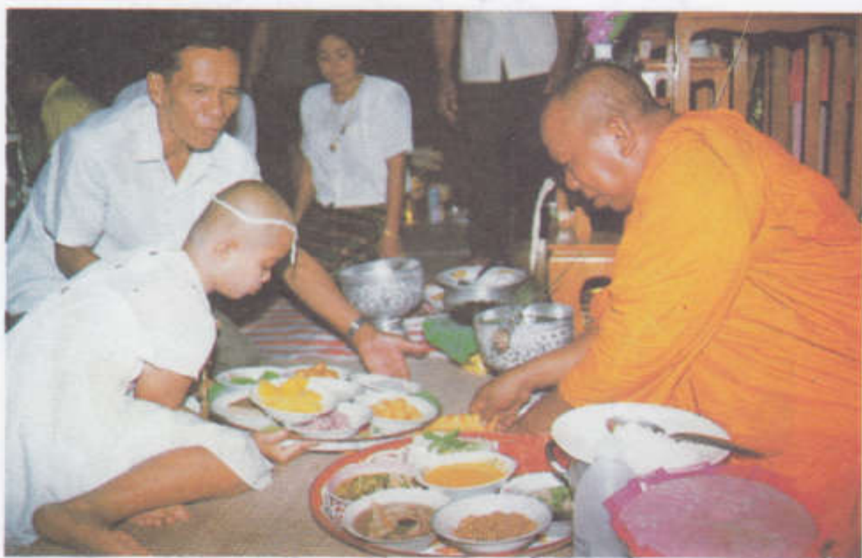
ถวายภัตตาหารแด่พระสงฆ์