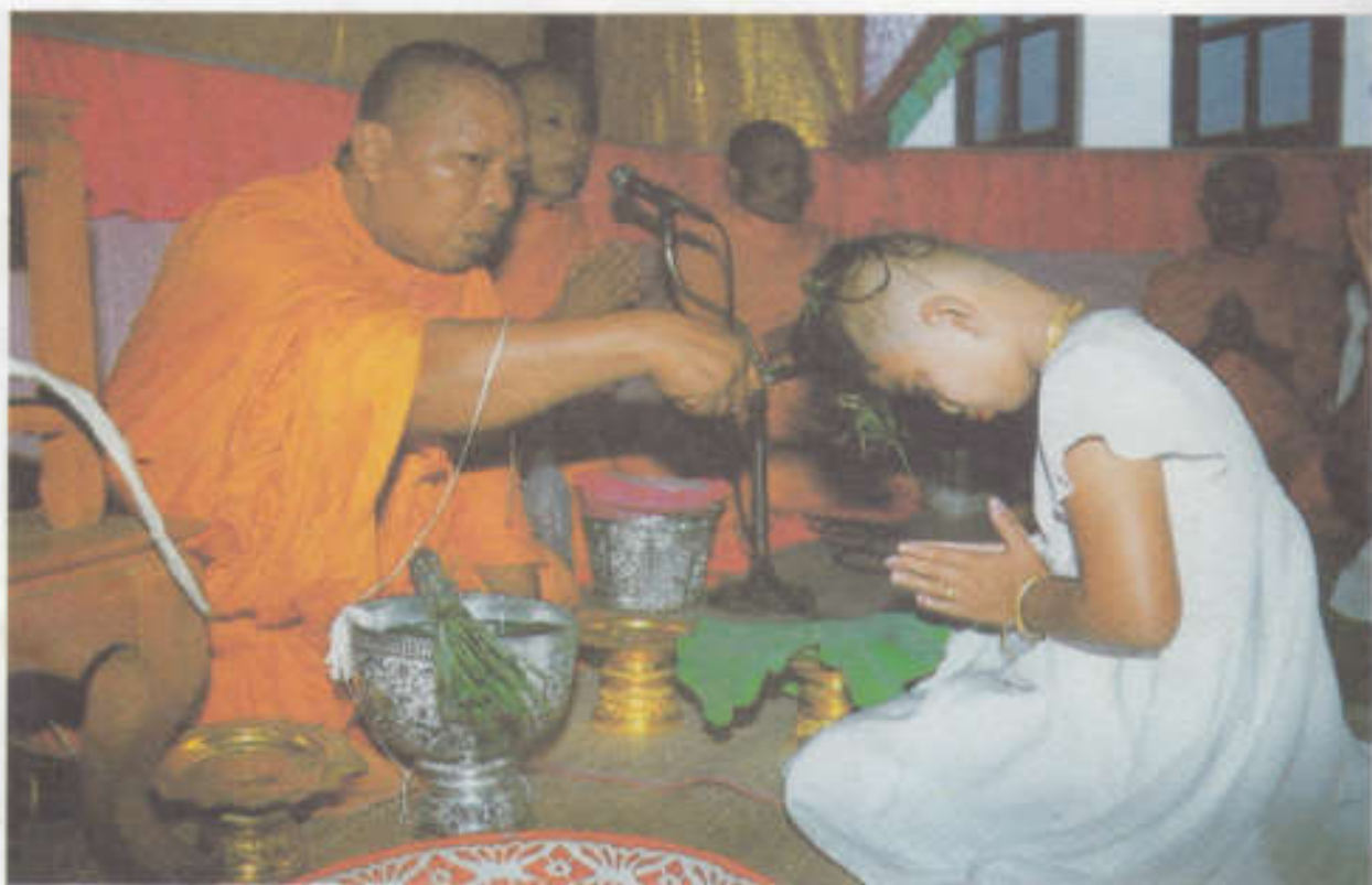
พระสงฆ์เป็นประธานในการตัดจุก