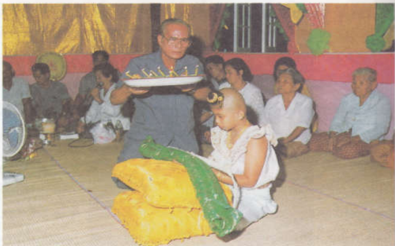
หมอบำเพ็ญเตรียมพิธีทำขวัญโกนจุกในเย็นวันแรก