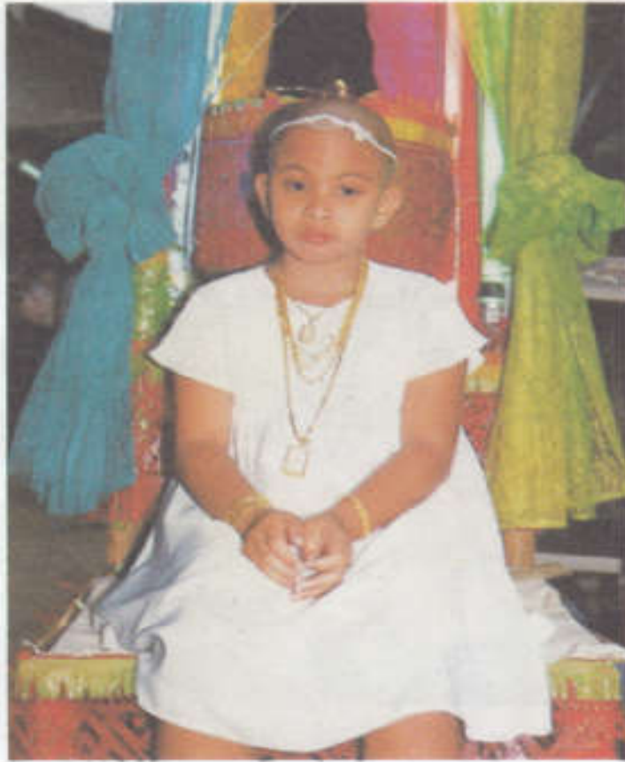
หลังจากโกนผมเสร็จเรียบร้อยแล้วพาเด็กมานั่งที่เบญจา เพื่อรอรับน้ำจากญาติผู้ใหญ่