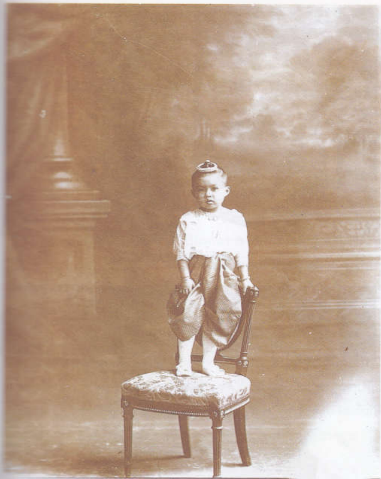
พระวรวงศ์เธอ พระองค์เจ้ารำไพประภา