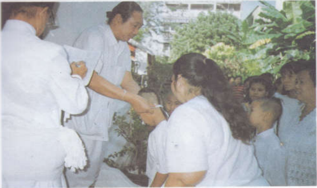
พราหมณ์สวมสายสิญจน์มงคลให้กับเด็กที่โกนจุก