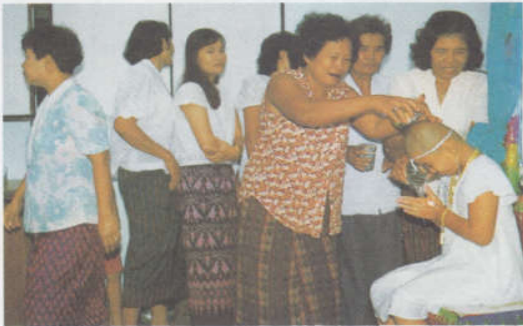
บรรดาญาติผู้ใหญ่รดน้ำให้พร