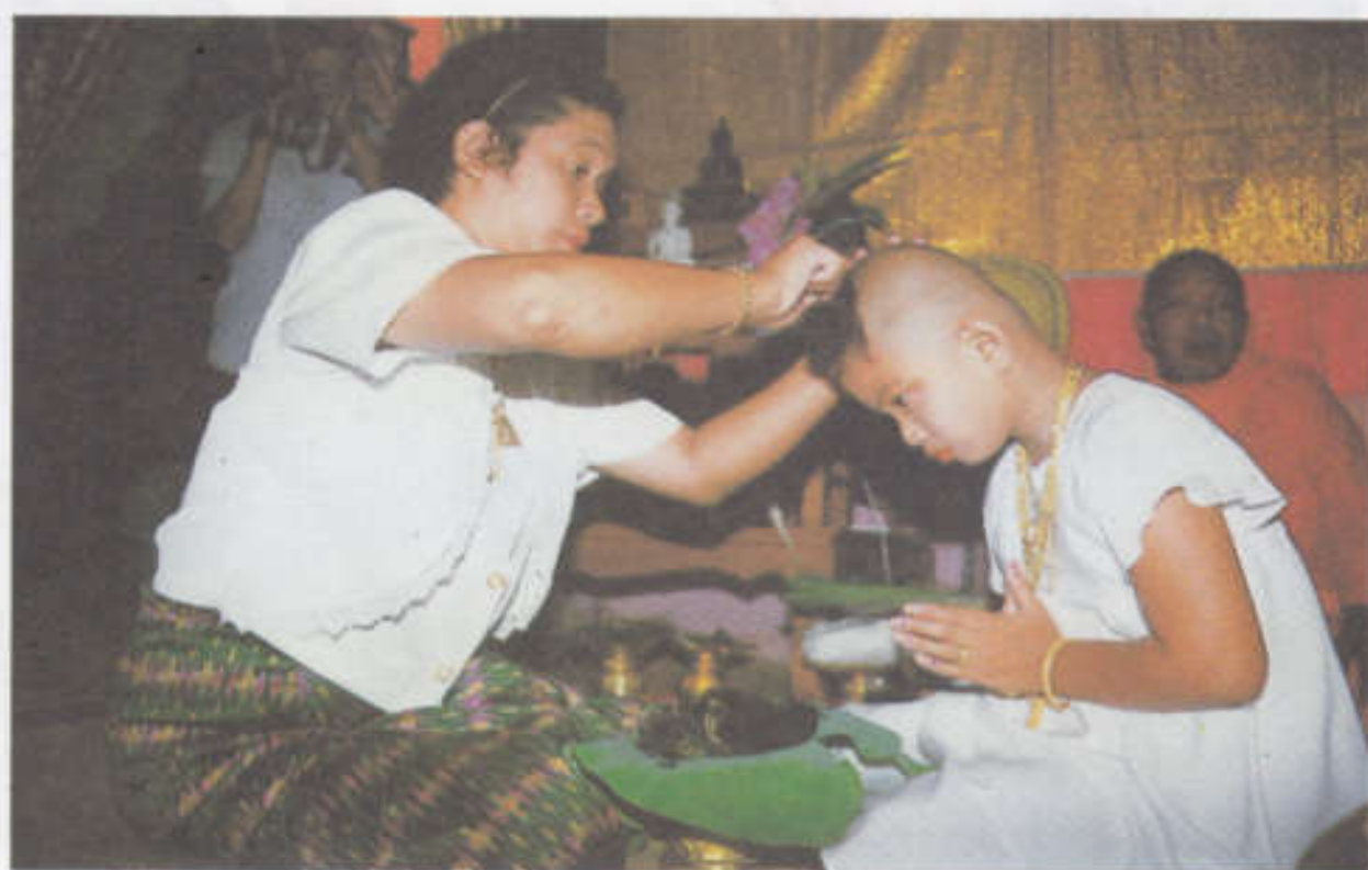
มารดาทำลังตัดจุก