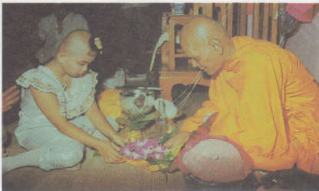
เด็กถวายไทยธรรมแด่พระสงฆ์ที่มาสวดพระพุทธรูปในเย็นวันแรก