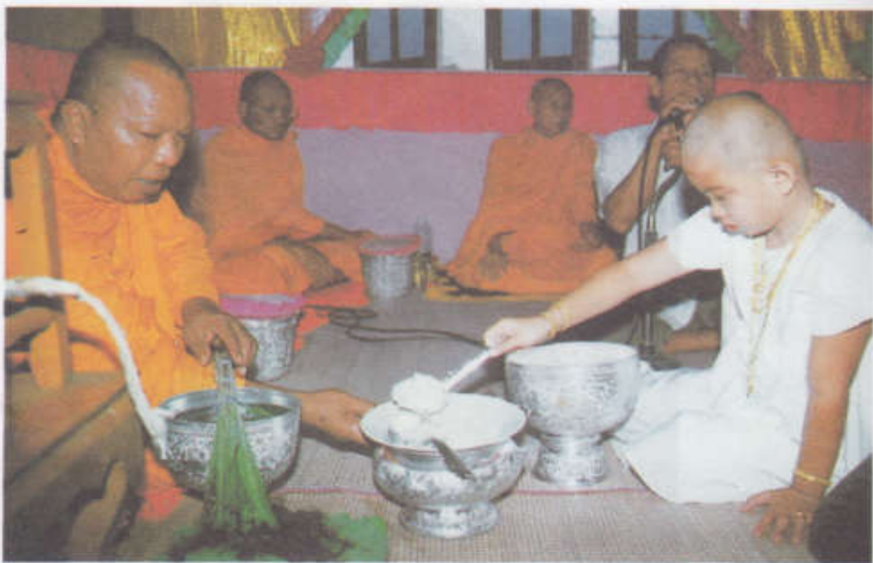
ตักบาตรพระสงฆ์หลังการรดน้ำ