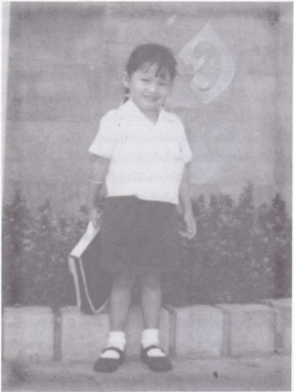
เด็กหญิงไว้ผมสั้นหรือผมยาวรวบผมและถักเปีย